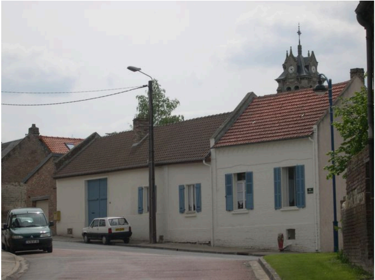
Ferme, rue d'Amiens.