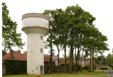
Le château d'eau. IVR22_20038000426NUCA