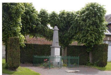
Le monument aux morts. IVR22_20038000416NUCA