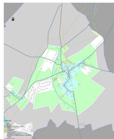
Schéma.