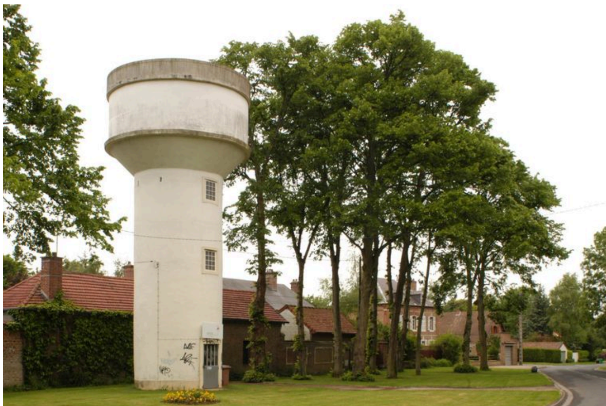
Le château d'eau.