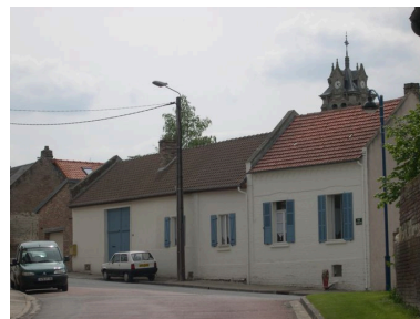
Ferme, rue d'Amiens. IVR22_20038010373NUCA