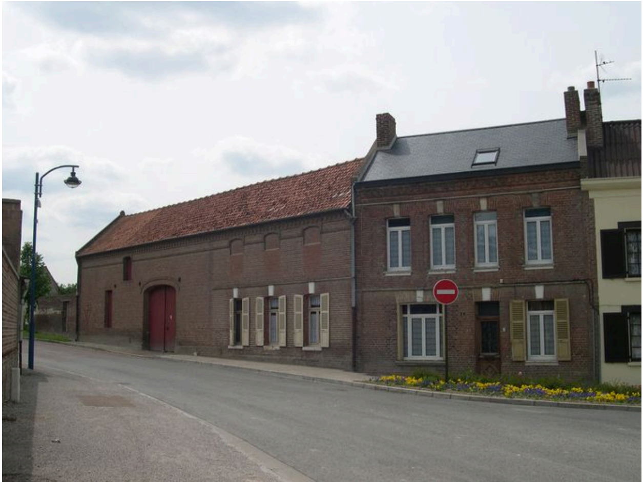
Maison et ferme, rue de Cagny.