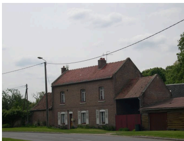
Maison, 12 rue de l'Eglise. IVR22_20038010369NUCA