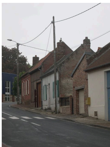
Rue d'Amiens.