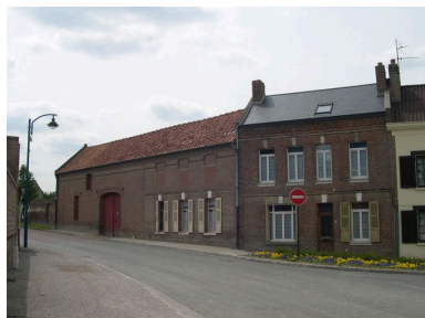
Maison et ferme, rue de Cagny.