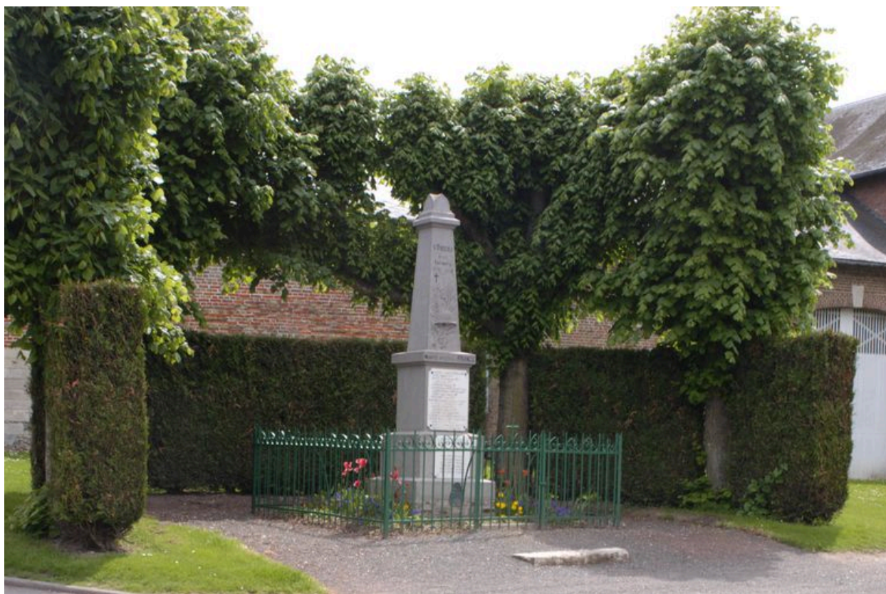
Le monument aux morts.