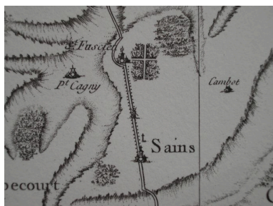
Extrait de la carte de Cassini.