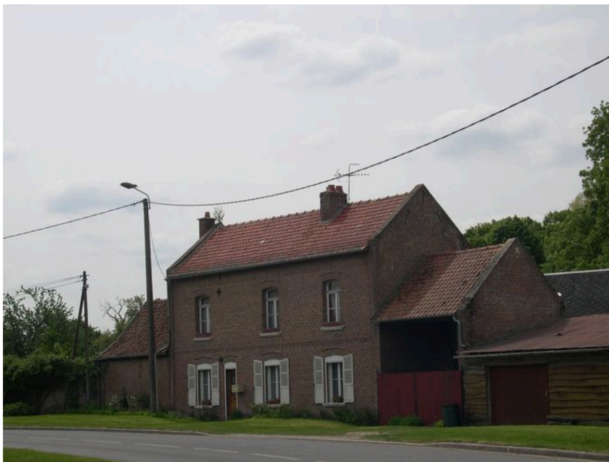
Maison, 12 rue de l'Eglise.