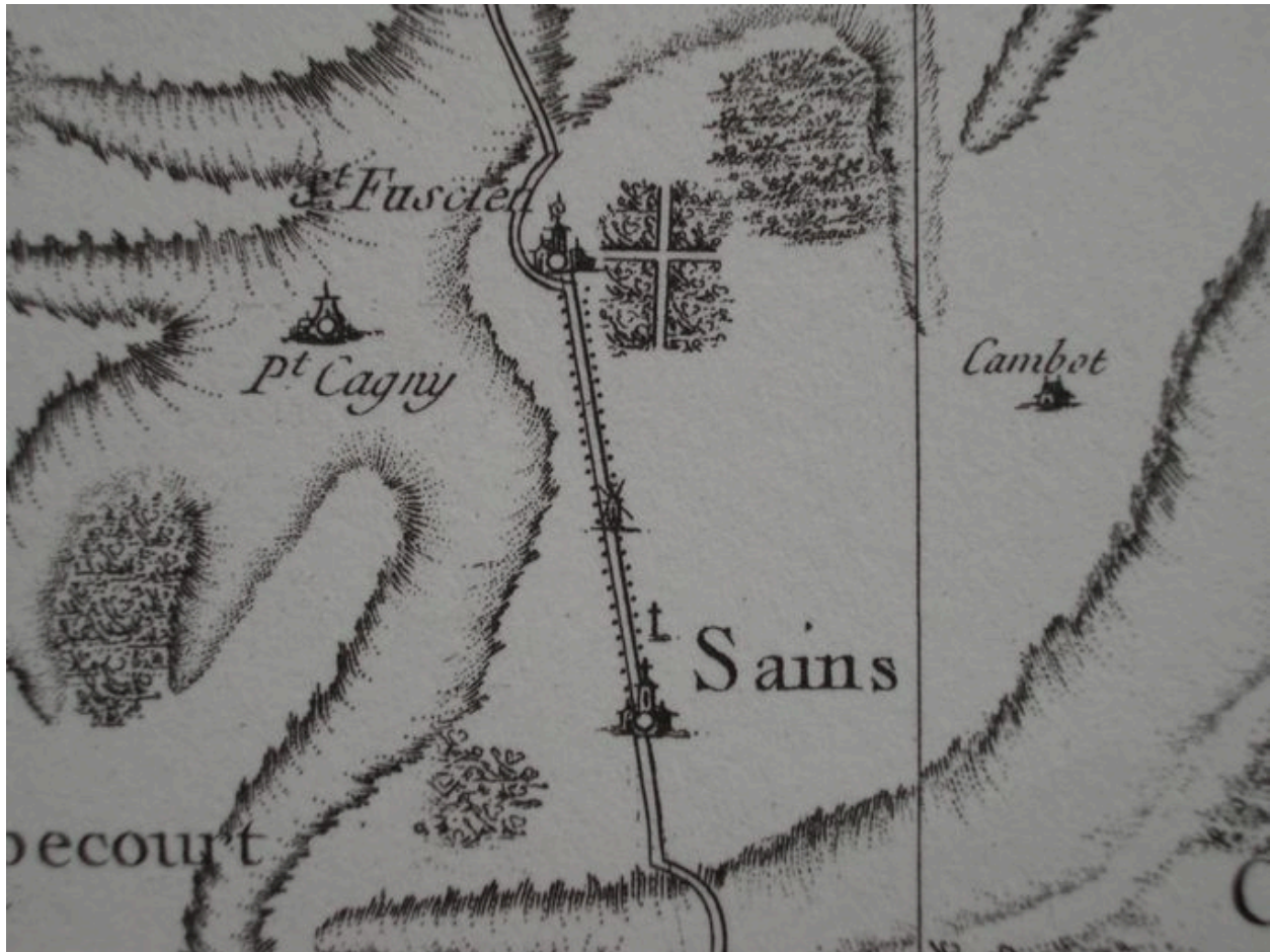
Extrait de la carte de Cassini.