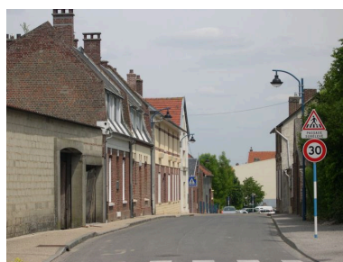
Rue de Cagny. IVR22_20038010379NUCA