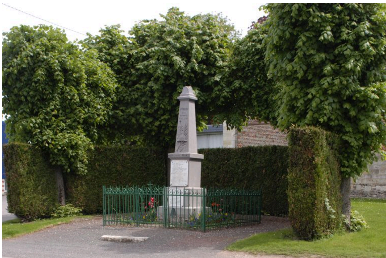
Le monument aux morts.