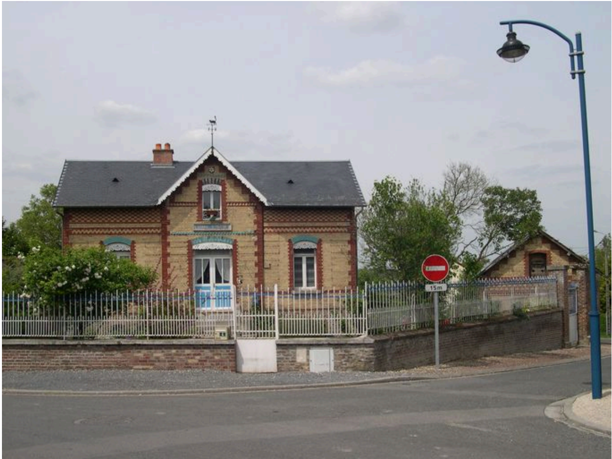
Maison, 4 rue du Puits, début 20e siècle.