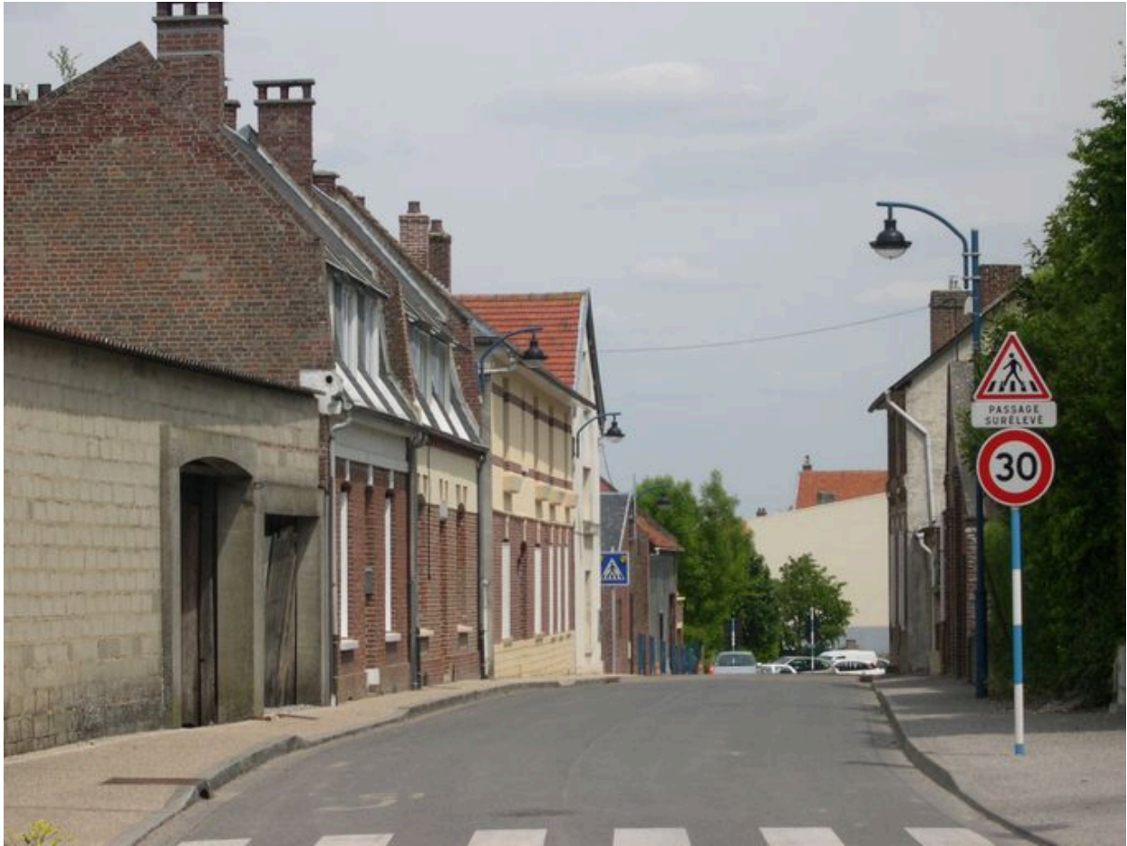
Rue de Cagny.