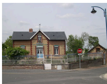
Maison, 4 rue du Puits, début 20e siècle. IVR22_20038010370NUCA