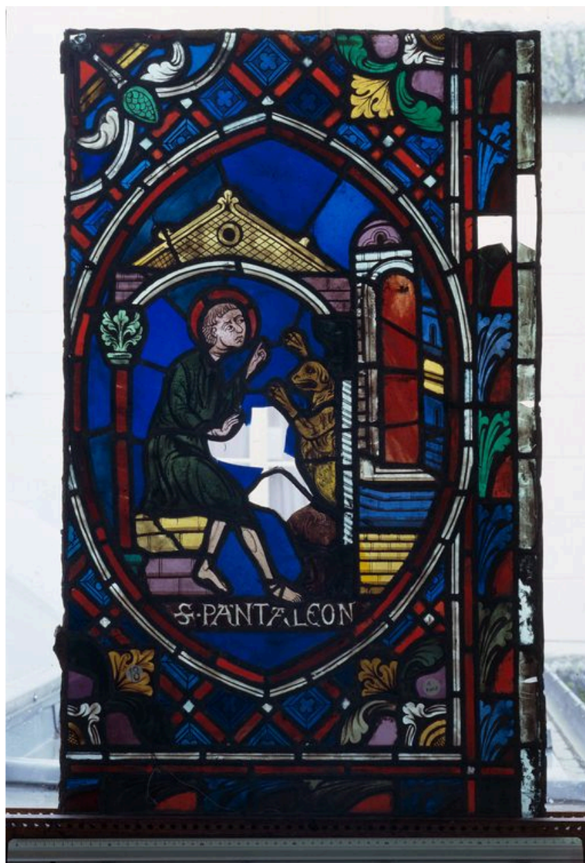
Détail, registre inférieur.