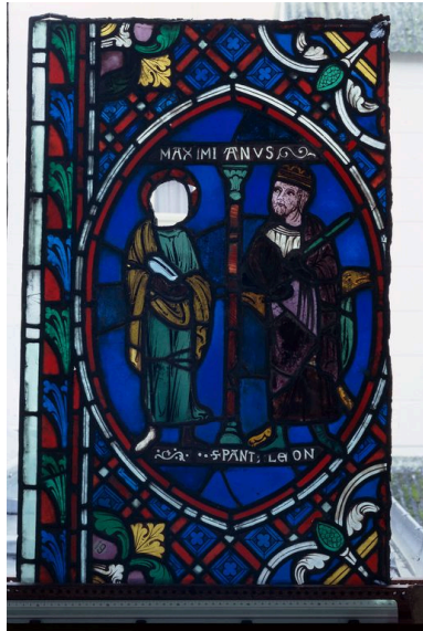
Détail, registre supérieur. IVR22_19846001288XA