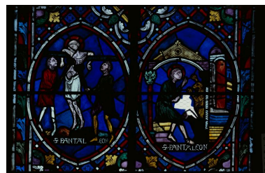
Registre inférieur. IVR22_19846000558XA