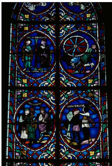
Partie supérieure de la baie. IVR22_19846000559XA