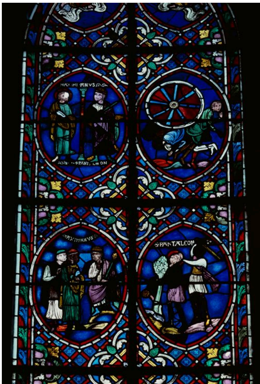
Partie supérieure de la baie.