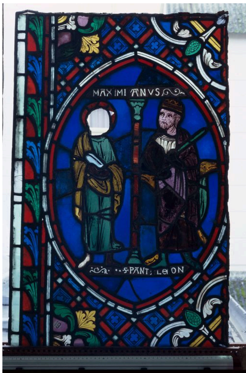
Détail, registre supérieur.