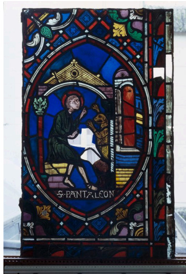
Détail, registre inférieur. IVR22_19846001290XA