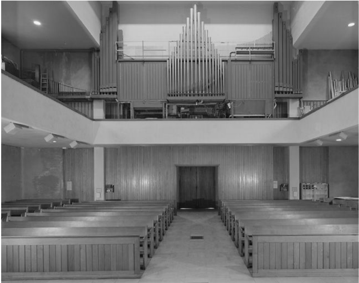
Vue intérieure depuis le chœur.