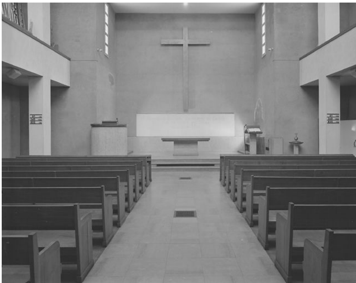
Vue intérieure vers le chœur.