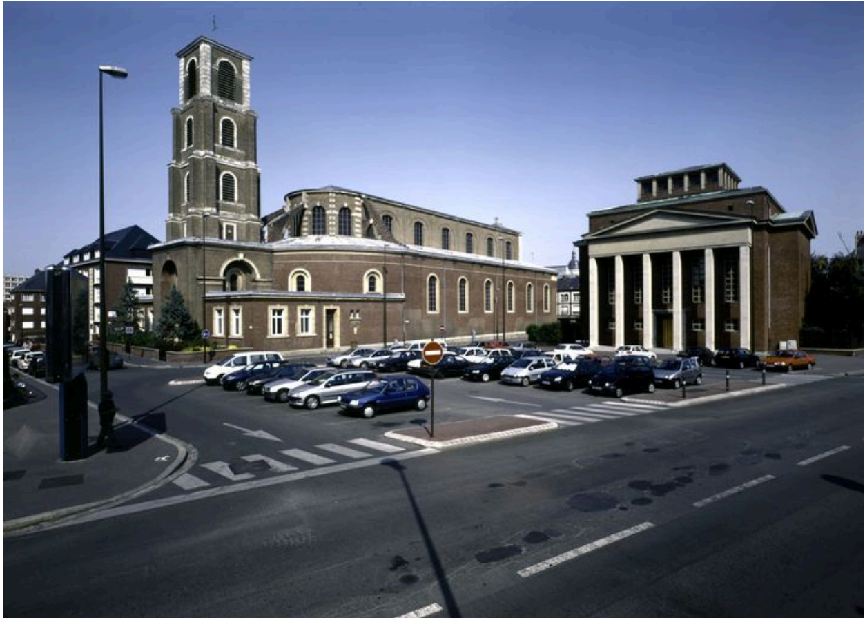
Vue de situation, depuis le sud-ouest.