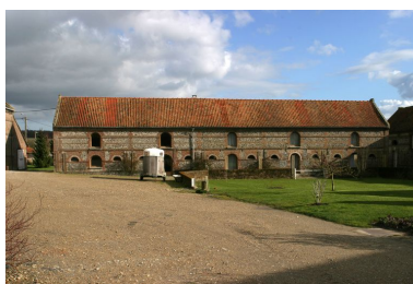
Etables composées d'une structure en brique avec remplissage de blocage de silex.

Phot. Irwin Leullier IVR22_20078000164NUCA