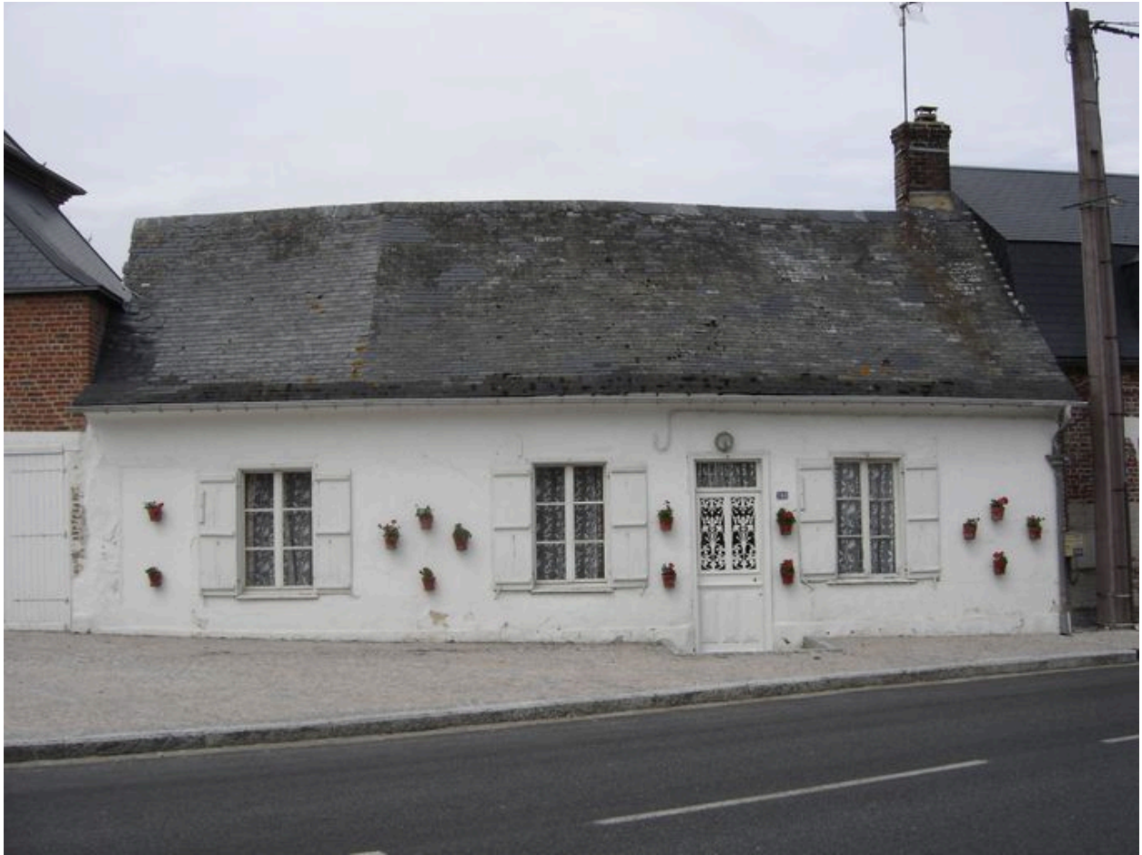
Autre exemple d'un logis de ferme traditionnelle de l'arrière-pays maritime.