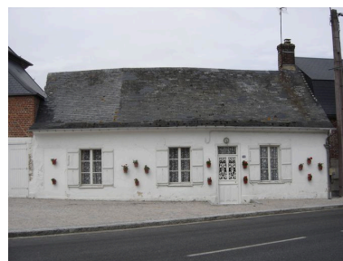
Autre exemple d'un logis de ferme traditionnelle de l'arrière-pays maritime.