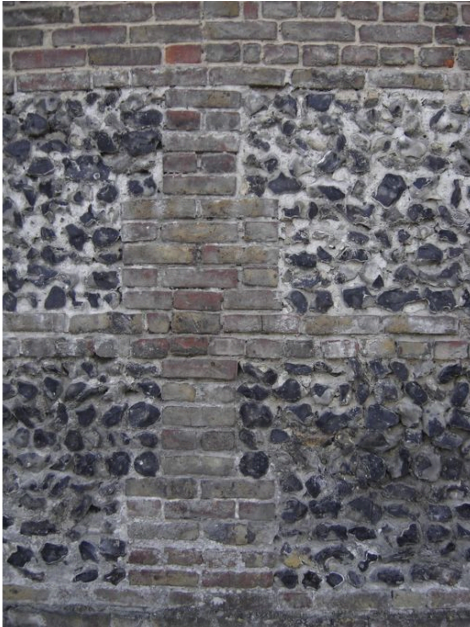
Vue détaillée d'un appareillage mixte de brique et silex.