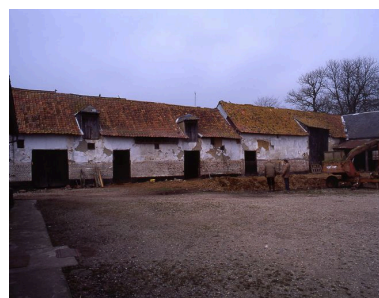
Bâtiments agricoles construits en torchis et pans de bois sur solin de brique avec couverture en pannes picardes.

IVR22_20078000175NUCA