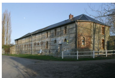
Etables surmontées de fenil construites en brique avec remplissage de blocage de galets.

IVR22_20078000164NUCA