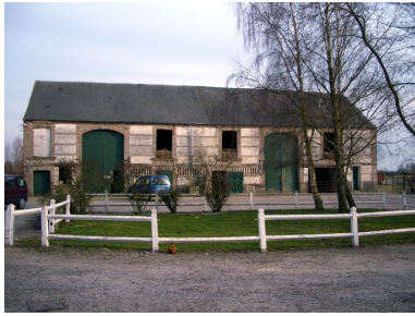
Exemple de grange avec étables édifiées en brique et silex ou galet.