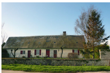
Exemple de logis d'une ferme traditionnelle de l'arrière-pays maritime.