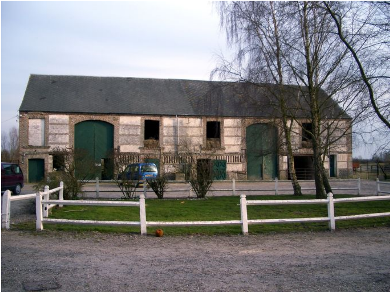
Exemple de grange avec étables édifiées en brique et silex ou galet.