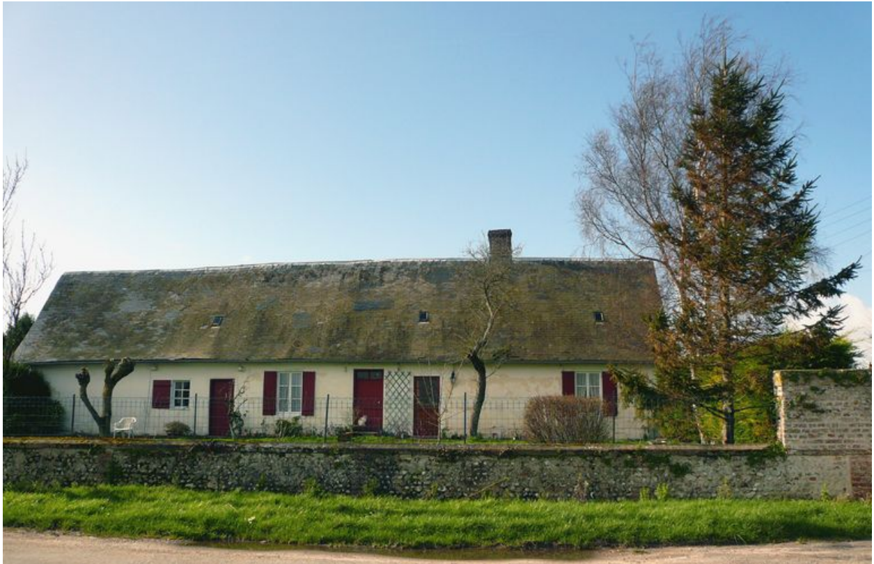
Exemple de logis d'une ferme traditionnelle de l'arrière-pays maritime.