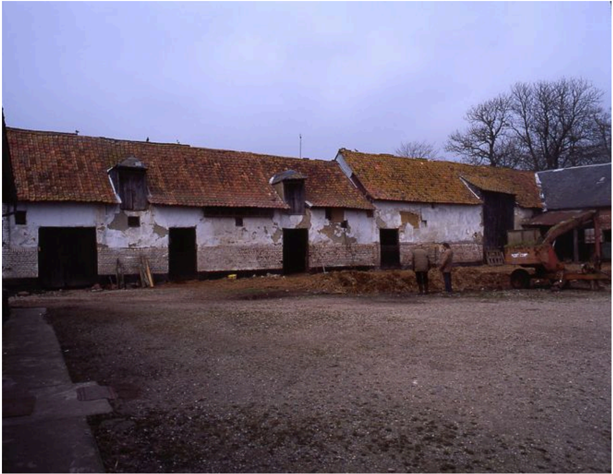
Bâtiments agricoles construits en torchis et pans de bois sur solin de brique avec couverture en pannes picardes.