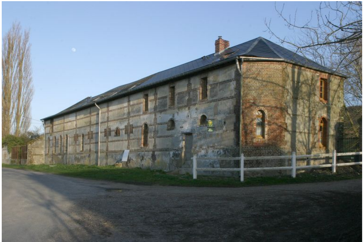
Etables surmontées de fenil construites en brique avec remplissage de blocage de galets.