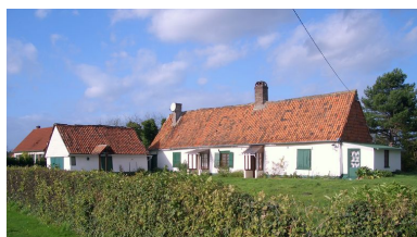
Parfait exemple de ferme de ménager construite aux 18 e et 19 e siècle.