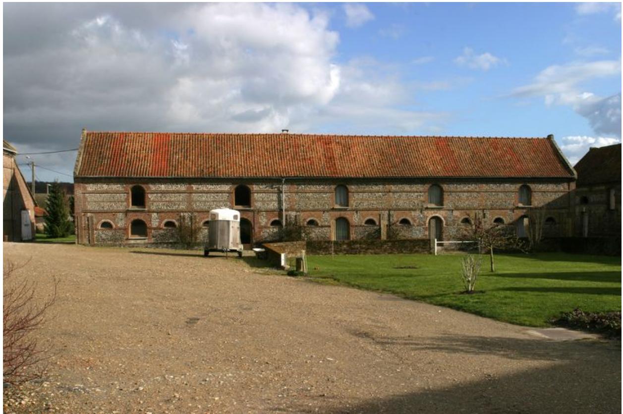
Etables composées d'une structure en brique avec remplissage de blocage de silex.