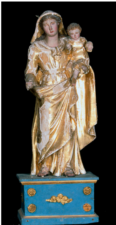
Vue générale. IVR22_19998001390ZA