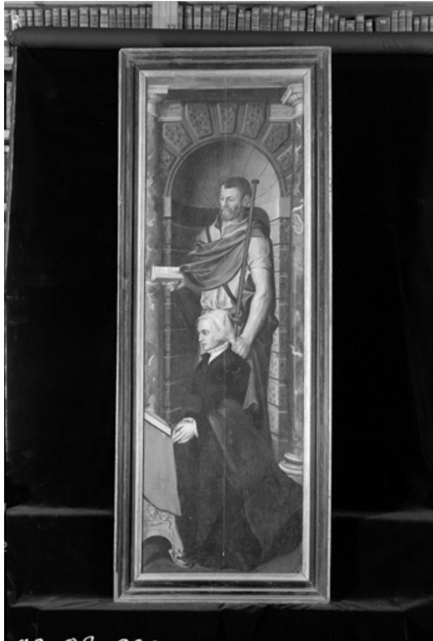
Volet gauche, portrait de la donatrice, huile sur bois, 16e siècle ; déposé au musée Jean de La Fontaine.