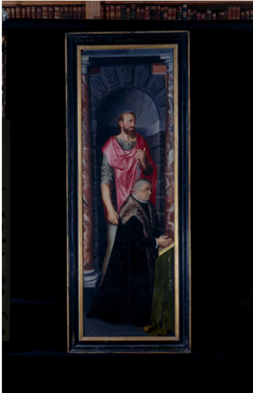
Volet droit, donateur en prière avec saint Pierre, huile sur bois, 16e siècle ; déposé au musée Jean de La Fontaine.