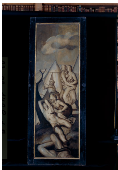
revers du volet de droite : les israélites décimés par les serpents, huile sur toile, 16e siècle ; déposé au musée Jean de La Fontaine.

Phot. Thierry Lefébure IVR22_19930201426XA