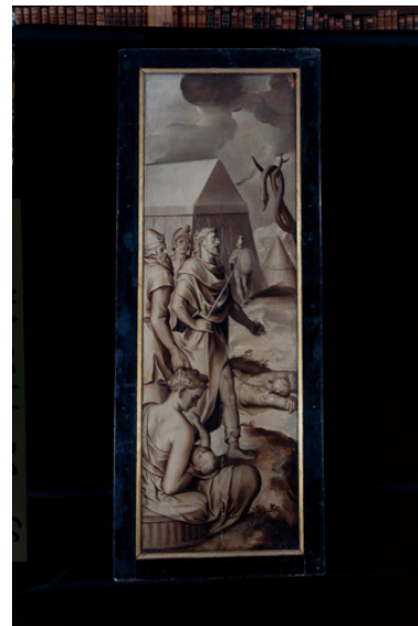
Revers du volet gauche : Moïse et le Serpent d'Airain, huile sur bois, 16e siècle ; déposé au musée Jean de La Fontaine.

IVR22_19930201425XA