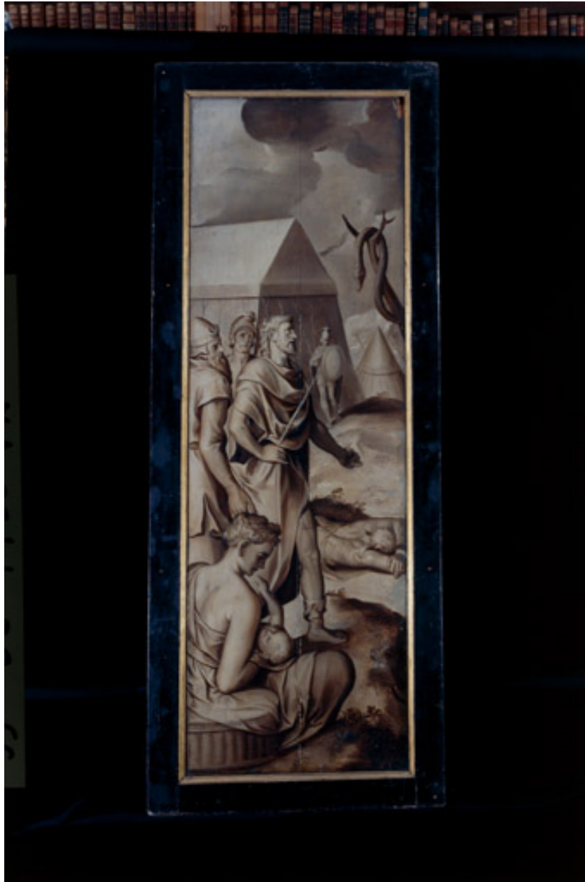
Revers du volet gauche : Moïse et le Serpent d'Airain, huile sur bois, 16e siècle ; déposé au musée Jean de La Fontaine.