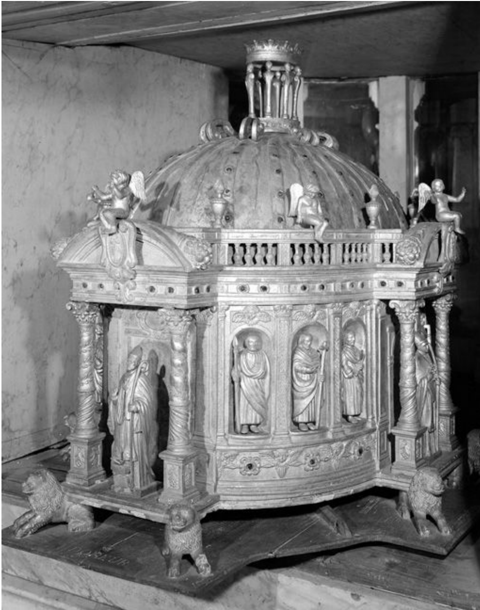
Vue de trois-quarts.