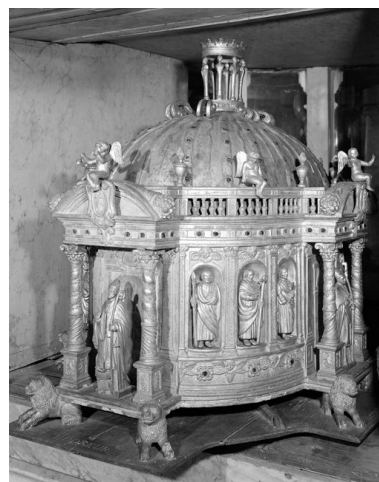
Vue de trois-quarts. IVR22_19846000892V