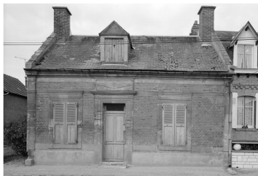
Vue générale. IVR22_19846001145X

Plan de situation. Extrait du plan cadastral de 1982, section CI 436. IVR22_20096000174NUCA