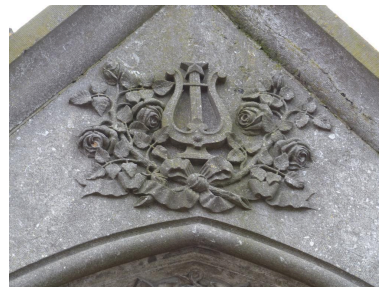
Vue du décor sculpté sur le fronton.