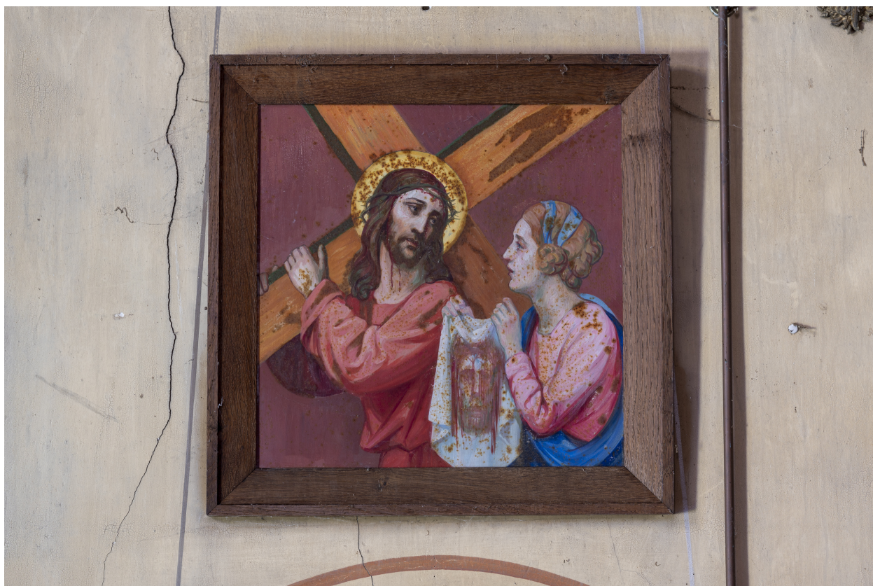
Station du Chemin de Croix.