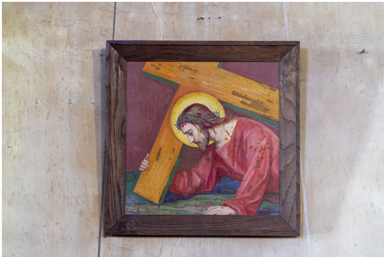
Station du Chemin de Croix.