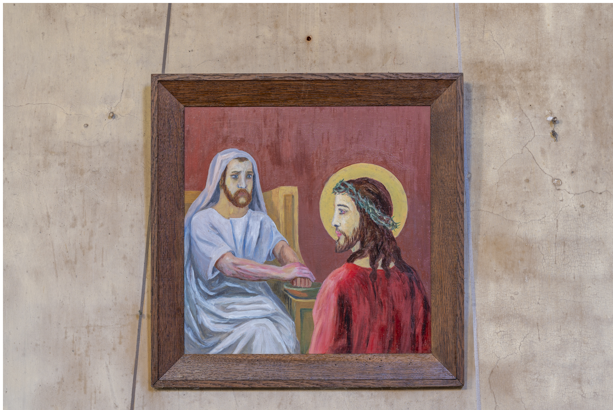
Station du Chemin de Croix.