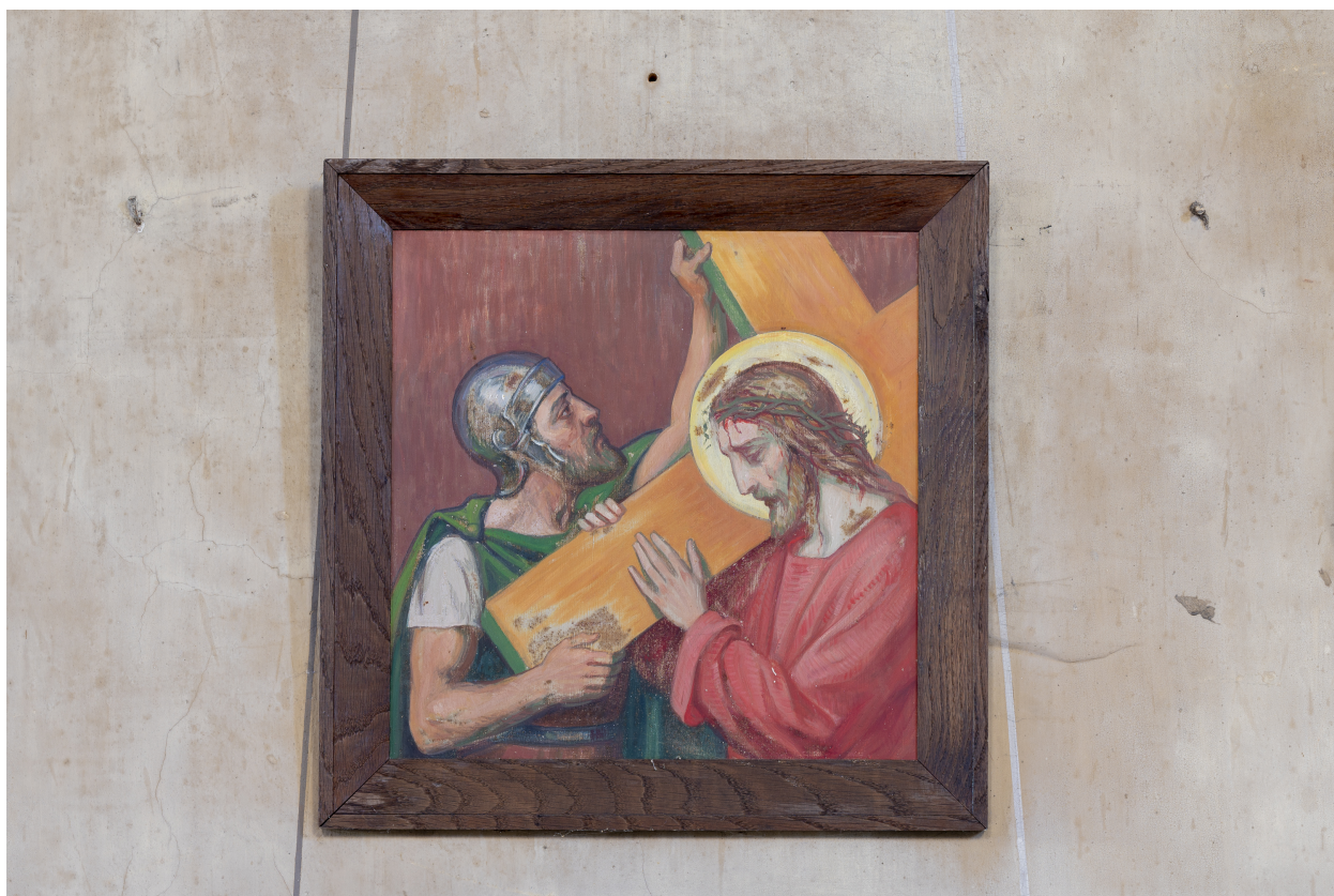
Station du Chemin de Croix.