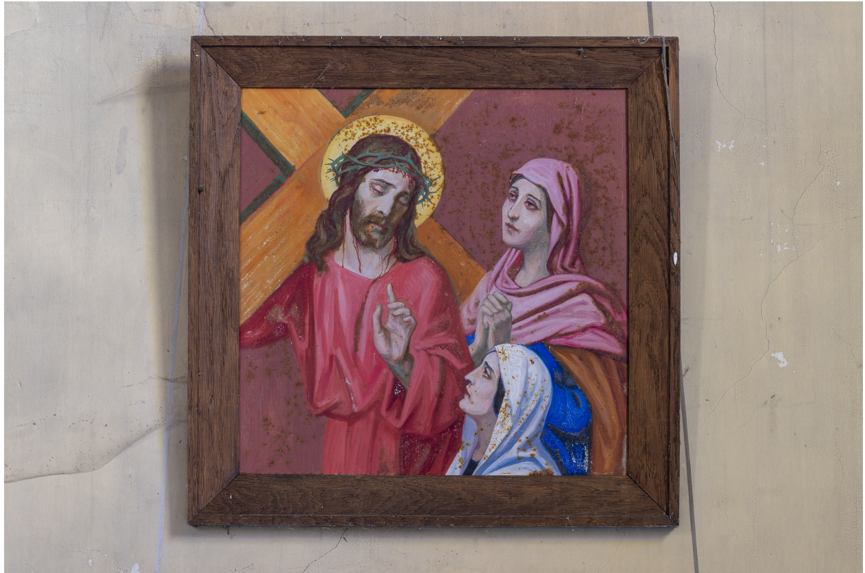
Station du Chemin de Croix.