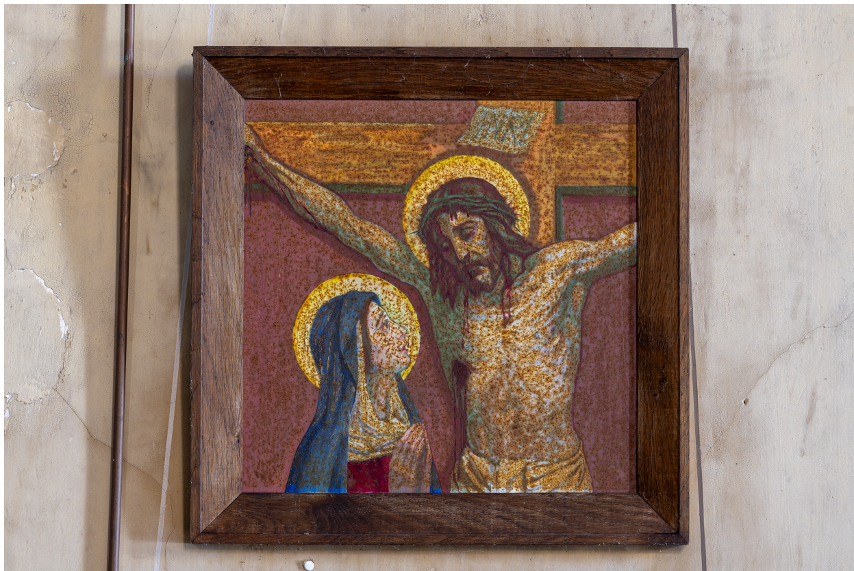
Station du Chemin de Croix.