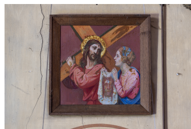
Station du Chemin de Croix. IVR32_20250200296NUCA