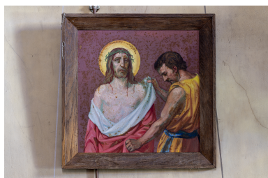
Station du Chemin de Croix.