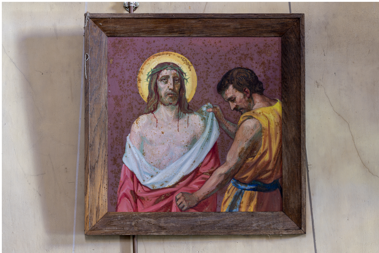
Station du Chemin de Croix.