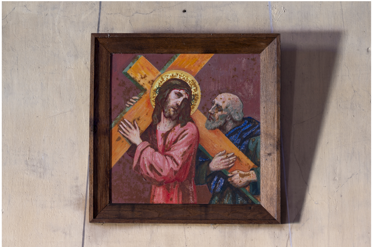
Station du Chemin de Croix.