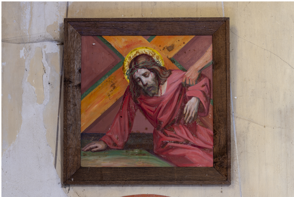
Station du Chemin de Croix.