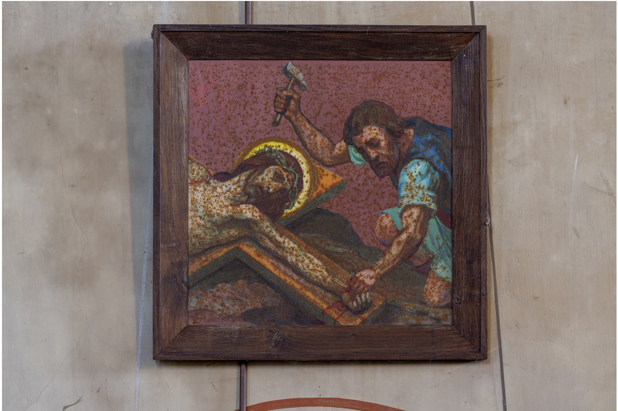
Station du Chemin de Croix.