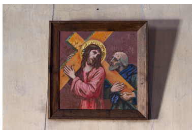
Station du Chemin de Croix. IVR32_20250200297NUCA