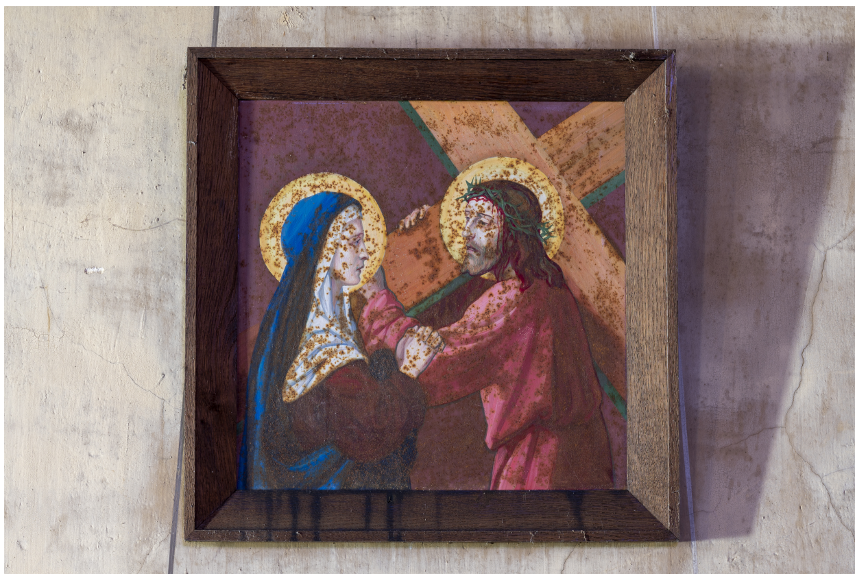
Station du Chemin de croix.