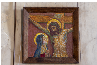
Station du Chemin de Croix.