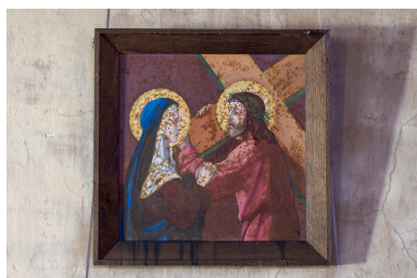
Station du Chemin de croix. IVR32_20250200298NUCA