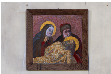
Station du Chemin de Croix. IVR32_20250200288NUCA