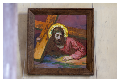
Station du Chemin de Croix. IVR32_20250200293NUCA