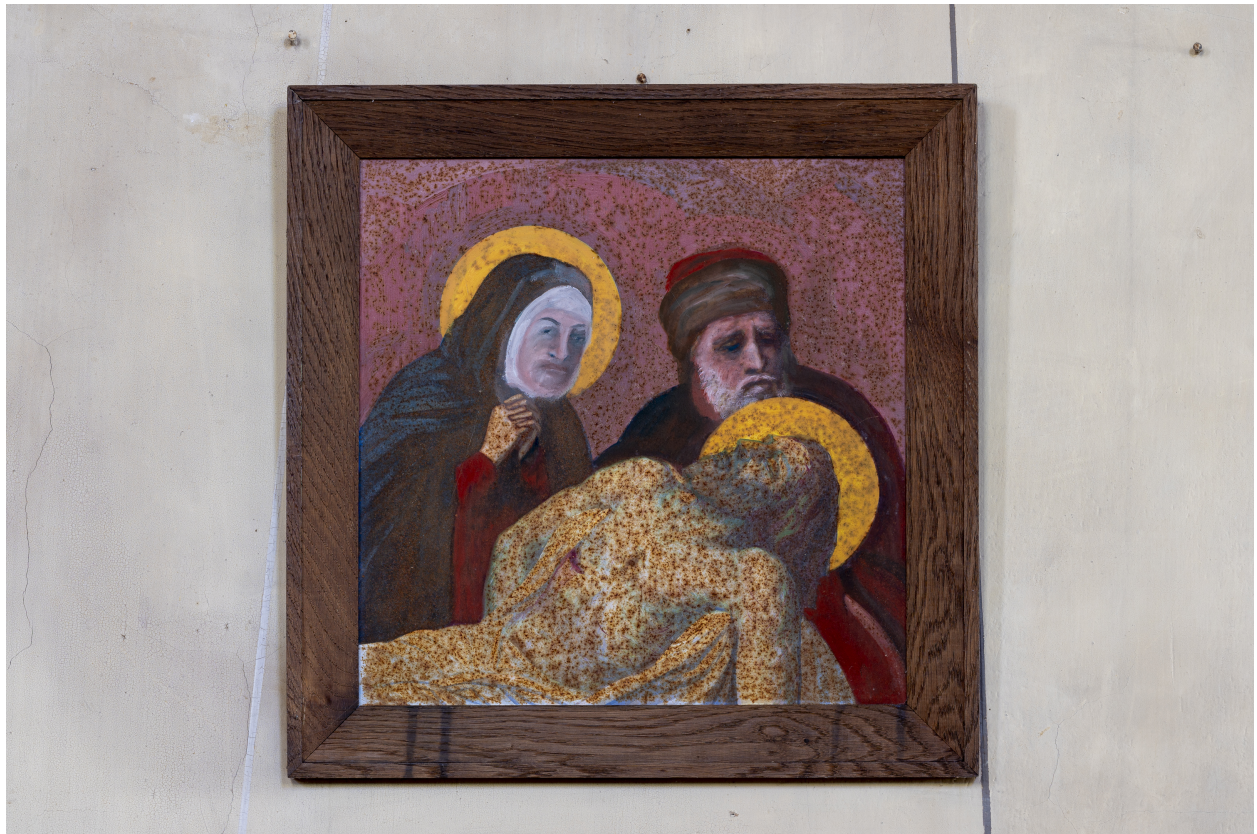
Station du Chemin de Croix.