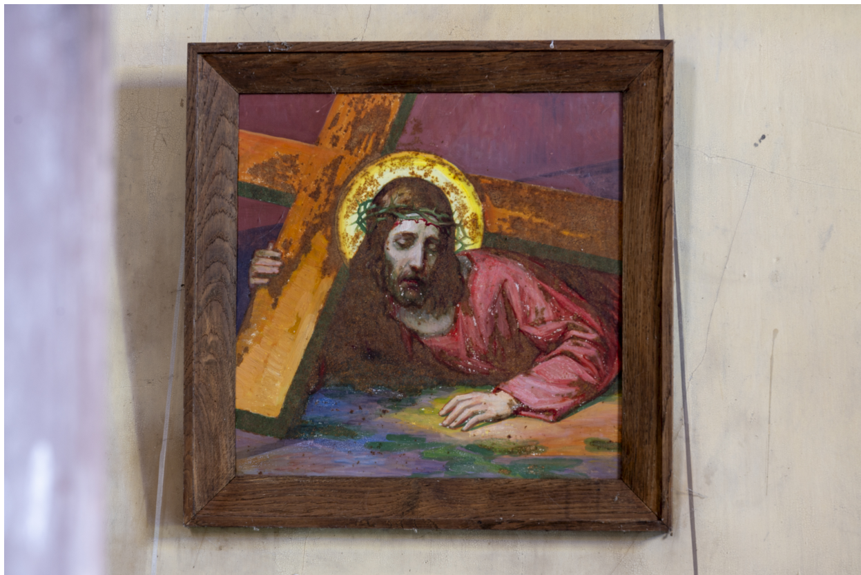
Station du Chemin de Croix.