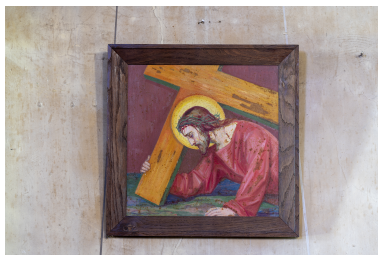
Station du Chemin de Croix. IVR32_20250200285NUCA