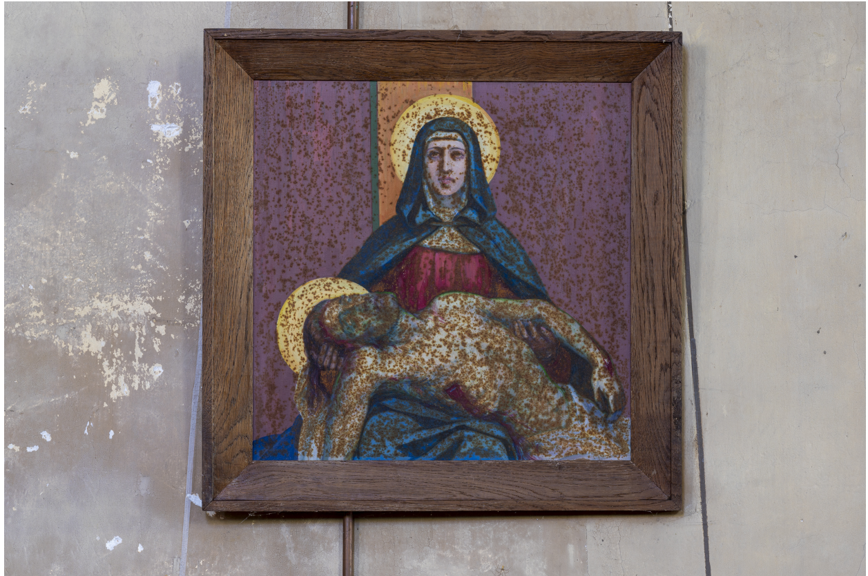
Station du Chemin de Croix.