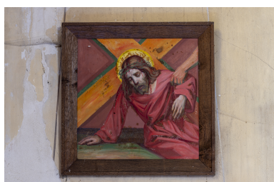
Station du Chemin de Croix. IVR32_20250200295NUCA