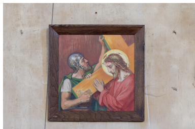
Station du Chemin de Croix.