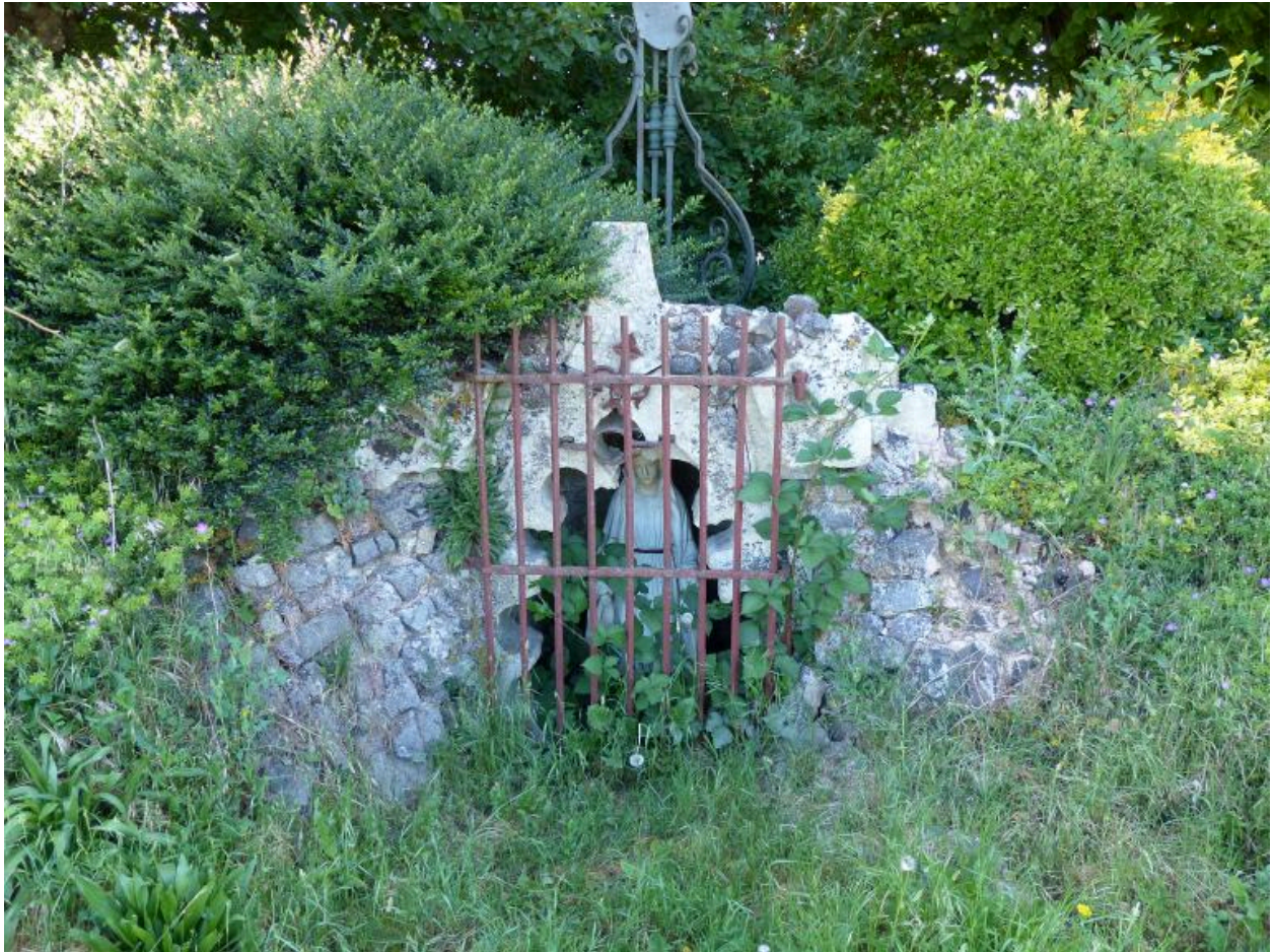
La grotte de Lourdes.