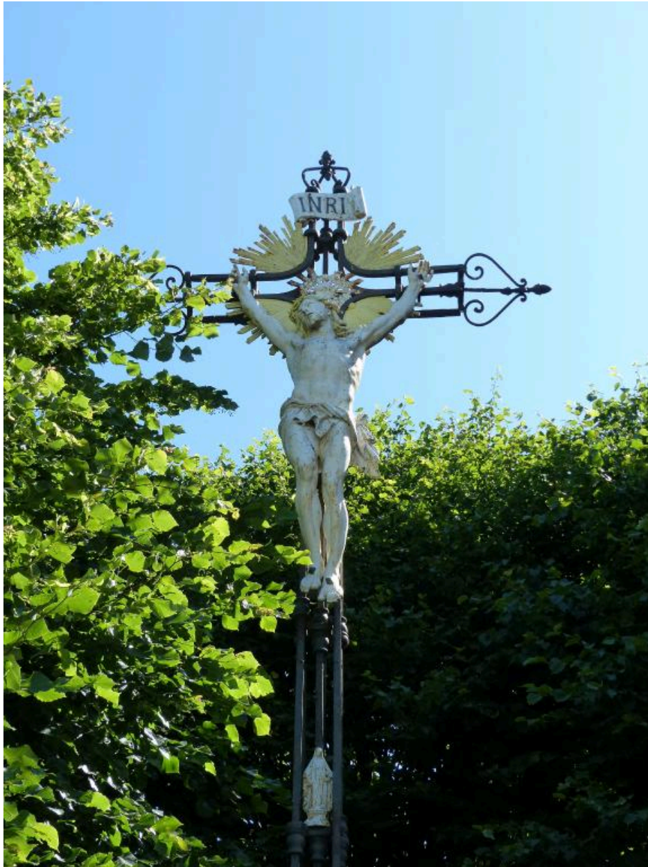
Partie supérieure de la croix.