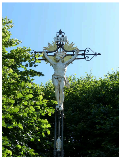
Partie supérieure de la croix. IVR32_20208005150NUCA