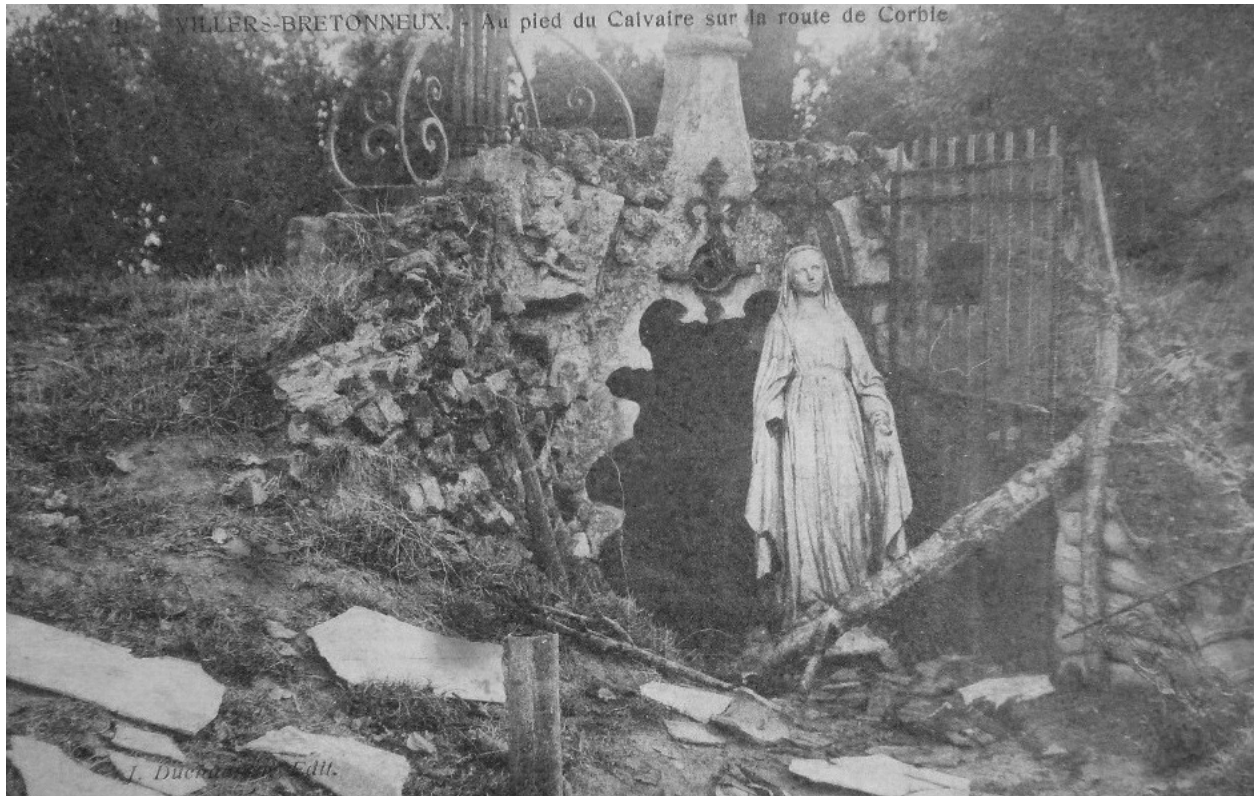
Villers-Bretonneux. Le calvaire. Carte postale, 1er quart 20e siècle (coll. part.).