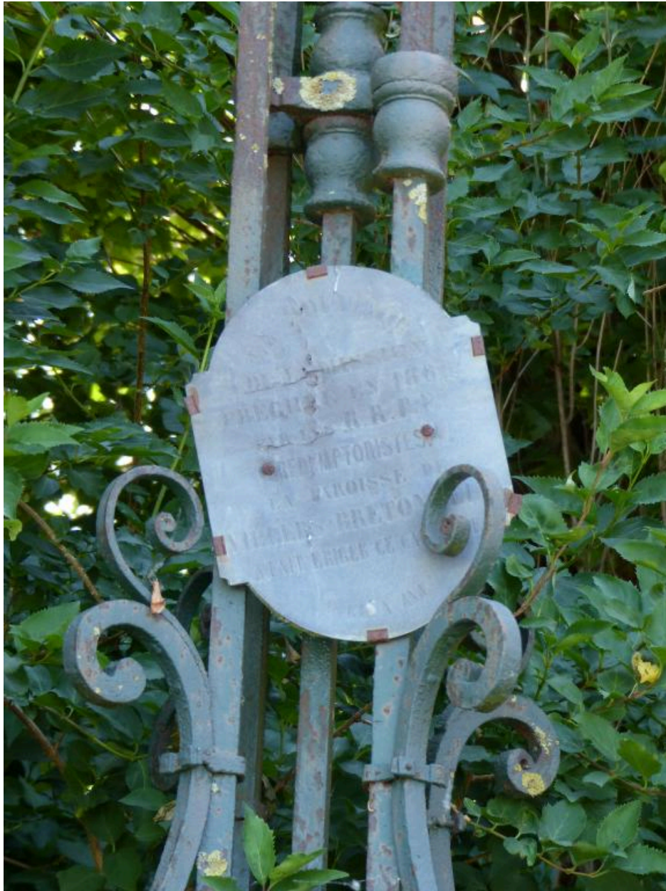
Vue de la plaque en zinc portant les inscriptions.