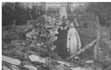
Villers-Bretonneux. Le calvaire. Carte postale, 1er quart 20e siècle (coll. part.). IVR32_20208005152NUCA