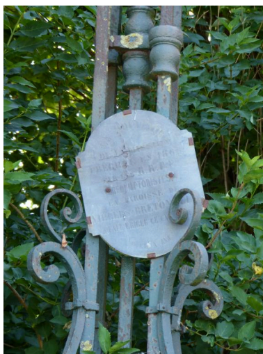
Vue de la plaque en zinc portant les inscriptions.