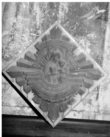
Vue générale d'un élément. IVR31_19876201941X