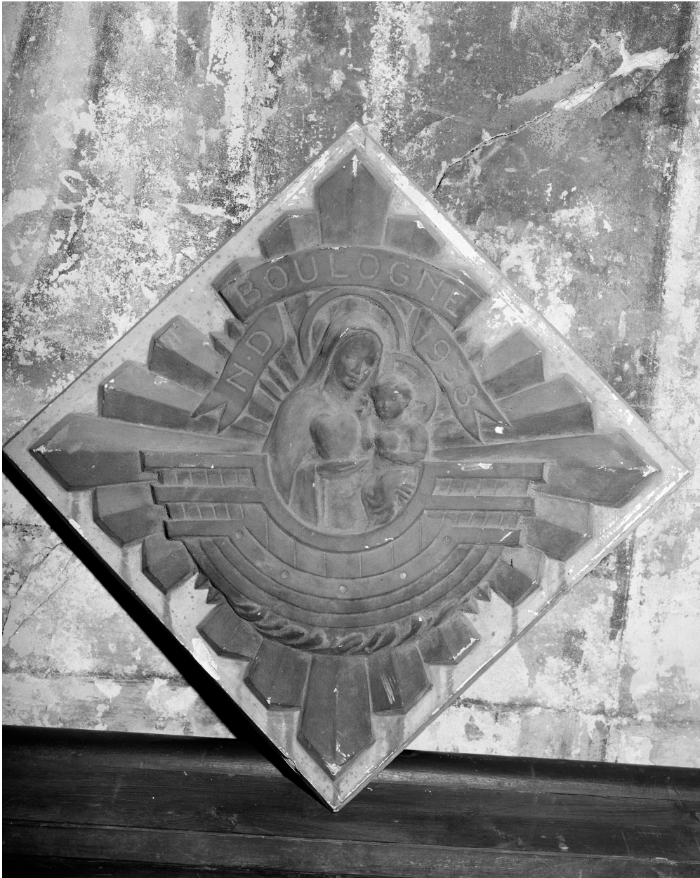
Vue générale d'un élément.