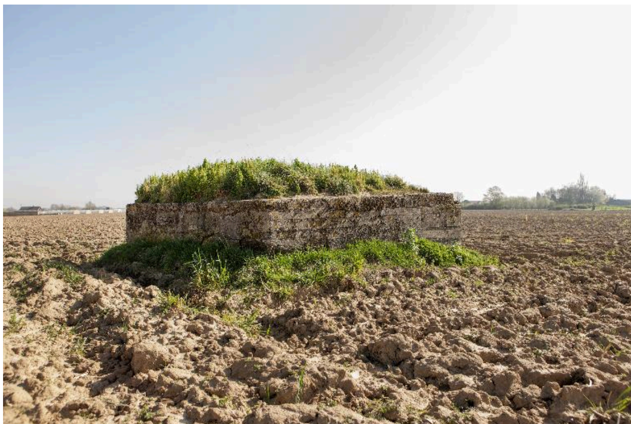
Vue de trois-quarts arrière; vers l'est