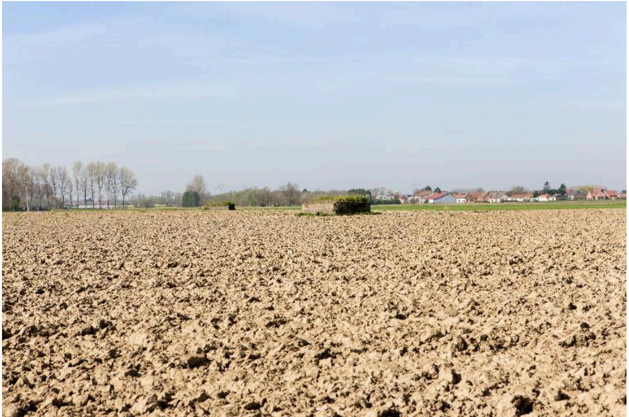
Vue générale vers l'ouest. En arrière plan une casemate à personnel (IA59004902)