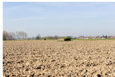
Vue générale vers l'ouest. En arrière plan une casemate à personnel (IA59004902) IVR31_20145905020NUCA