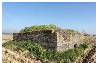
Vue de trois-quarts vers le nord IVR31_20145905022NUCA