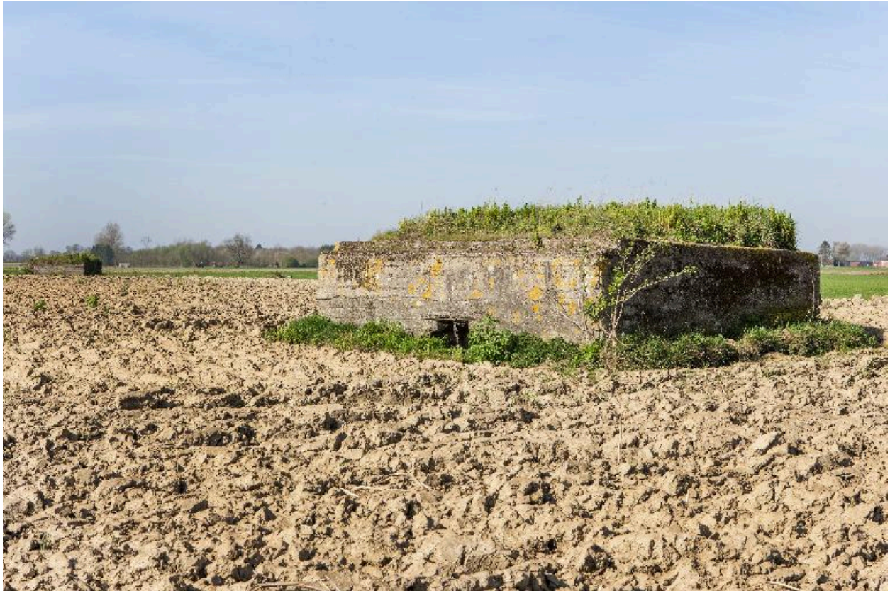
Vue générale vers l'ouest. On aperçoit l'entrée à demi enterrée. A l'arrière plan une casemate à personnel (IA59004902)