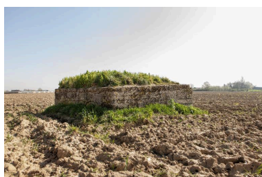
Vue de trois-quarts arrière; vers l'est IVR31_20145905024NUCA