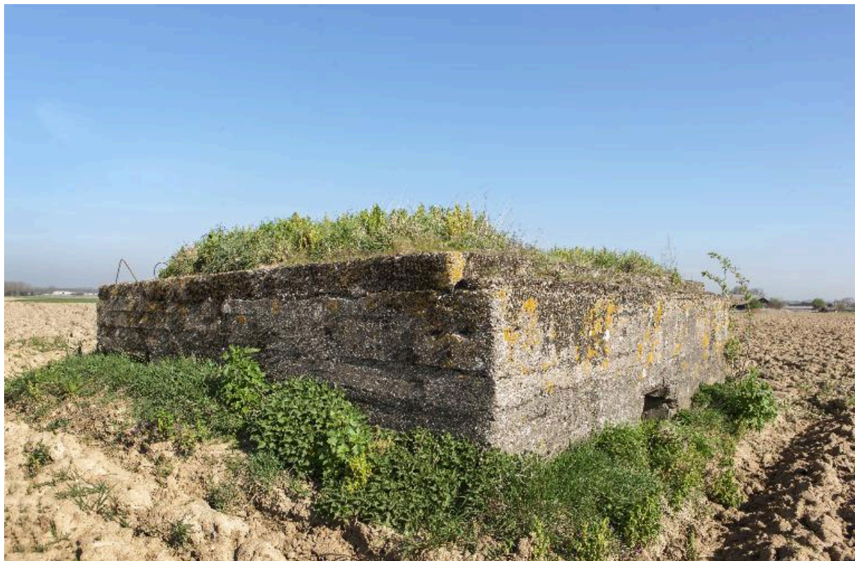
Vue de trois-quarts vers le nord