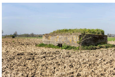
Vue générale vers l'ouest. On aperçoit l'entrée à demi enterrée. A l'arrière plan une casemate à personnel (IA59004902) IVR31_20145905021NUCA