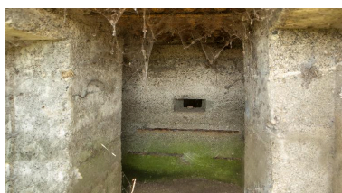
Depuis l'embrasure de l'entrée, le couloir de distribution et, en face, un créneau de fusillade