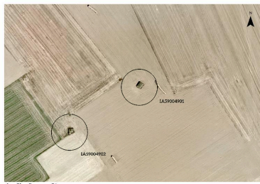
Position de l'édifice (cercle de droite) sur une photographie aérienne de 2009 IVR32_20175900728NUCA