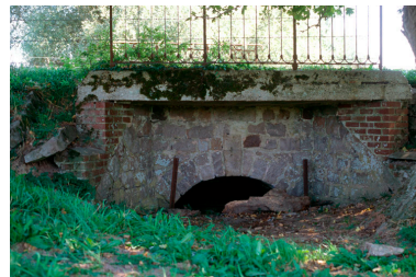
Petit pont de grès au sud du village, 1786.