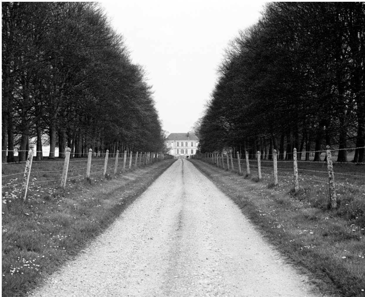
Allée menant au château.