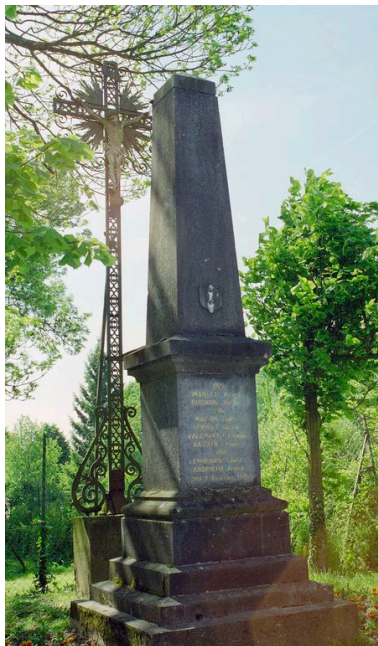
Monument aux morts et calvaire.