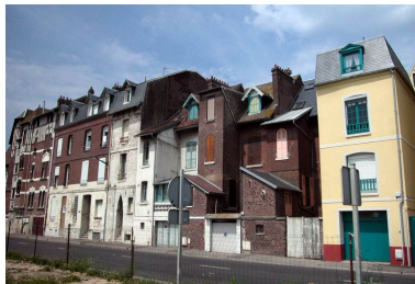
Vue d'ensemble depuis l'avenue du Maréchal-Foch, façades postérieures des maisons en front de mer. IVR22_20038005333NUCA