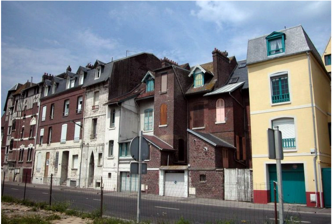
Vue d'ensemble depuis l'avenue du Maréchal-Foch, façades postérieures des maisons en front de mer.