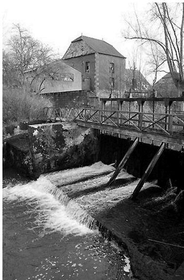
Vue des bâtiments du moulin et du barrage. IVR22_19910202291Z