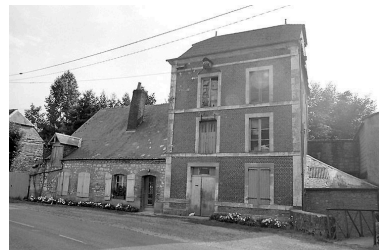
Vue générale depuis le nord-est.