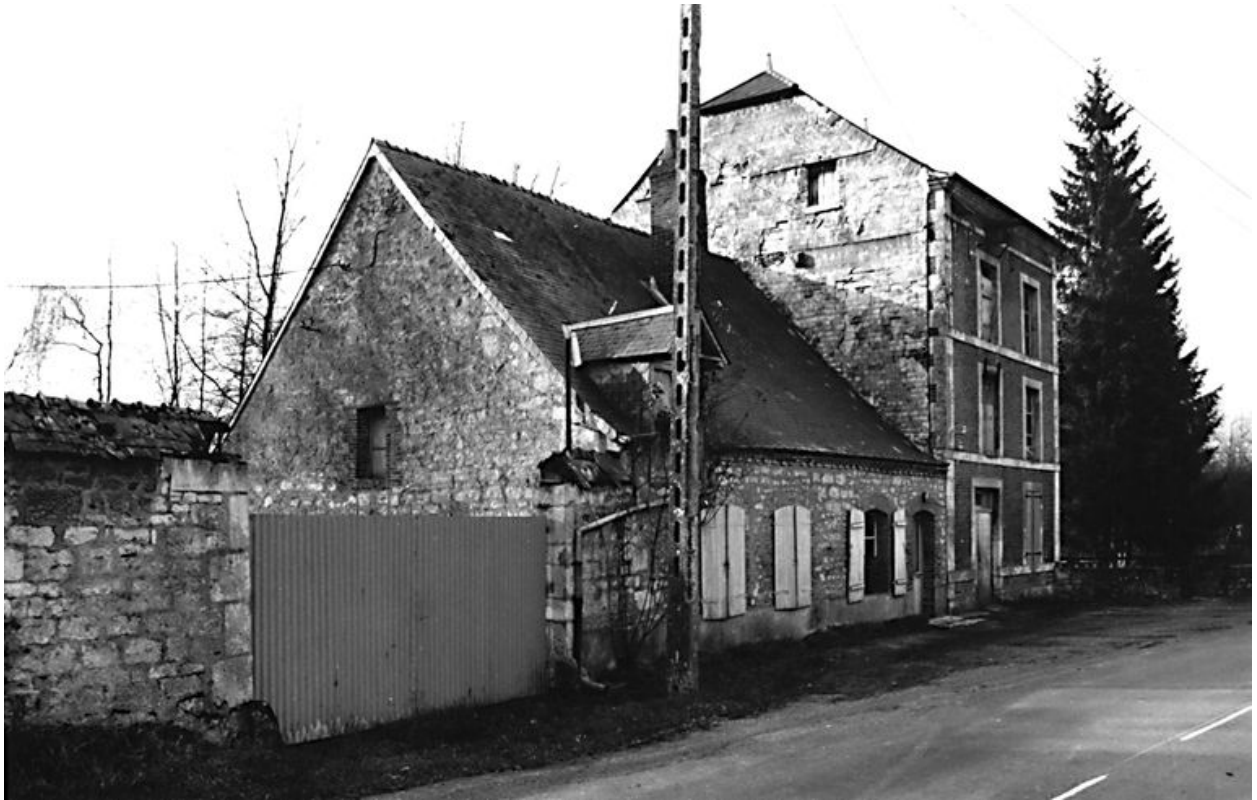
Vue du logis et du moulin.