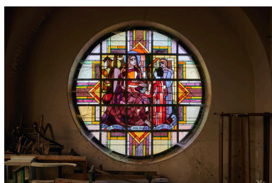
Verrière en rosace de sainte Cécile IVR32_20226200196NUCA