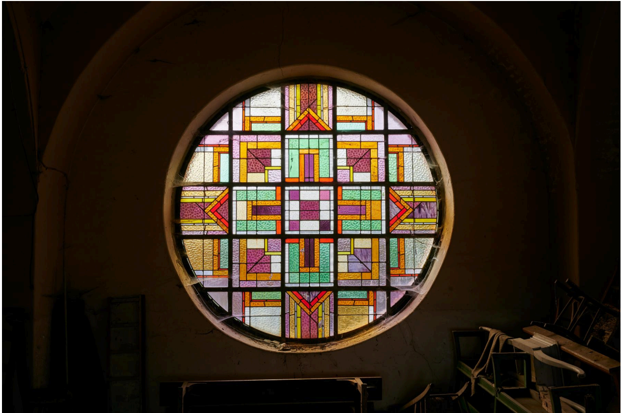
Verrière de la tribune d'orgues : verrière décorative.