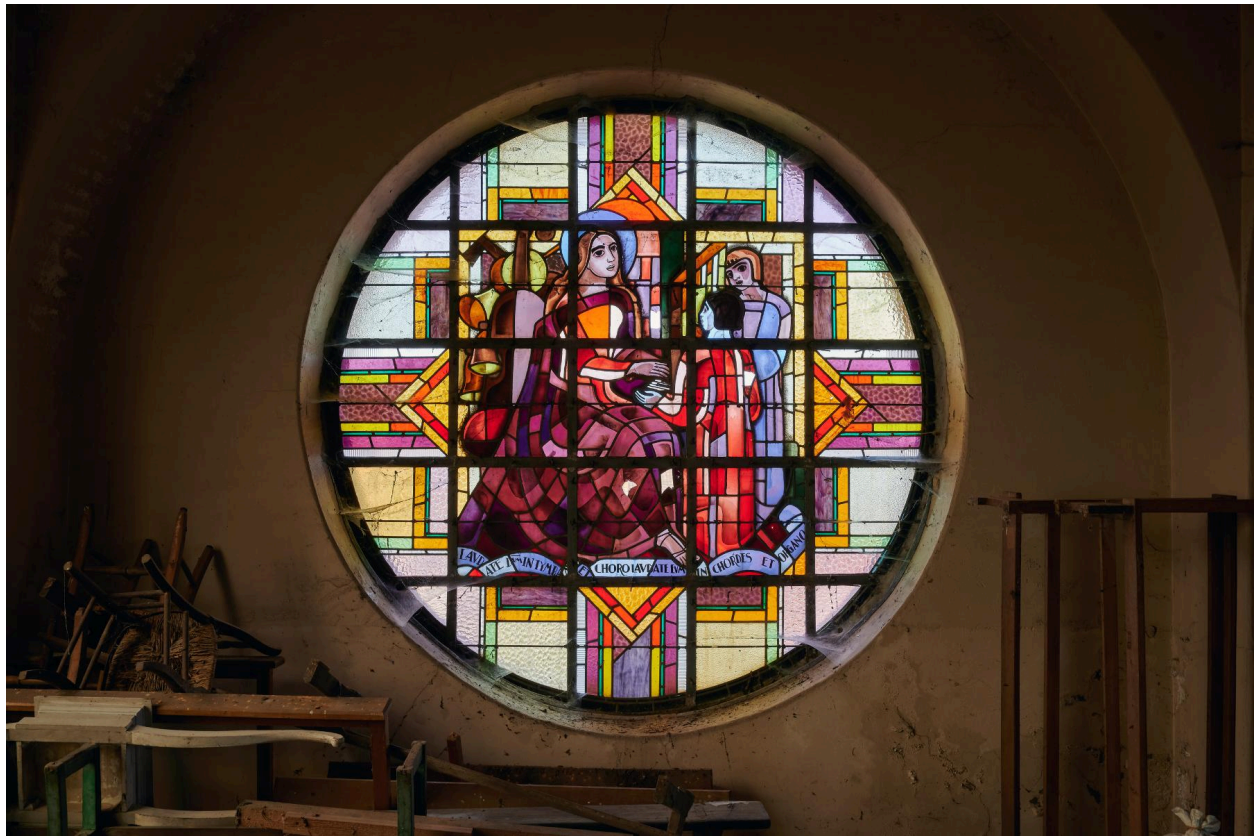
Verrière en rosace de sainte Cécile