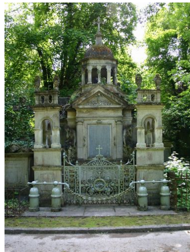
Vue générale de face du tombeau- monument en forme de mausolée. IVR22_20098001303NUCA