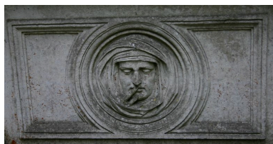
Bas-relief représentant l'allégorie du Silence, d'après Préault.