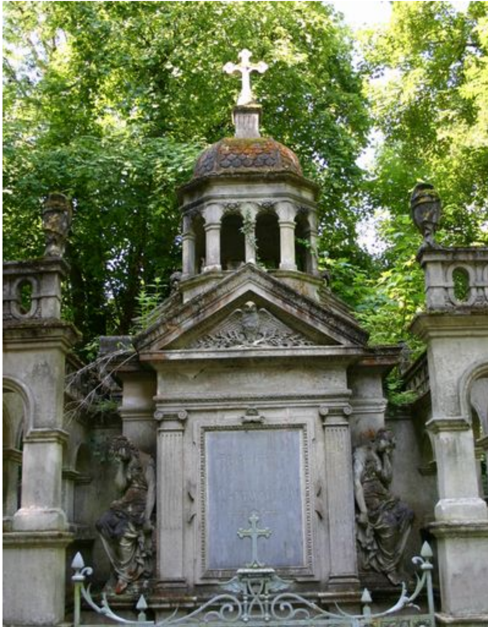
Détail de la stèle à entablement et fronton triangulaire d'applique.