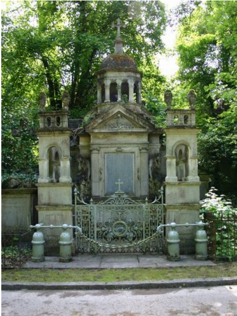
Vue générale de face du tombeau-monument en forme de mausolée.