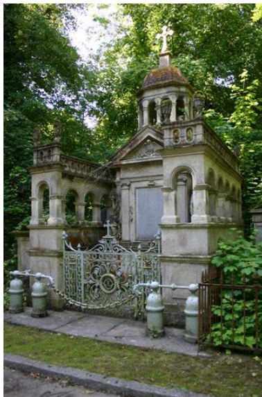
Vue générale du tombeau-monument en forme de mausolée, depuis le côté. IVR22_20098001302NUCA