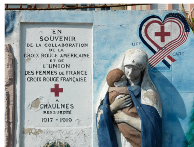
Vue de détail sur l'inscription et les personnages. IVR32_20218000273NUCA