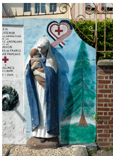
Vue de détail sur la partie droite du monument.