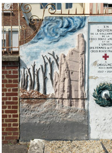
Vue de détail sur la partie gauche du monument. IVR32_20218000270NUCA