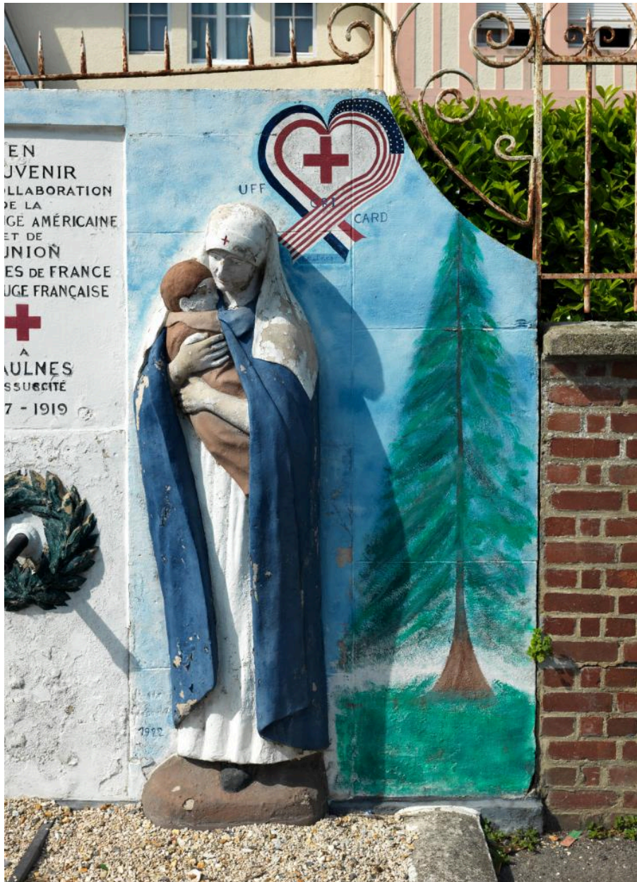
Vue de détail sur la partie droite du monument.