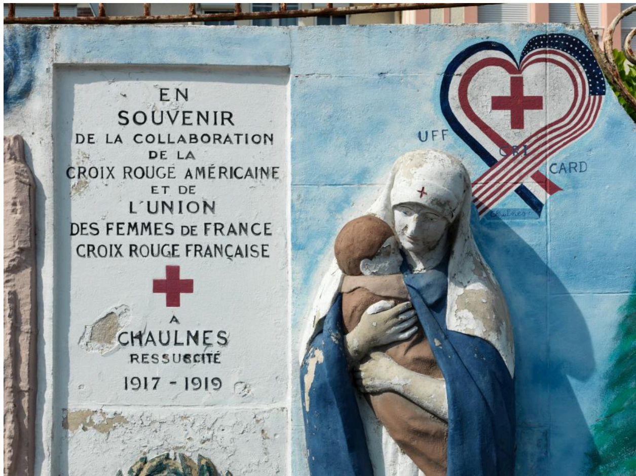
Vue de détail sur l'inscription et les personnages.