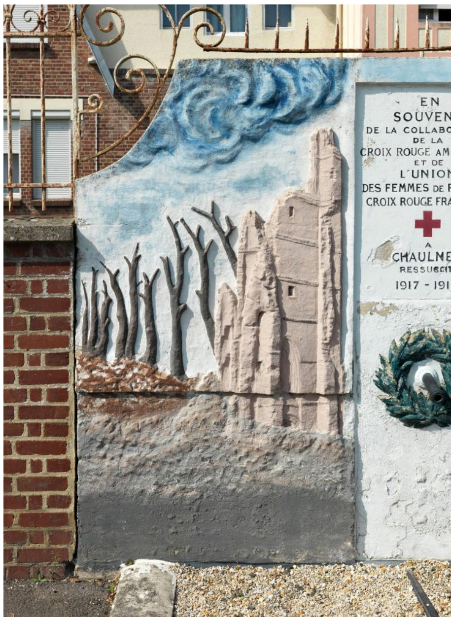
Vue de détail sur la partie gauche du monument.