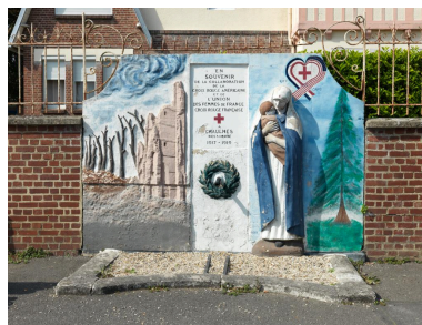
Vue générale. IVR32_20218000269NUCA