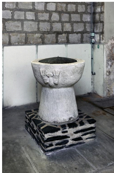
Fonts baptismaux, calcaire, 4e quart 20e siècle. IVR22_20148000027NUC2A