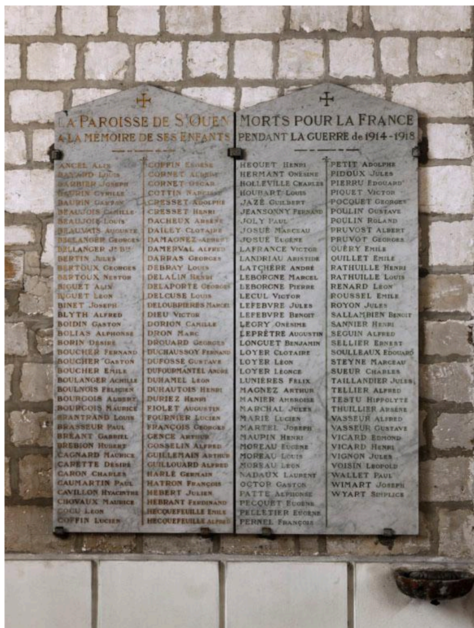
Tableau commémoratif des morts, 2e quart 20e siècle.