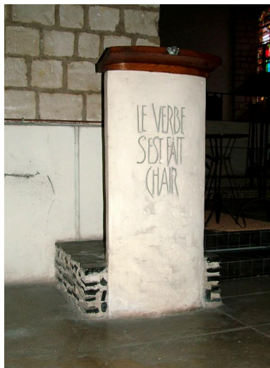
Ambon, calcaire, 4e quart 20e siècle. IVR22_20128015552NUCA