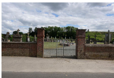
Entrée du cimetière, vue depuis le nord.