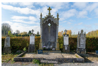
Enclos funéraire de la famille Dannelle-Carliet-Legendre avec stèles et tombeau en forme de niche, 2e moitié du 19e siècle.

IVR32_20216001364NUCA