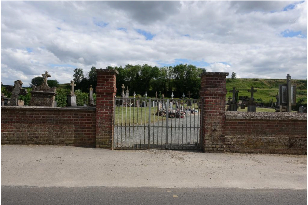
Entrée du cimetière, vue depuis le nord.