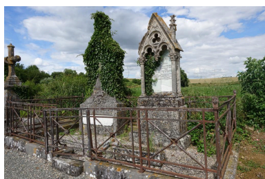
Enclos funéraire de la famille Payen, vers 1860.