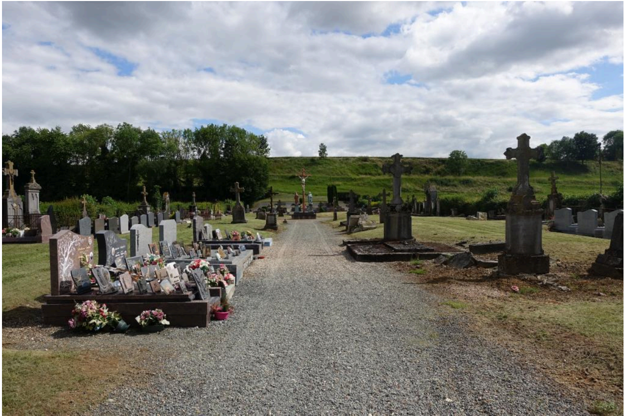
Vue générale du cimetière depuis l'entrée.