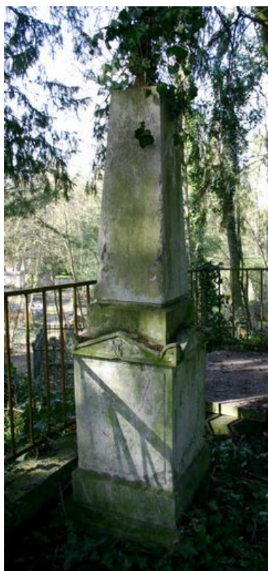
Pilier en forme d'obélisque, vers 1842.