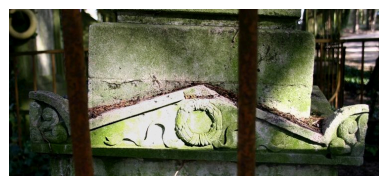
Détail du décor sculpté sur le petit fronton triangulaire ornant la face gauche de la base du pilier en forme d'obélisque : couronne de laurier entrelacée de rubans.