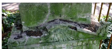
Détail du décor sculpté sur le petit fronton triangulaire ornant la face postérieure de la base du pilier en forme d'obélisque : vase funéraire drapé. IVR22_20098000857NUCA