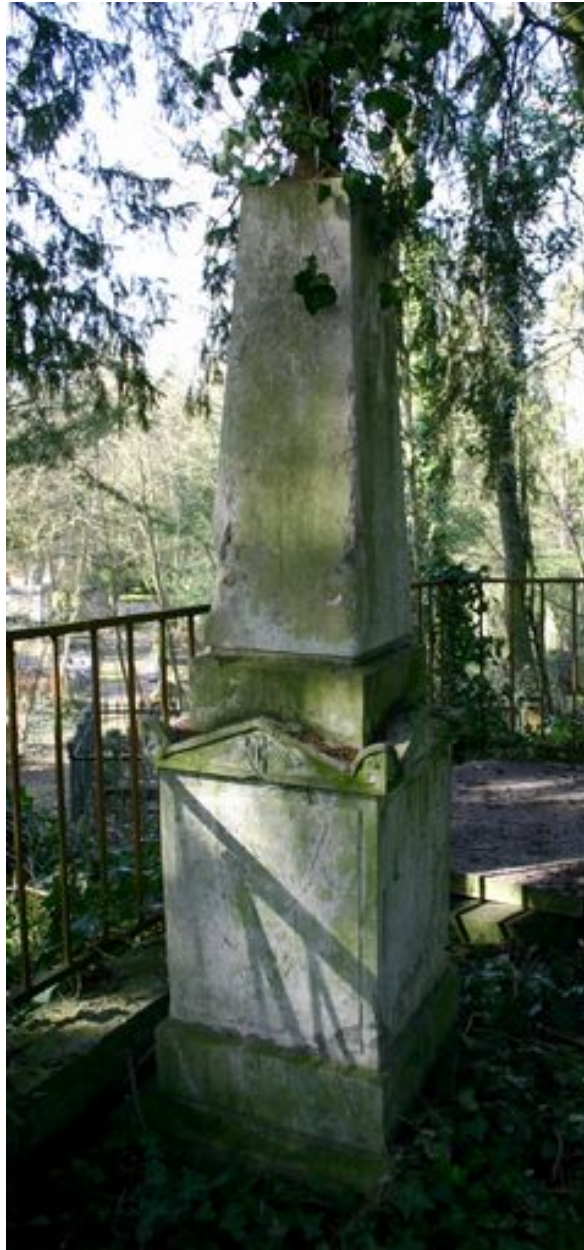
Pilier en forme d'obélisque, vers 1842.