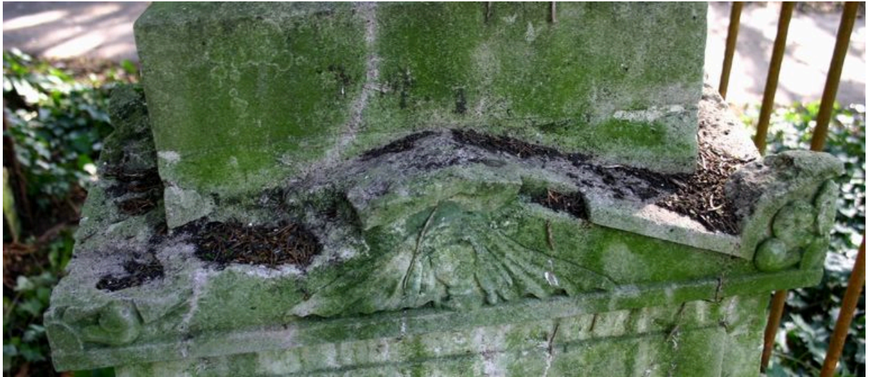
Détail du décor sculpté sur le petit fronton triangulaire ornant la face postérieure de la base du pilier en forme d'obélisque : vase funéraire drapé.