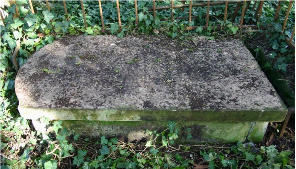
Dalle funéraire antérieure en forme de chapeau-de-gendarme.