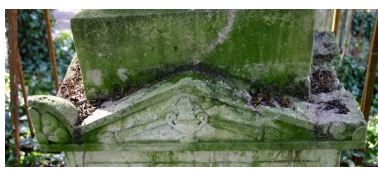
Détail du décor sculpté sur le petit fronton triangulaire ornant la face droite de la base du pilier en forme d'obélisque : pot-à-feu et flambeaux renversés entrecroisés. IVR22_20098000858NUCA