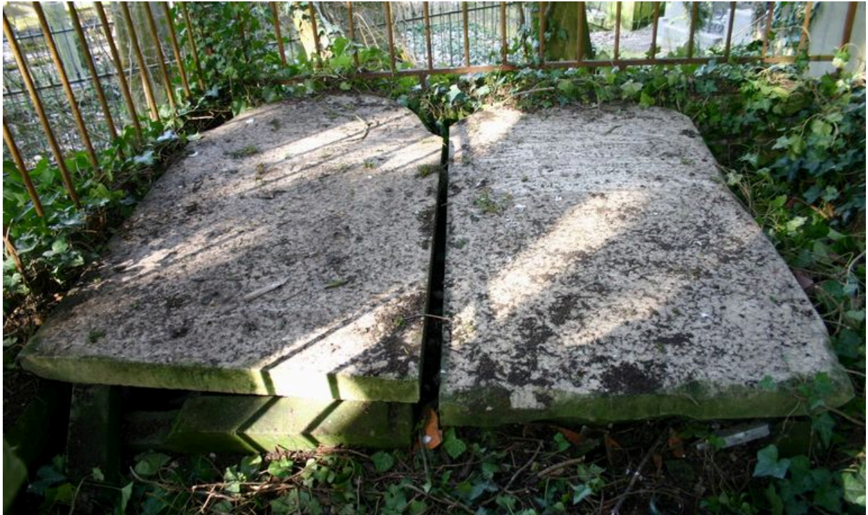
Dalles funéraires postérieures en forme de chapeau-de-gendarme.