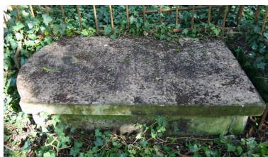
Dalle funéraire antérieure en forme de chapeau-de-gendarme.