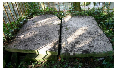
Dalles funéraires postérieures en forme de chapeau-de-gendarme. IVR22_20098000853NUCA