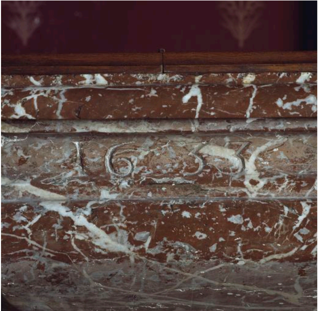
Détail de la cuve : date gravée de 1633.