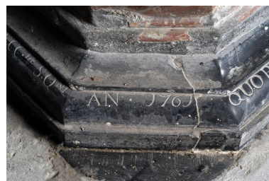
Détail du pied : date gravée de 1761.