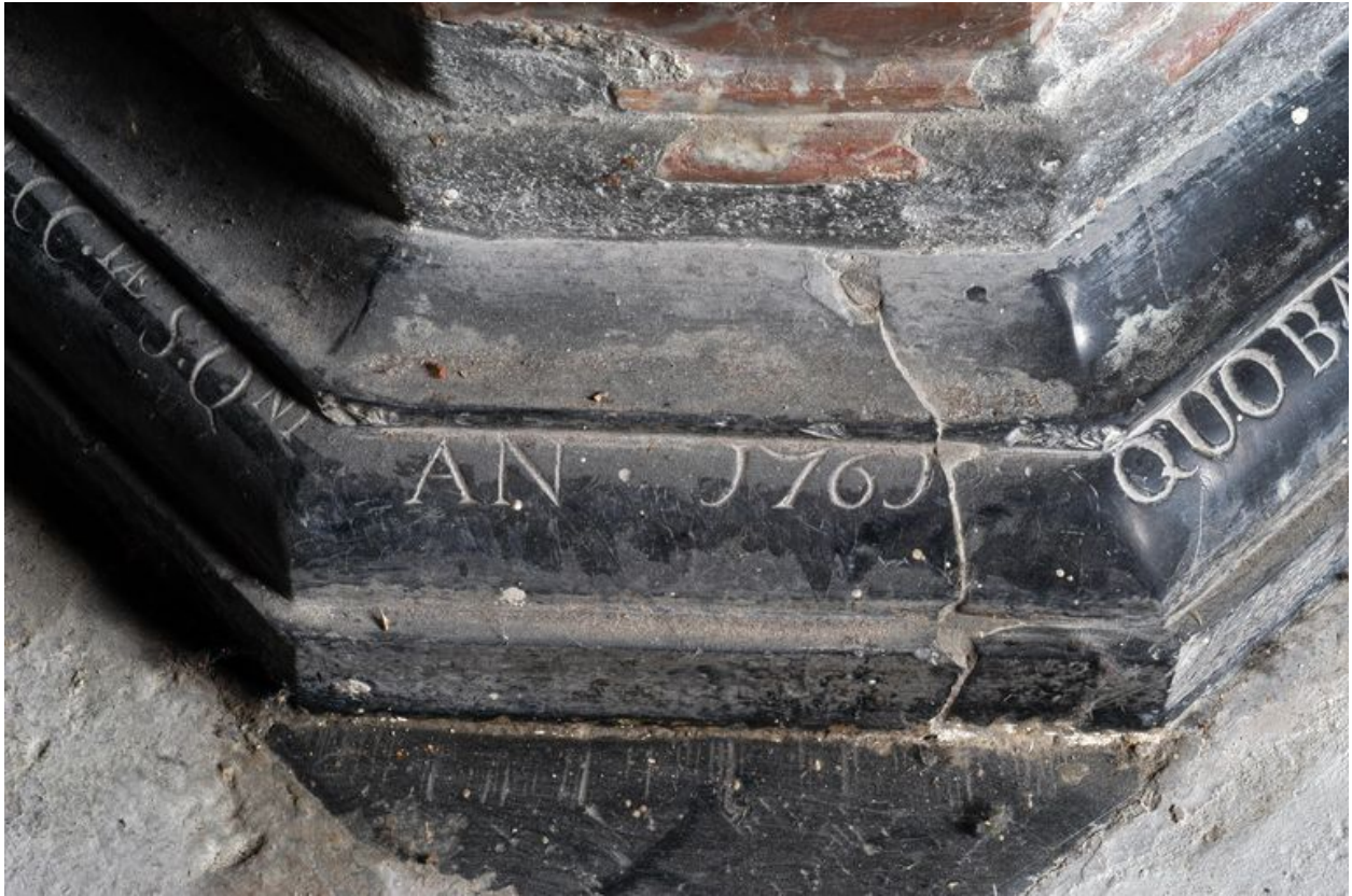
Détail du pied : date gravée de 1761.