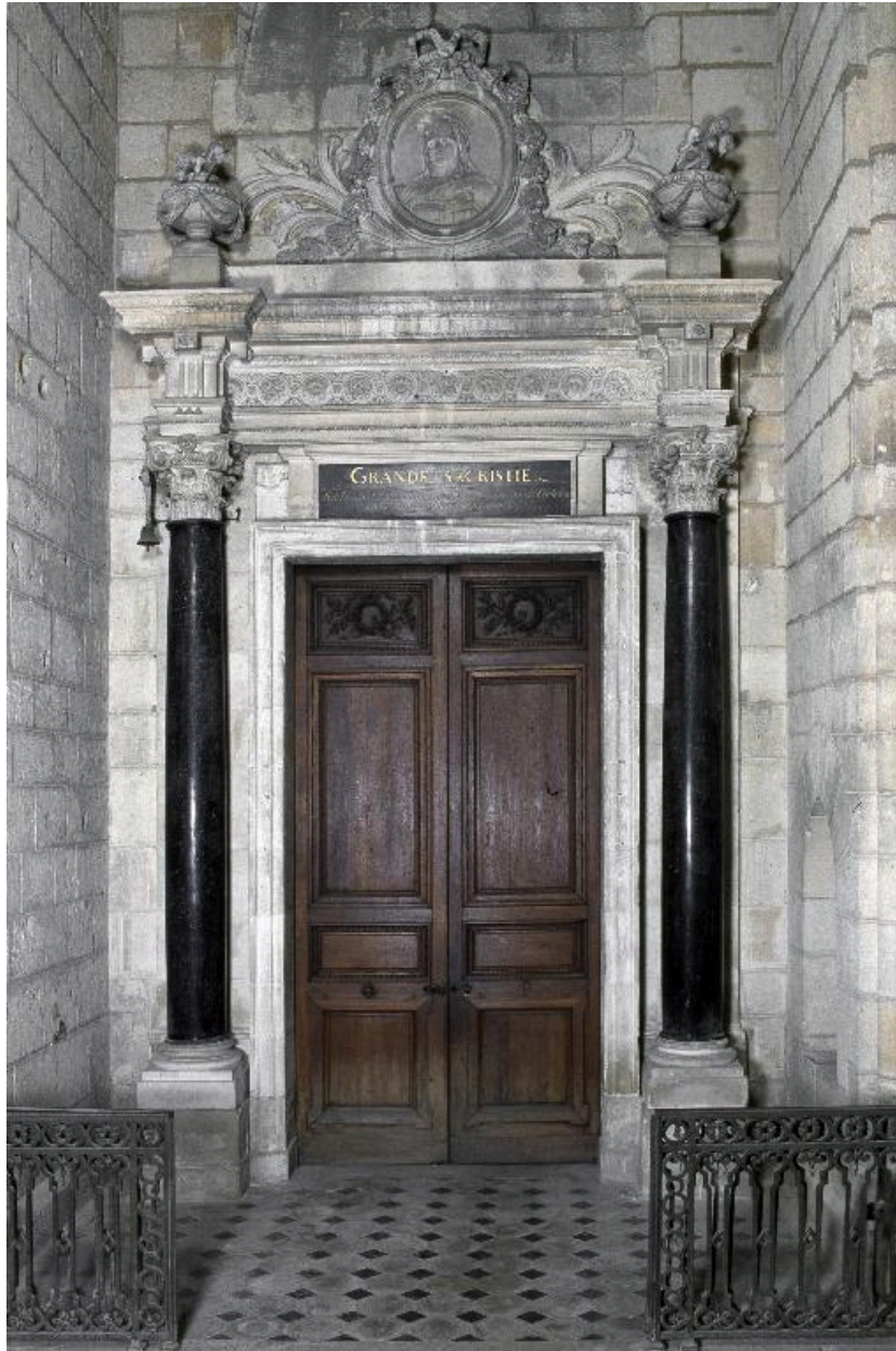
Vue générale de la porte.