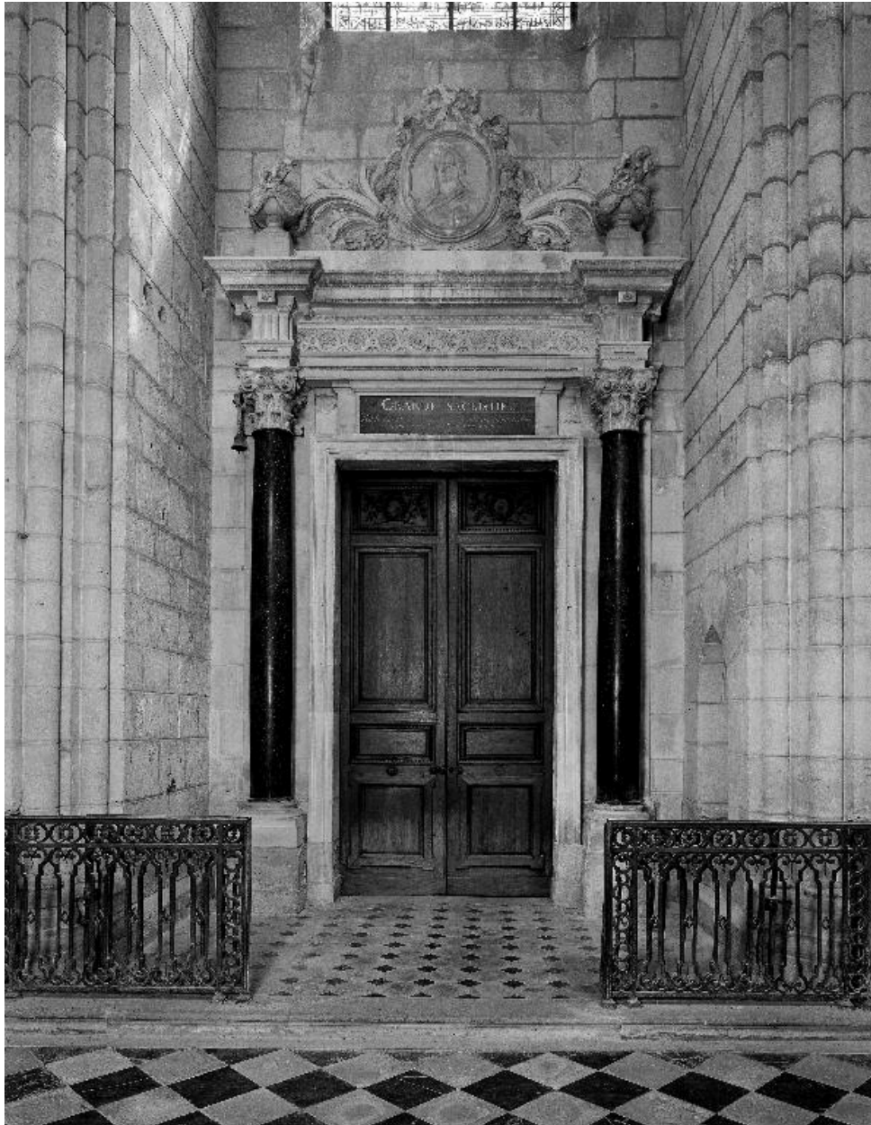
Vue générale de la porte.