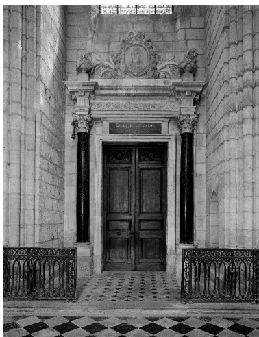
Vue générale de la porte. IVR22_19970200105V