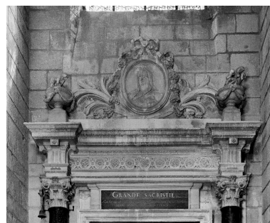
Vue de l'entablement et de l'amortissement.