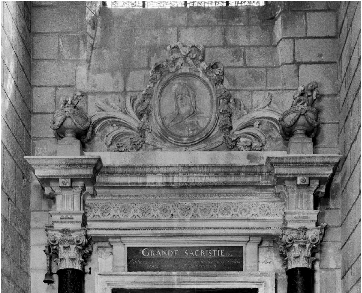
Vue de l'entablement et de l'amortissement.