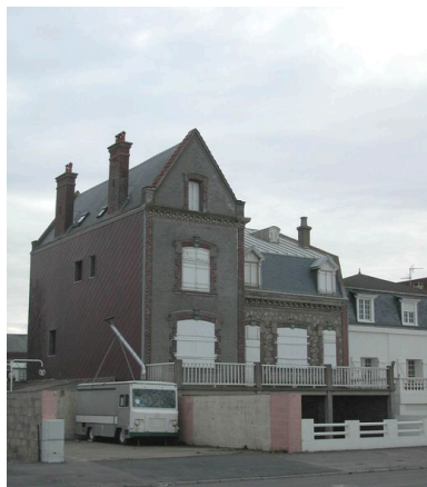
Vue de trois-quarts depuis le boulevard du Général-Sizaire.

Phot. Elisabeth Justome IVR22_20058002618NUCA