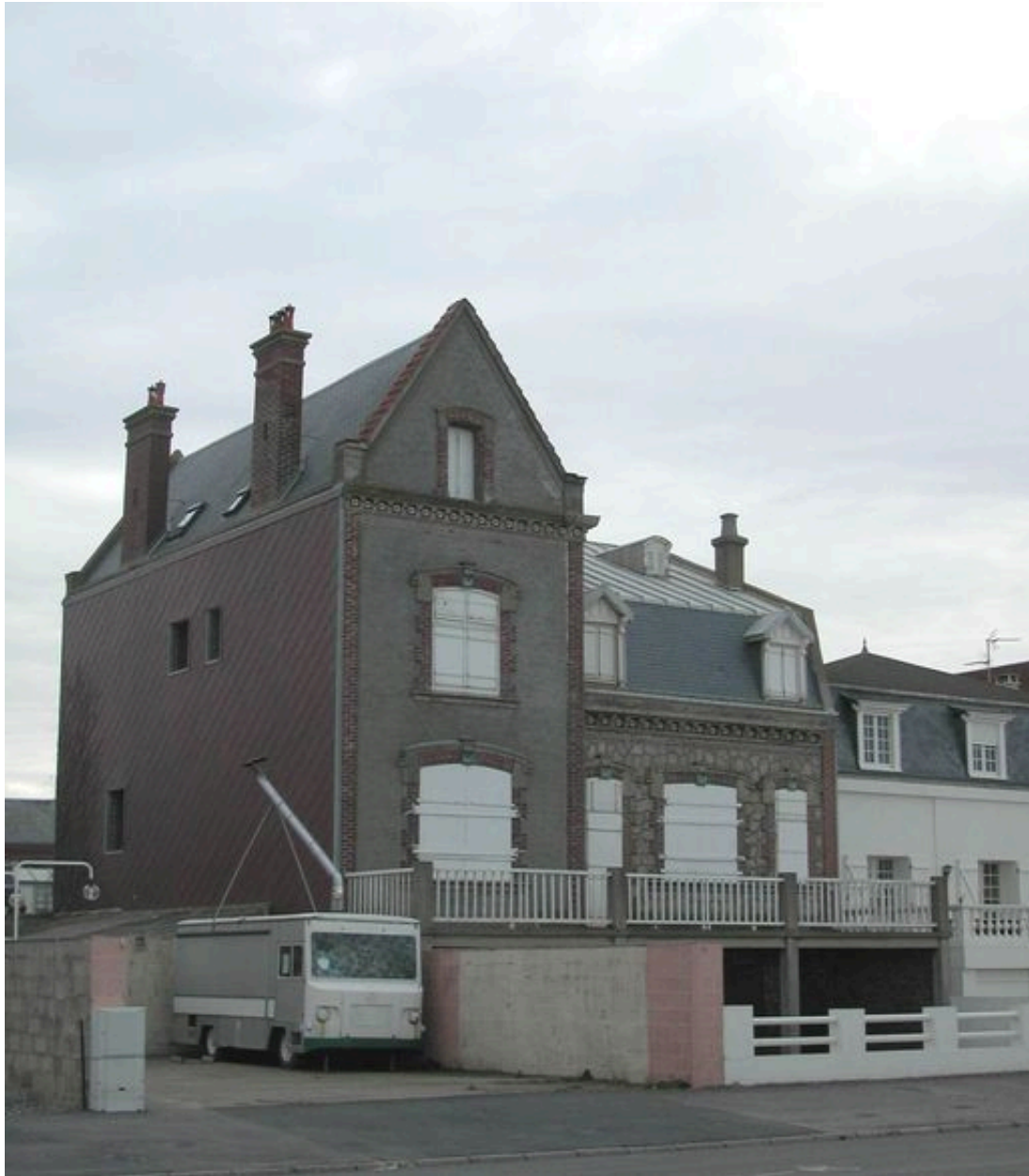
Vue de trois-quarts depuis le boulevard du Général-Sizaire.