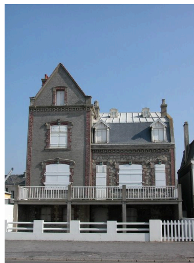
Vue d'ensemble, élévation côté mer. IVR22_20058002615NUCA