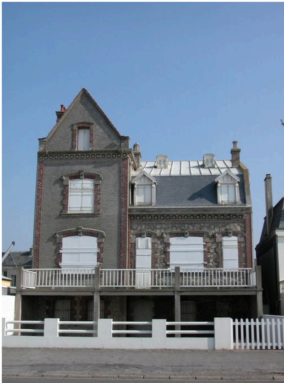
Vue d'ensemble, élévation côté mer.