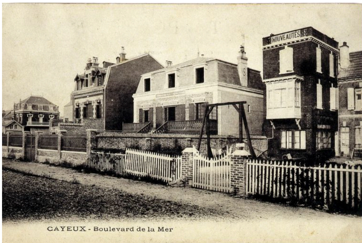
Maison dite Les Cigales avant extension, à gauche, carte postale, 1er quart 20e siècle (coll. part.).