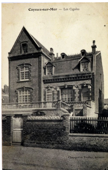
Carte postale, 1er quart 20e siècle (coll. part.).