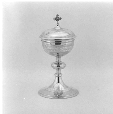
Vue générale. IVR31_19916200517X