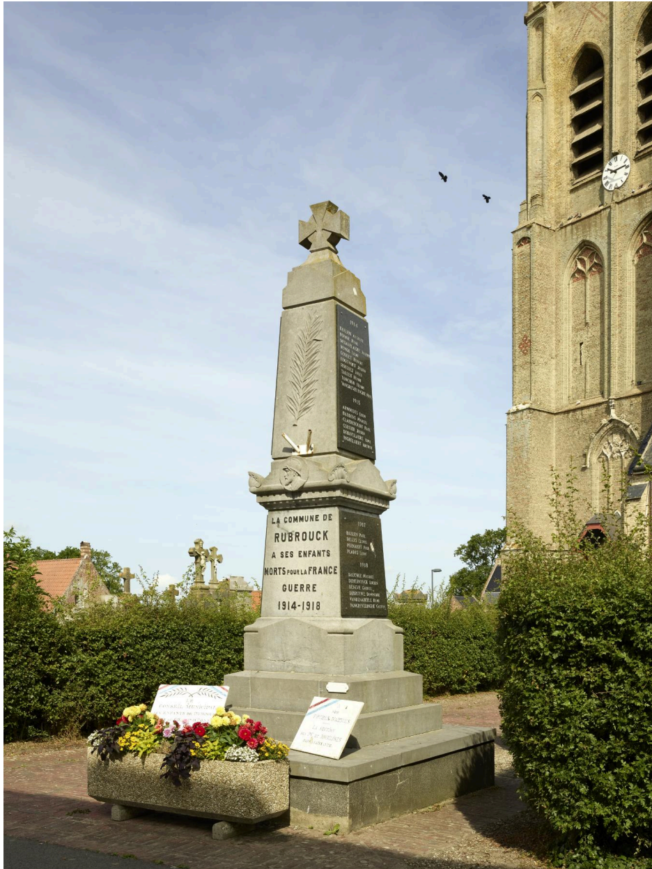
Face et côté droit du monument.