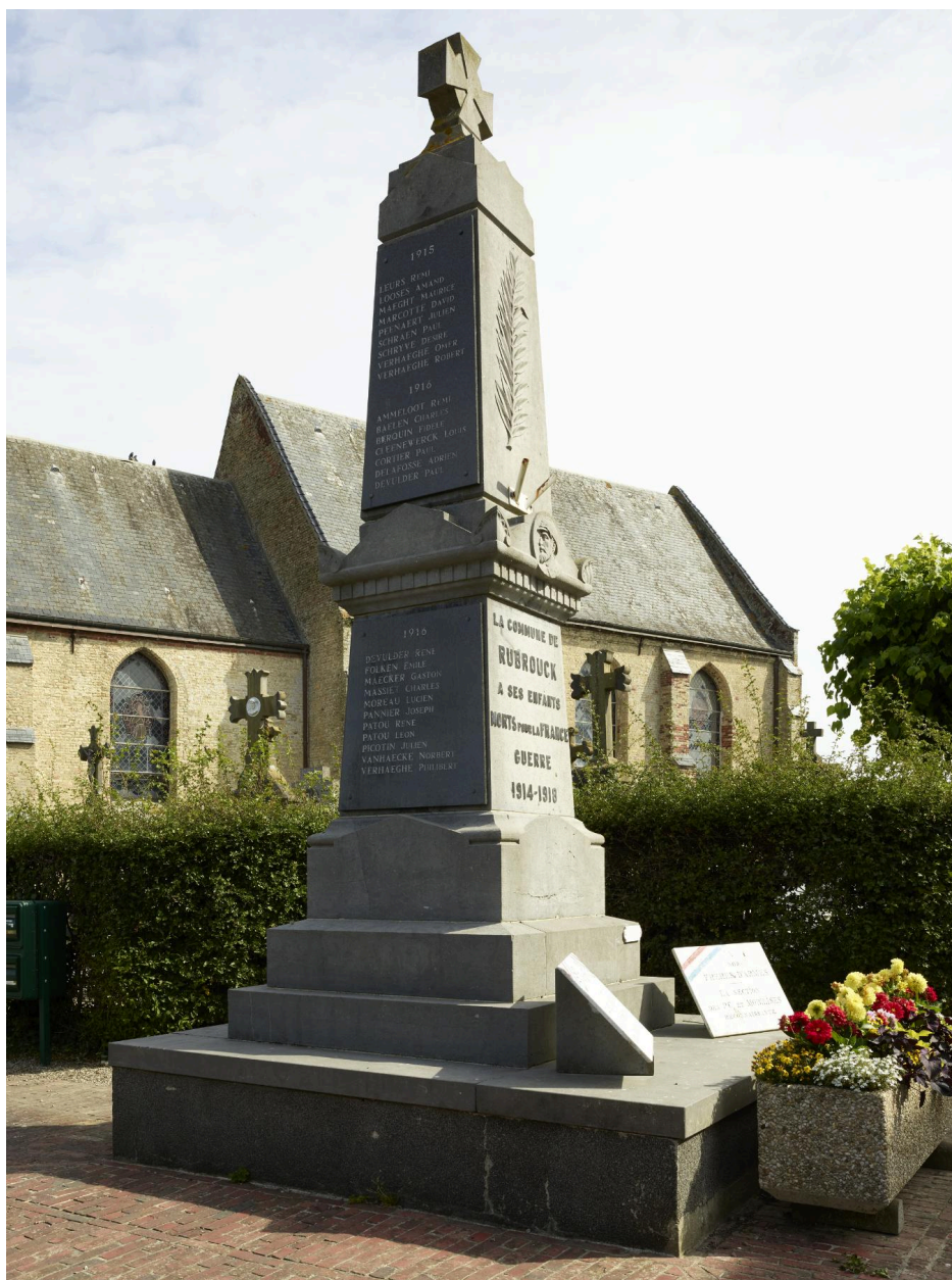
Face et côté gauche du monument.