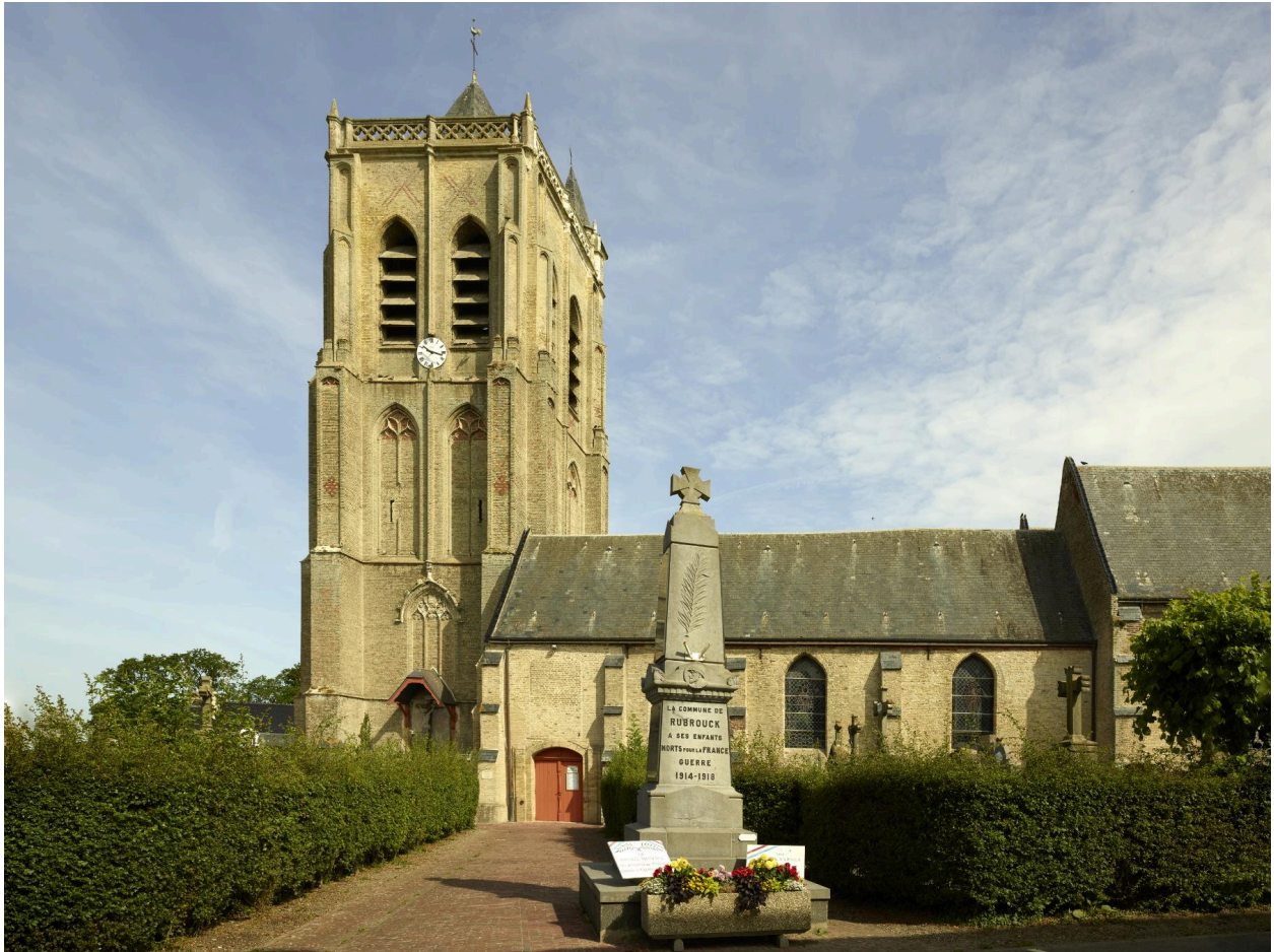
Monument dans son environnement direct.