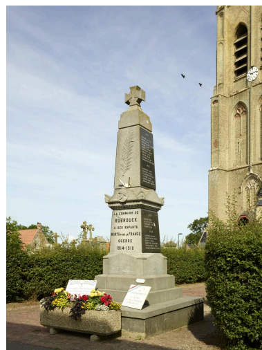
Face et côté droit du monument. IVR32_20235900817NUCA