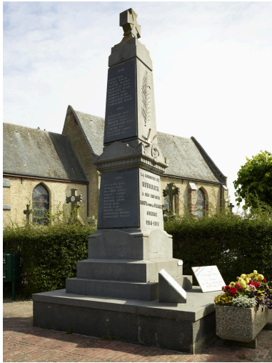
Face et côté gauche du monument.