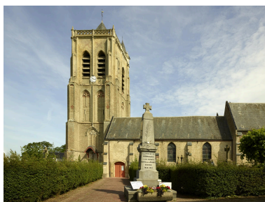
Monument dans son environnement direct. IVR32_20235900819NUCA