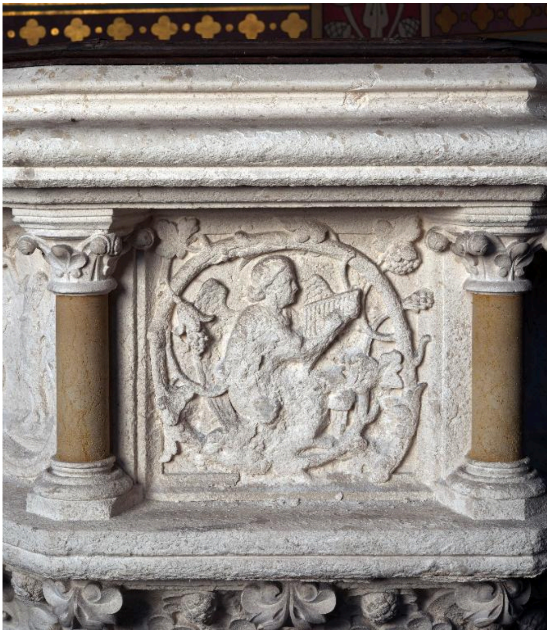
Détail d'un panneau de la cuve : ange jouant de la harpe dans un rinceau végétal.