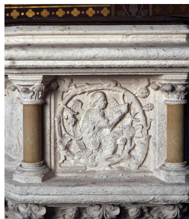
Détail d'un panneau de la cuve : ange jouant de la harpe dans un rinceau végétal.

IVR22_20138000300NUC2A