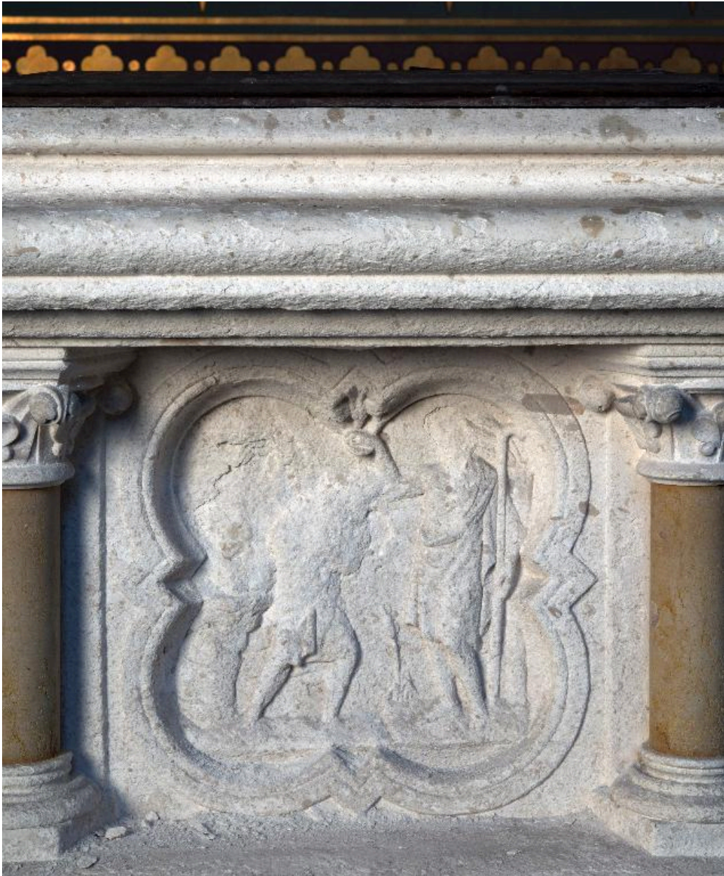
Détail d'un panneau de la cuve : Baptême du Christ.