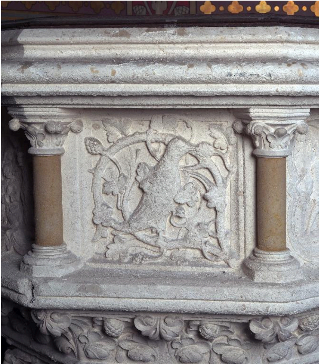
Détail d'un panneau de la cuve : oiseau picorant dans un rinceau.