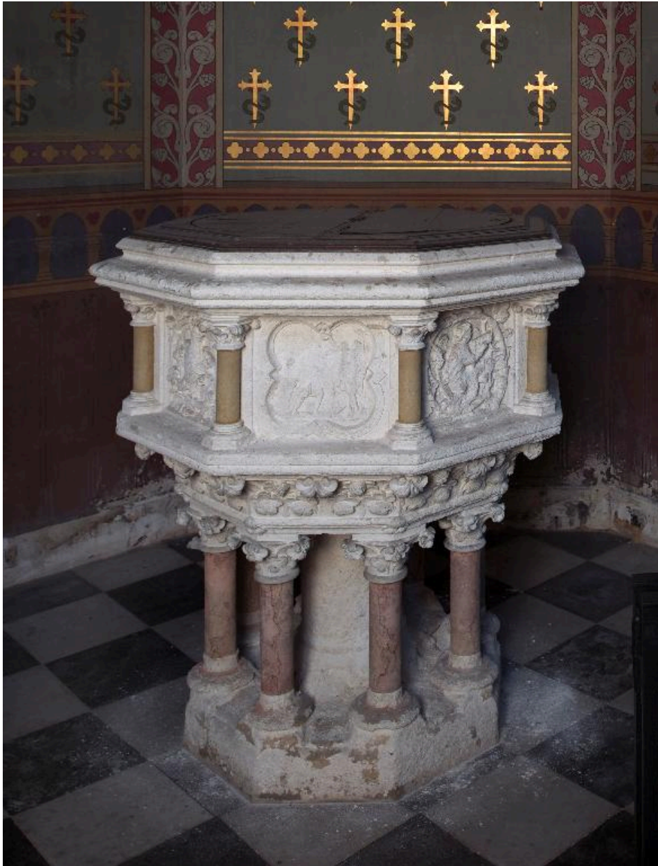
Vue générale des fonts baptismaux.