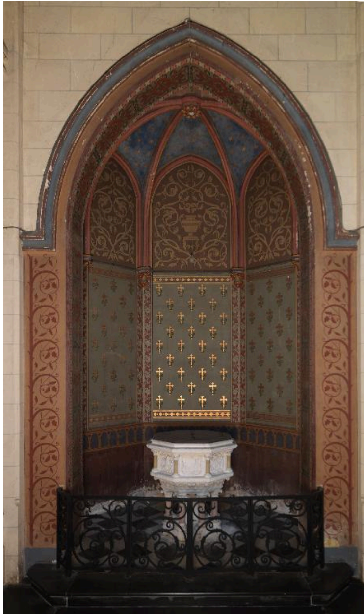
Vue générale de la chapelle des fonts baptismaux.