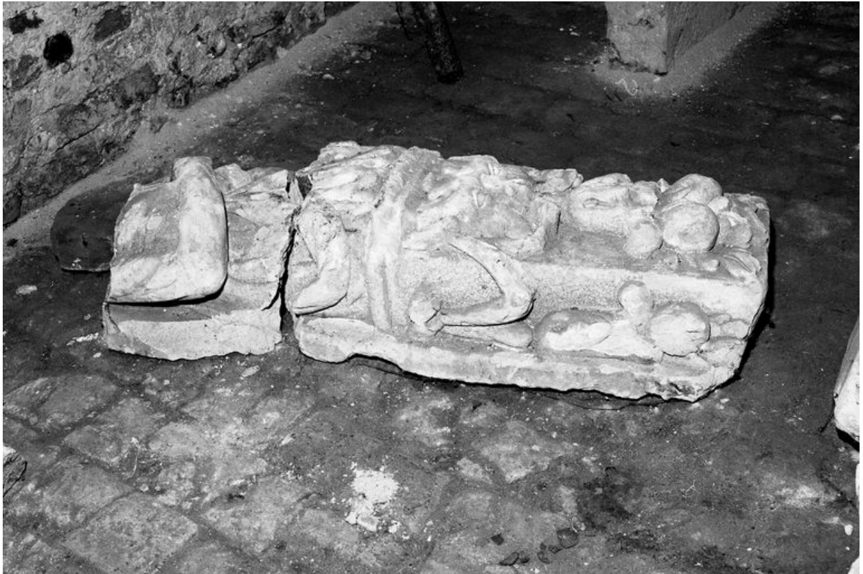
Vue partielle de l'ensemble : élément présentant un personnage engainé, vue de côté.