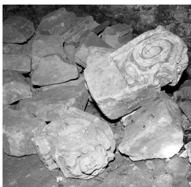
Vue partielle de l'ensemble : au premier-plan, un élément à tête d'ange et un élément à volute. IVR31_20085900803X