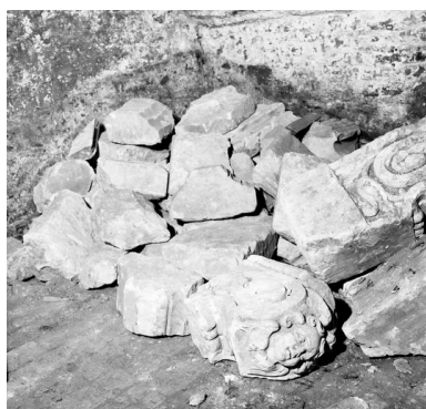
Vue partielle de l'ensemble. IVR31_20085900798X