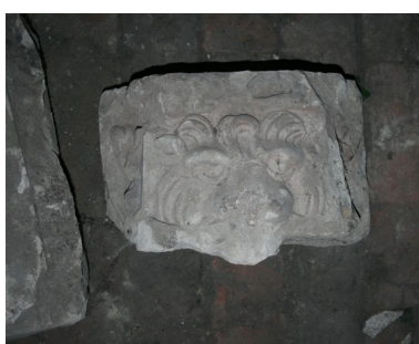
Vue partielle de l'ensemble : élément à mufle de lion.