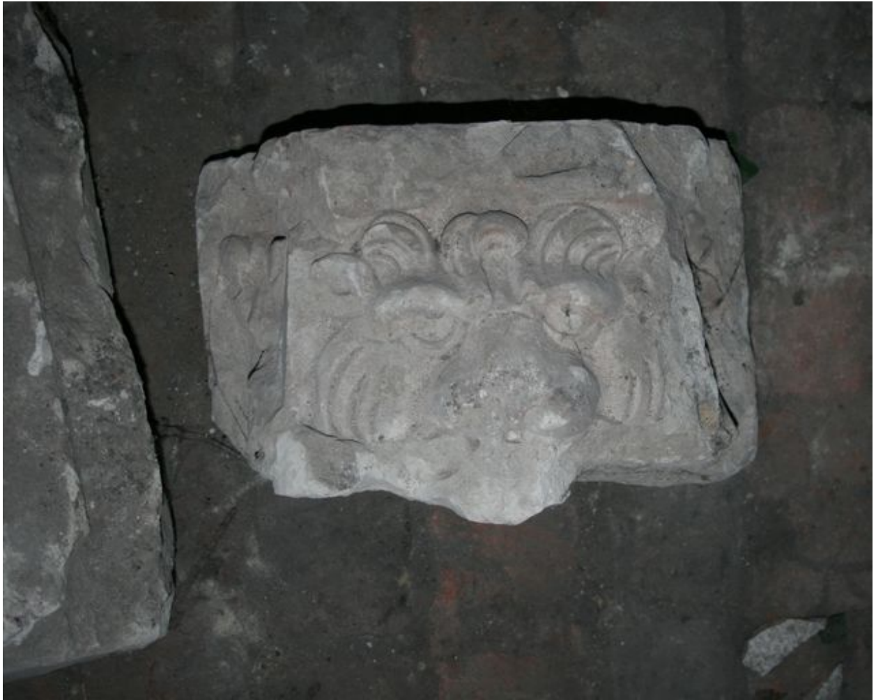
Vue partielle de l'ensemble : élément à mufle de lion.