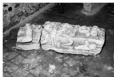
Vue partielle de l'ensemble : élément présentant un personnage engainé, vue de côté.