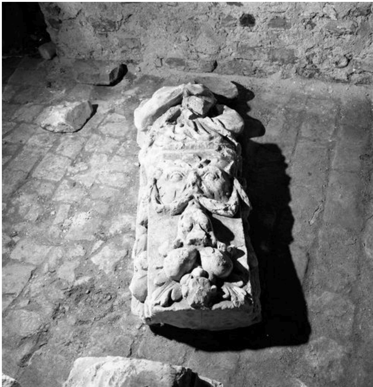
Vue partielle de l'ensemble : élément présentant un personnage engainé, vue de la gaine avec décor de mascaron feuillagé et chute de fruits.