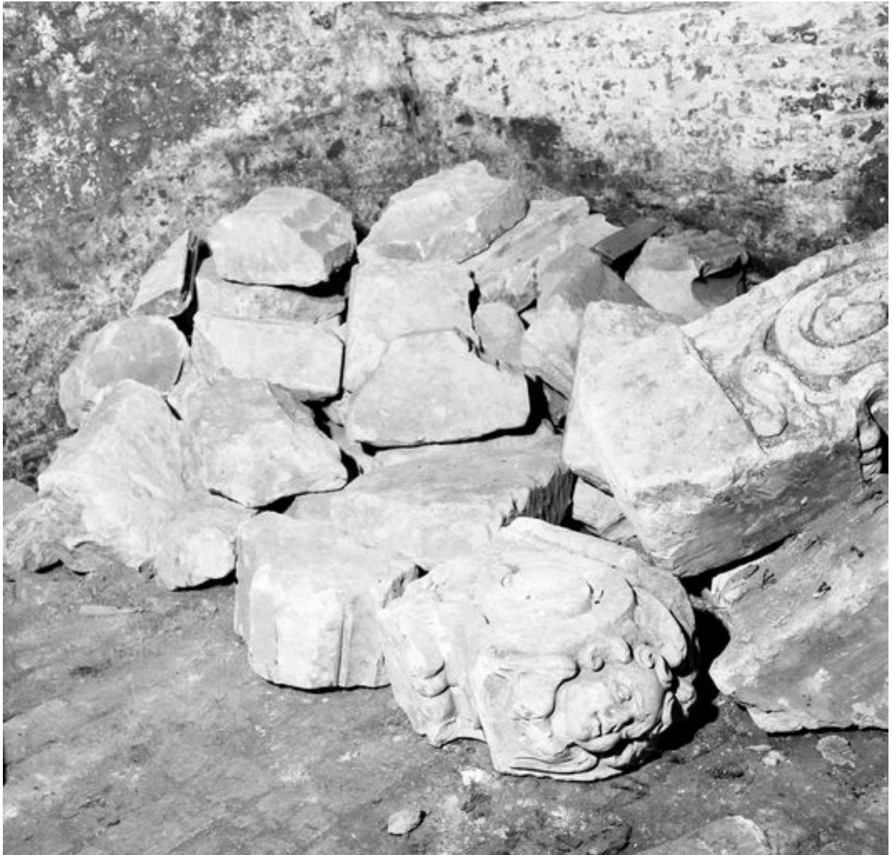
Vue partielle de l'ensemble.