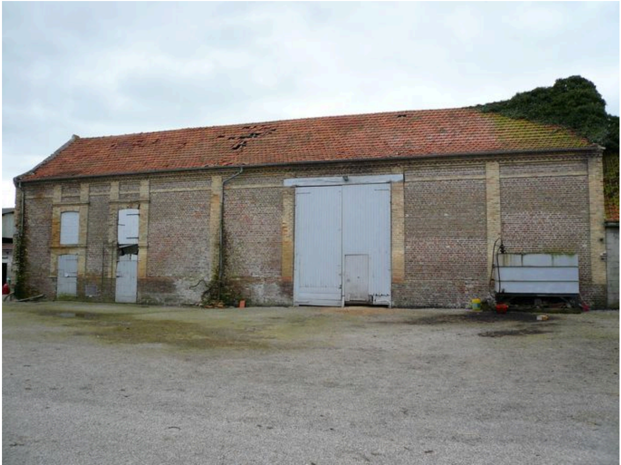
Vue de la seconde grange au sud de la cour.