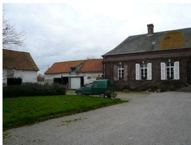
Vue de l'écurie dans le prolongement du logis. IVR22_20078005732NUCA