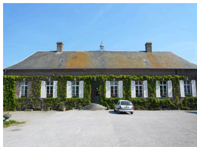
Vue du logis. IVR22_20078005729NUCA