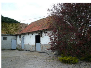
Vue de la bergerie au sud-ouest de la cour.