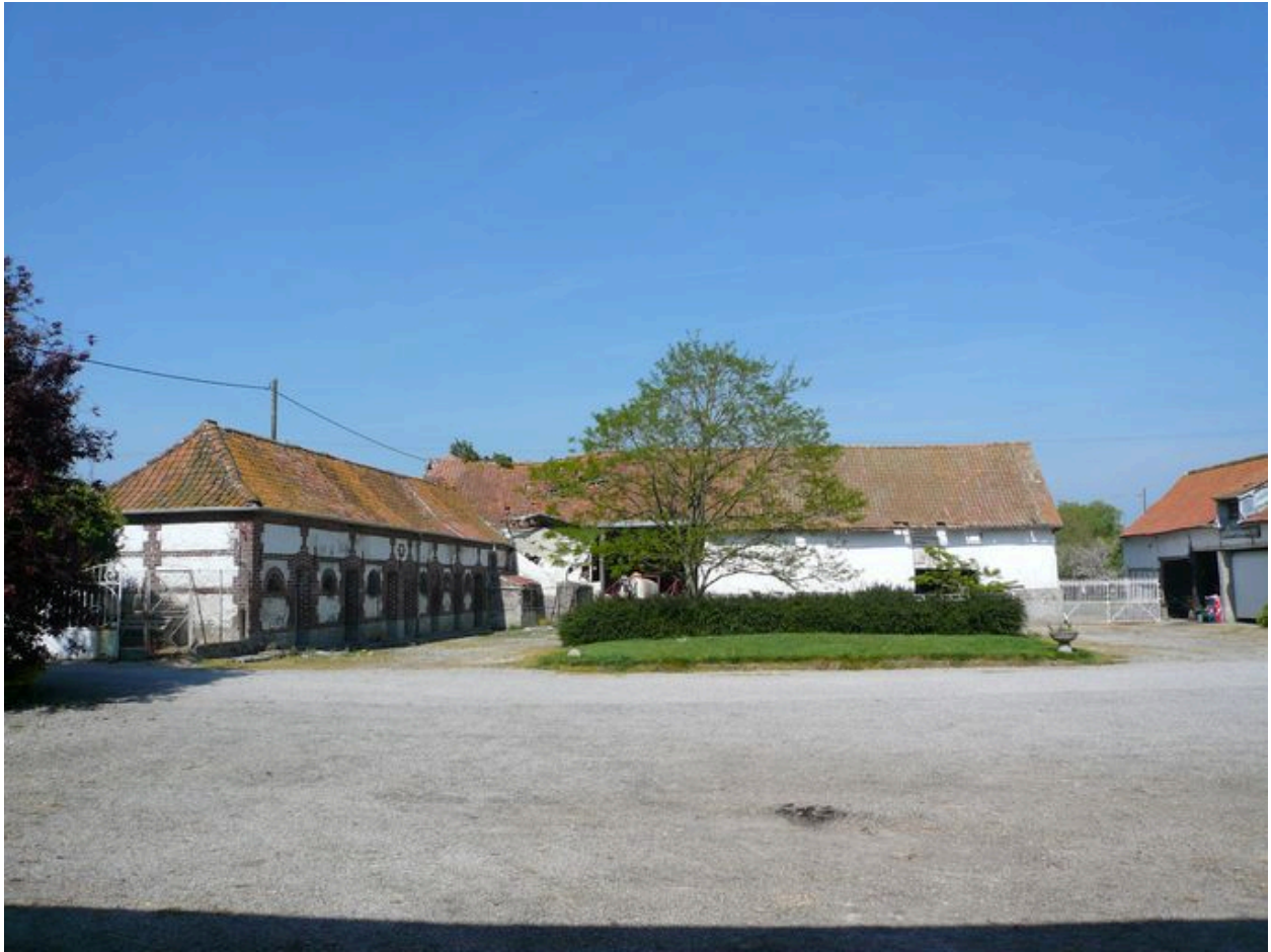
Vue des porcheries le long de la rue (à l'ouest) et de la grange au nord.