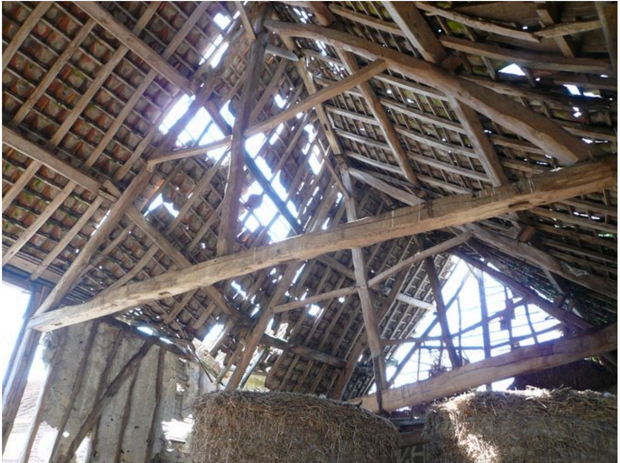
Vue d'une ferme de la grange.