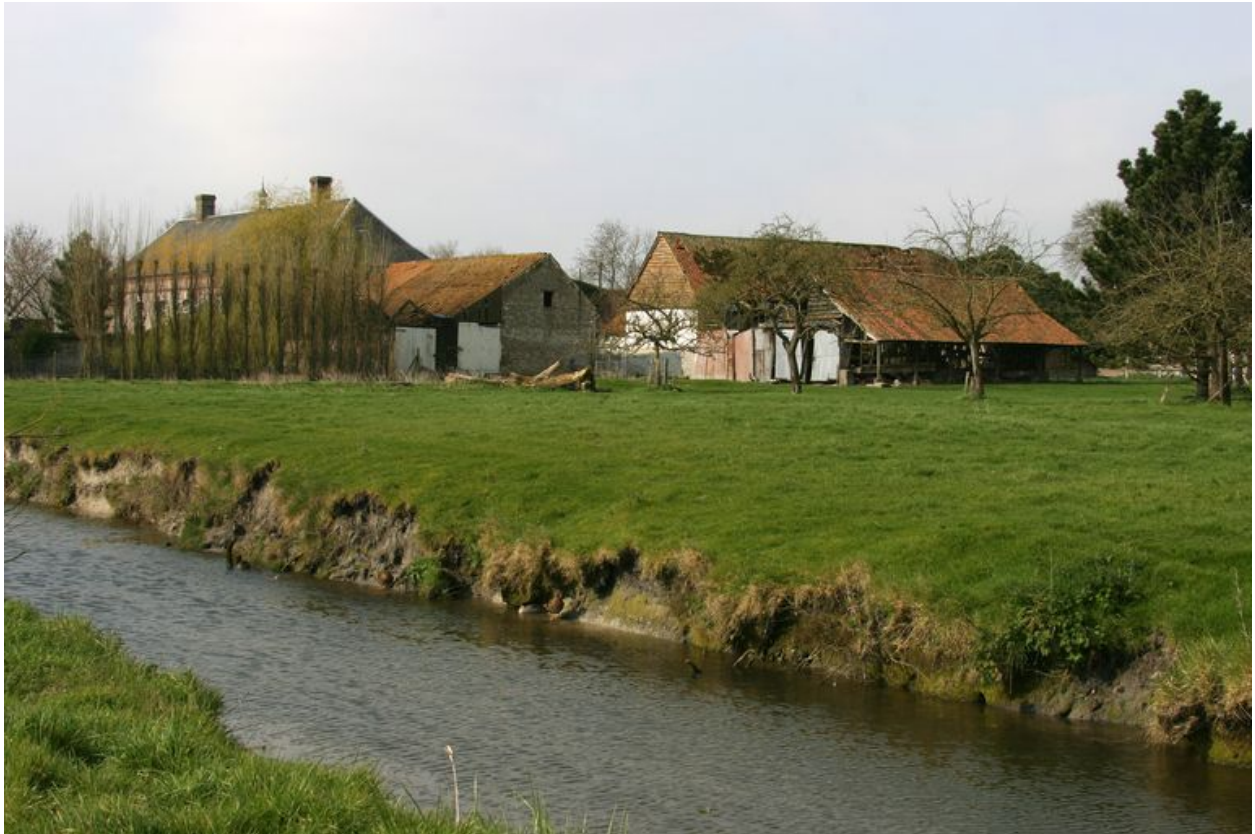
Vue générale postérieure.