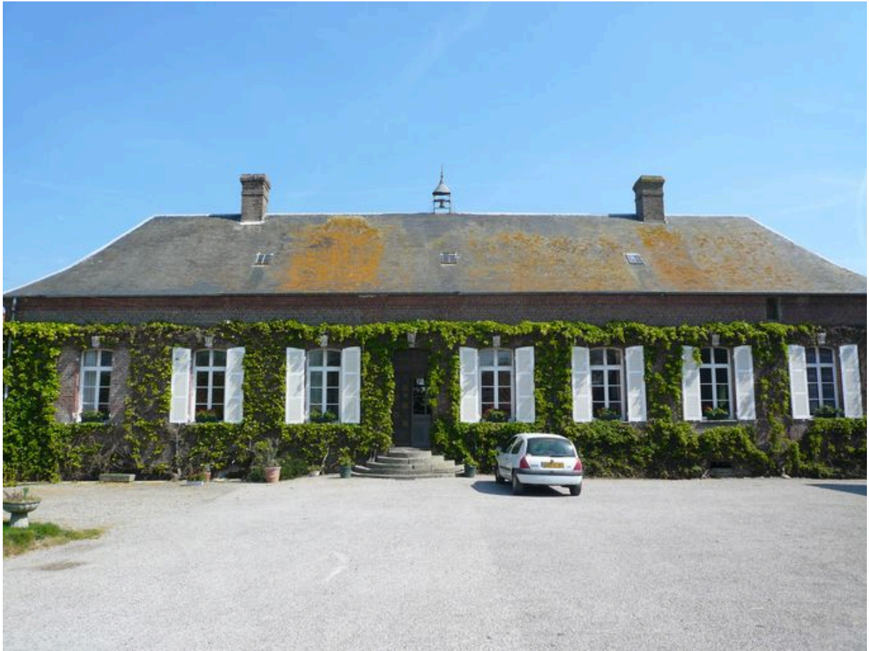
Vue du logis.