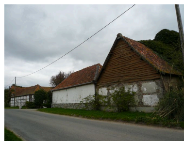
Vue de l'entrée rue des Forges.