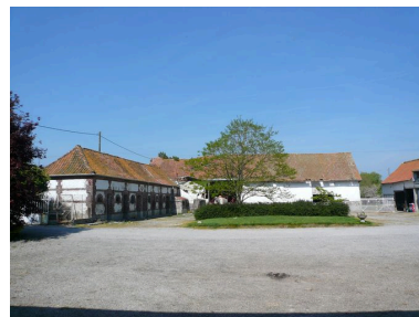
Vue des porcheries le long de la rue (à l'ouest) et de la grange au nord.