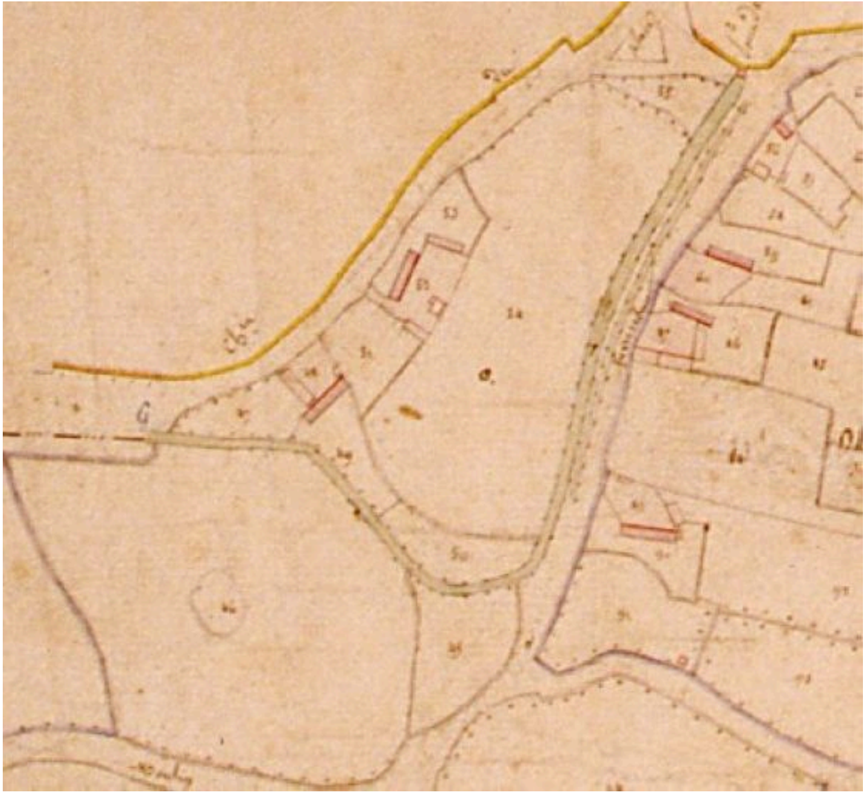
Extrait du cadastre napoléonien présentant le plan de la ferme en 1828.