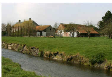
Vue générale postérieure. IVR22_20078000139NUCA