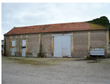
Vue de la seconde grange au sud de la cour.