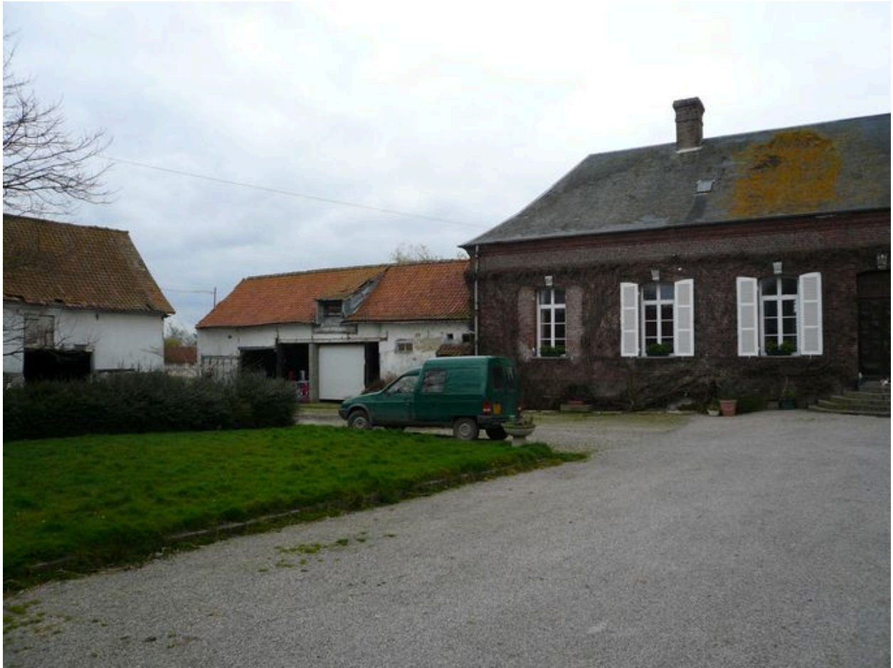
Vue de l'écurie dans le prolongement du logis.