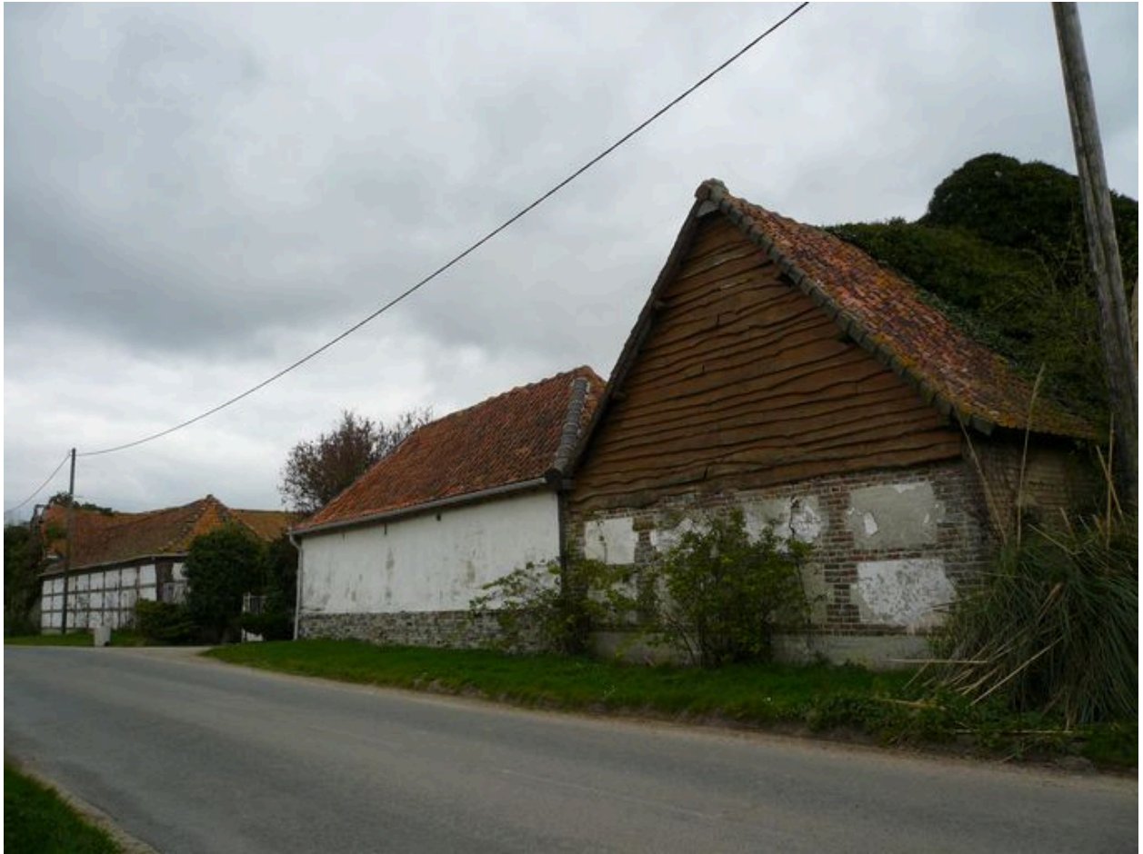
Vue de l'entrée rue des Forges.