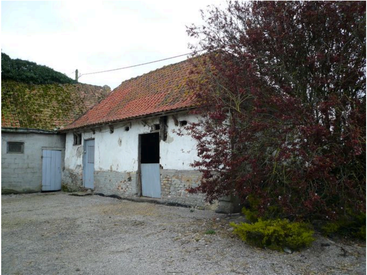
Vue de la bergerie au sud-ouest de la cour.