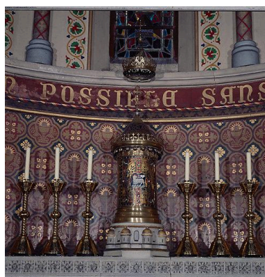
Tabernacle.