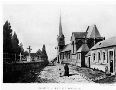
Vue du cimetière, vers 1908 (Comité arch. de Noyon, t XXI).

IVR22_20096000534NUCA