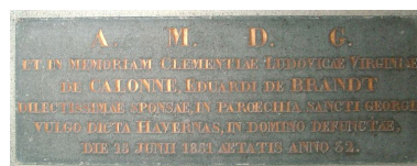
Plaque de dédicace en marbre noir encastée dans le fond d'autel.