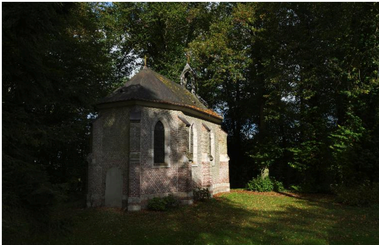
Chevet et flanc est de la chapelle funéraire.