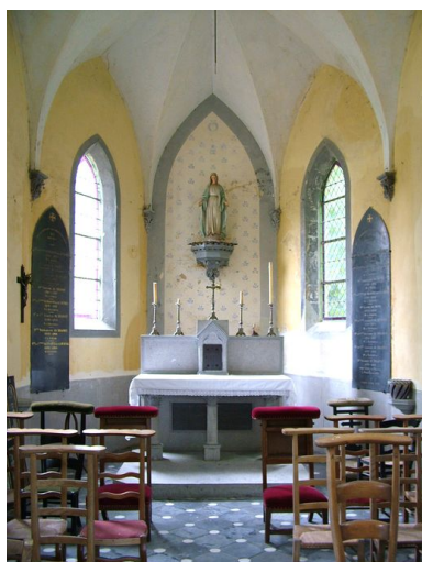
Vue intérieure.