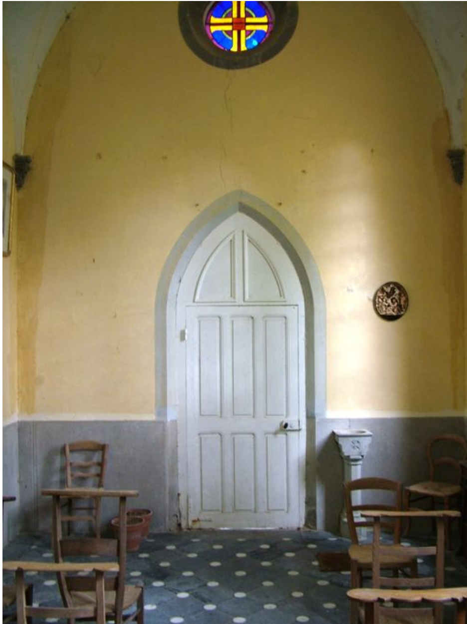
Revers de la façade.