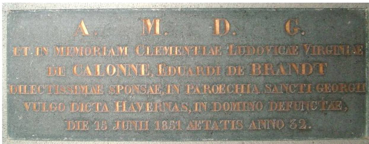
Plaque de dédicace en marbre noir encadrée dans le fond d'autel.