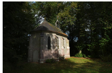
Chevet et flanc est de la chapelle funéraire.

IVR22_20108001690NUCA