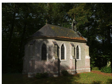
Flanc est de la chapelle funéraire. IVR22_20128000900NUC2A

IVR22_20128000901NUC2A