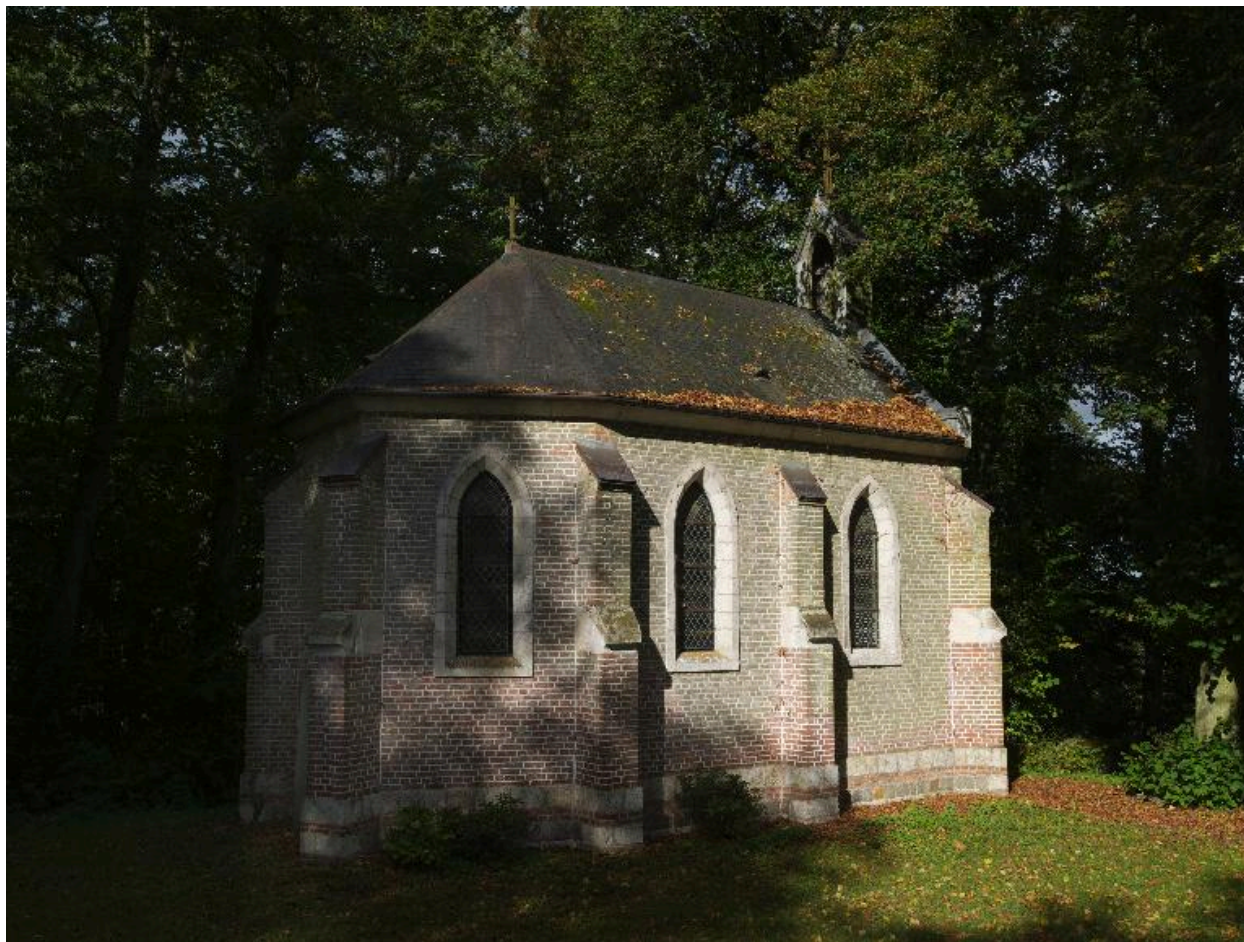
Flanc est de la chapelle funéraire.