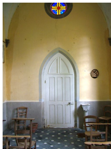
Revers de la façade.

IVR22_20108001684NUCA