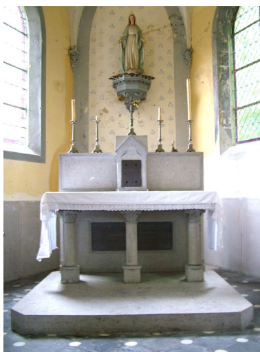
Autel. IVR22_20108001685NUCA