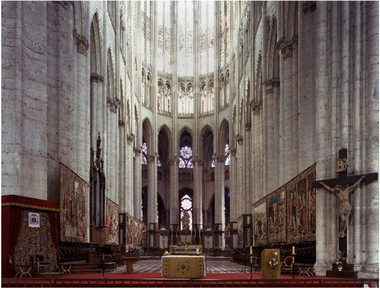
Vue des tapisseries exposées dans le chœur (en direction du chœur).