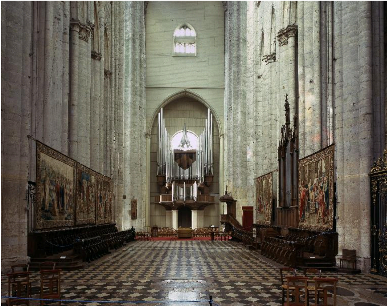
Vue des tapisseries exposées dans le chœur (en direction de l'orgue).