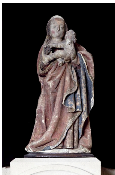
La statue, vue de face.