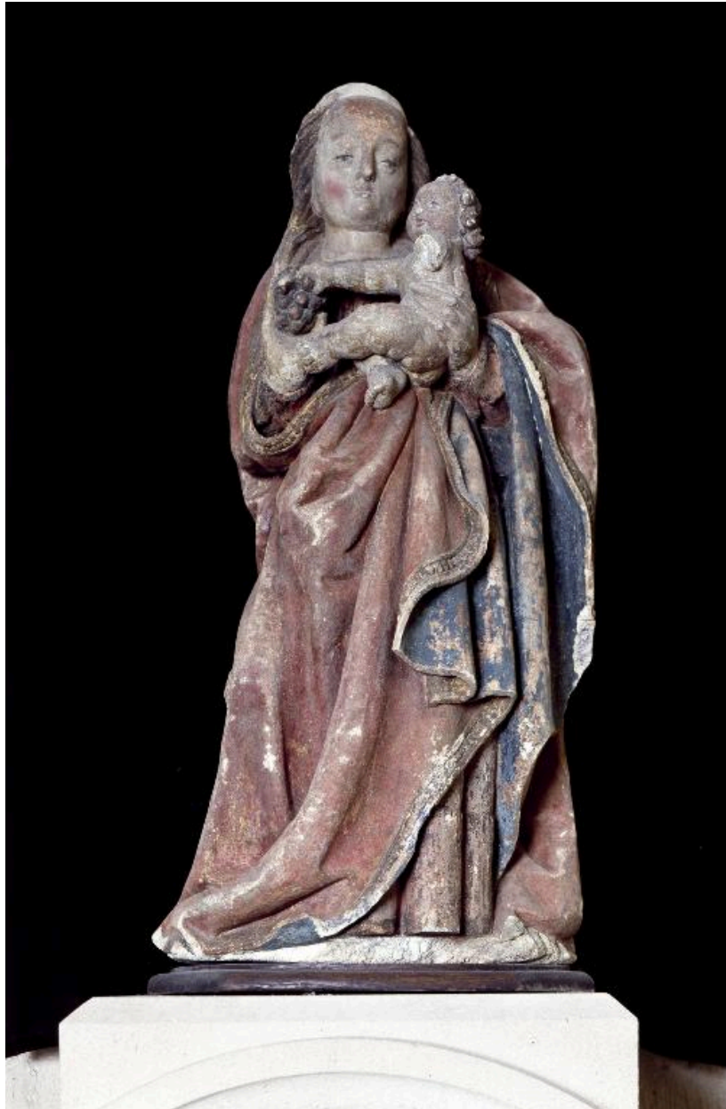
La statue, vue de face.