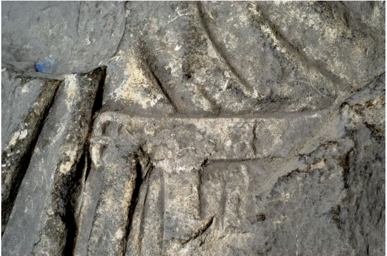
Détail de la ceinture.