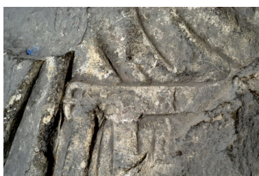
Détail de la ceinture. IVR22_20090200363NUCA