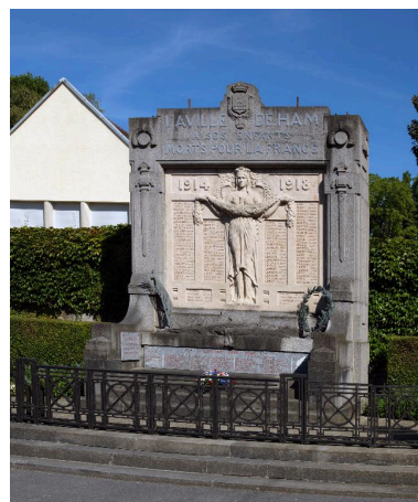
Vue de la stèle.

IVR22_20158000871NUC2A