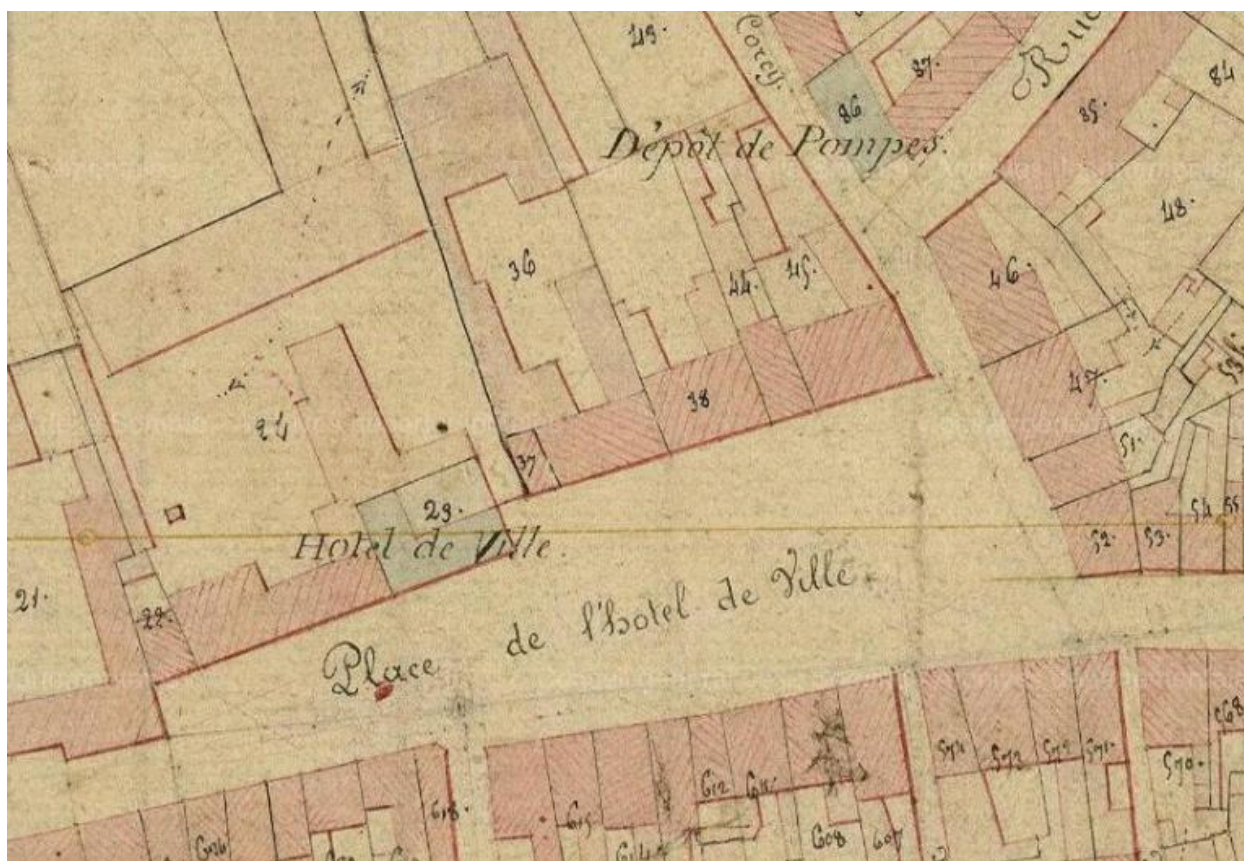
Extrait du cadastre de 1826.