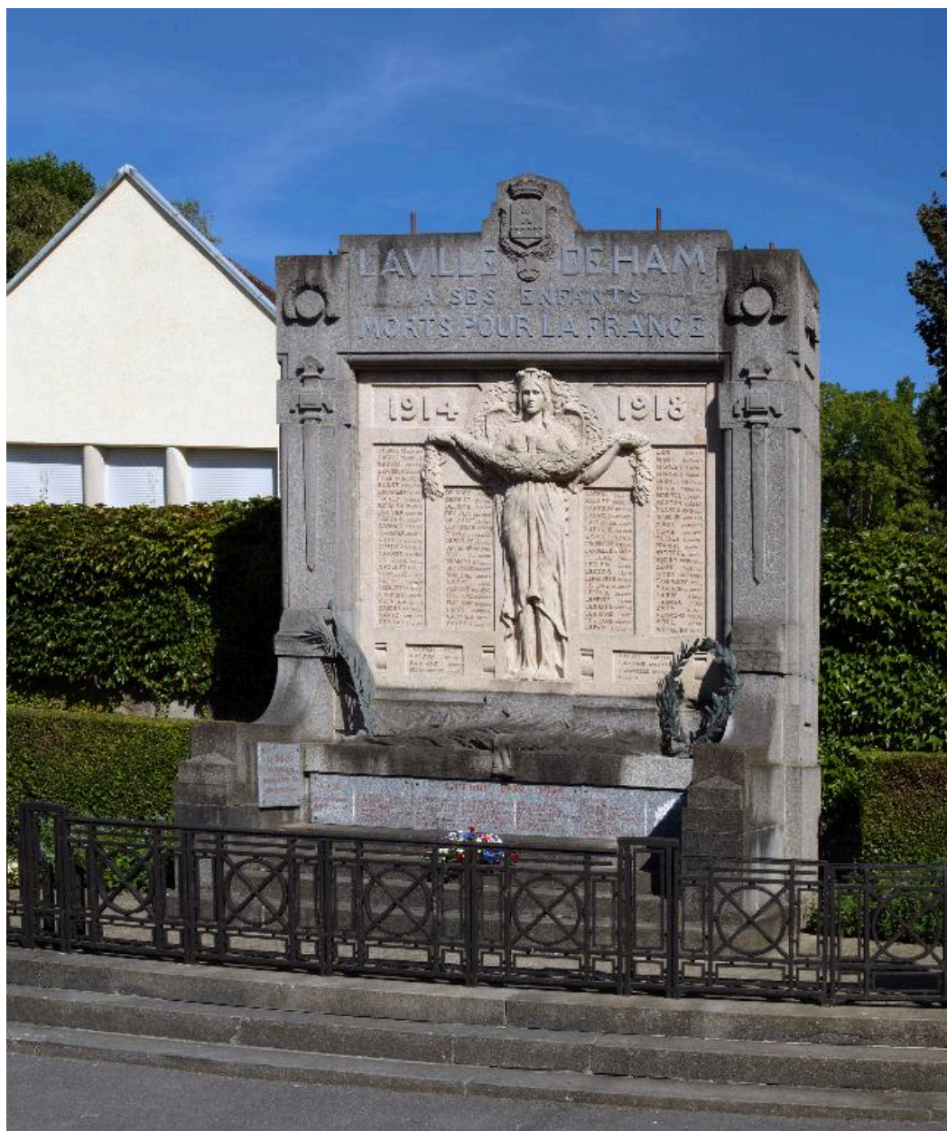
Vue de la stèle.