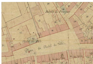
Extrait du cadastre de 1826 (AD Somme).

IVR22_20158006207NUCA