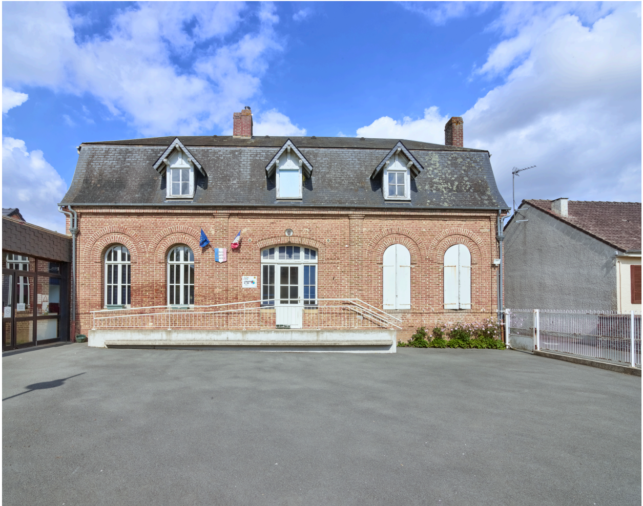
Vue de l'école, depuis le sud/ouest.