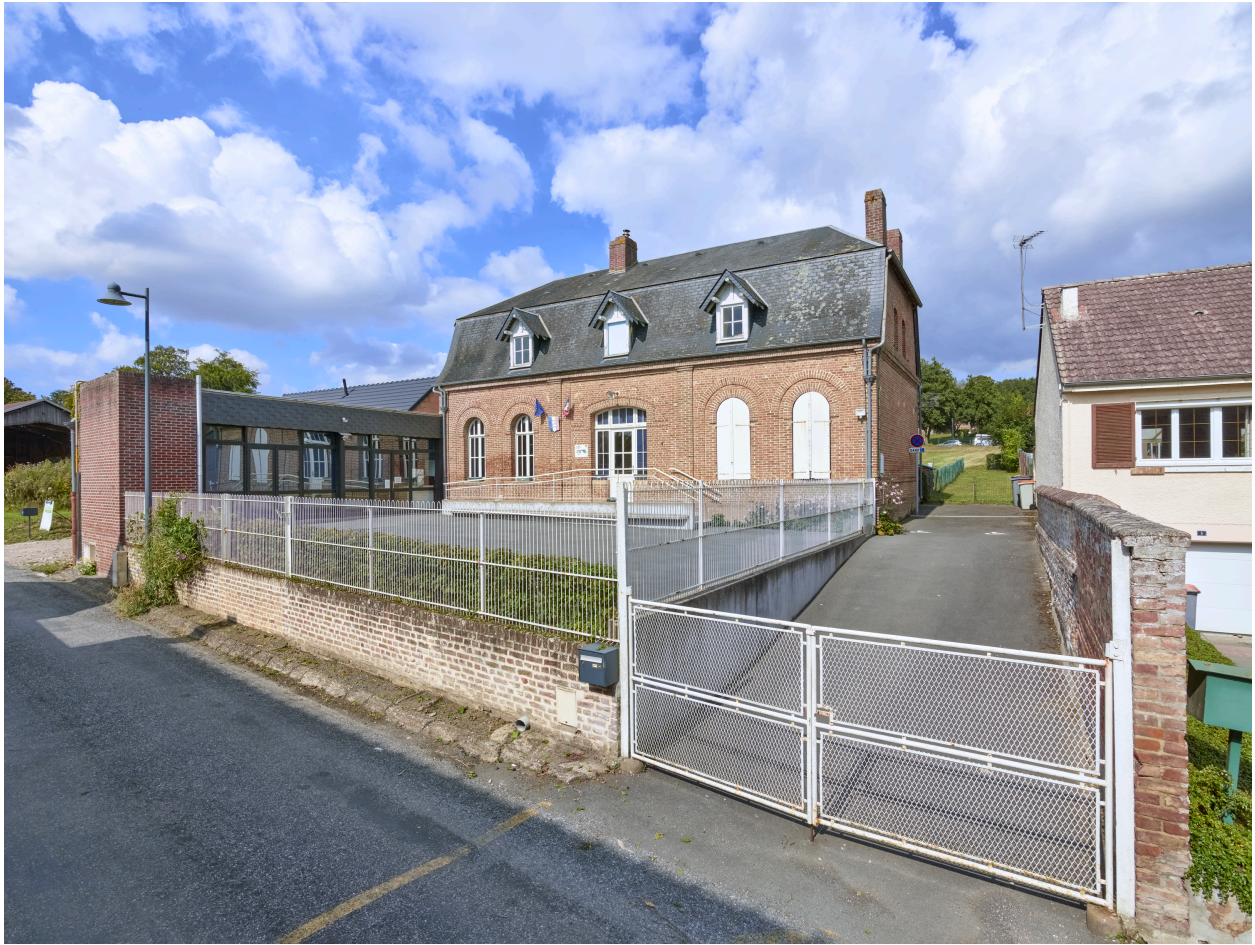
Vue de l'école, depuis le sud.