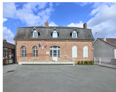
Vue de l'école, depuis le sud/ouest. IVR32_20248001346NUCA