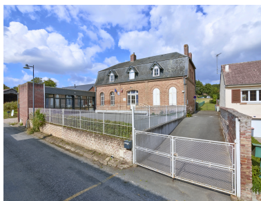
Vue de l'école, depuis le sud. IVR32_20248001345NUCA

IVR32_20248001451NUCA