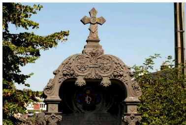
Détail sur la partie supérieure. IVR22_20038000909NUCA