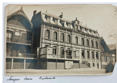
Façade antérieure donnant sur l'esplanade, vue générale prise de trois-quarts gauche. Carte postale, début 20e siècle (coll. part.).

Phot. Bouvet Hubert IVR31_20146202259NUCA