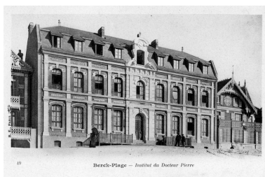
Elévation antérieure donnant sur la plage, vue générale prise de trois-quarts gauche. Carte postale, début 20e siècle (coll. part.).

Phot. Thibaut Pierre (reproduction) IVR31_20066200428NUC