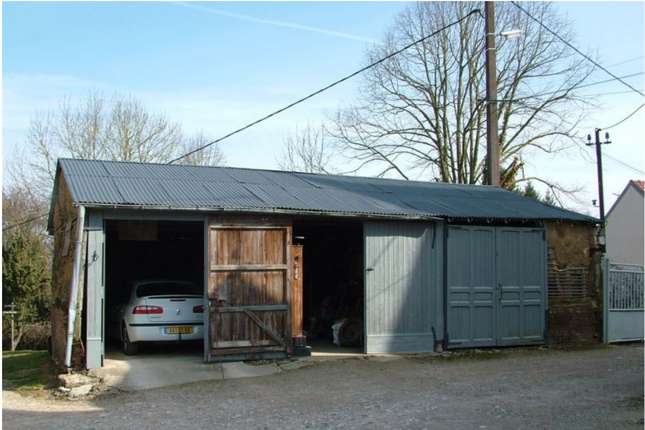
Ancienne étable transformée en garage.