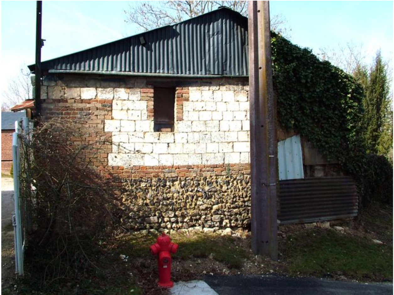
Pignon sur rue de l'ancienne étable.