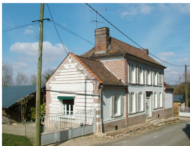
Vue de trois quarts avant du logis. IVR22_20108001100NUCA