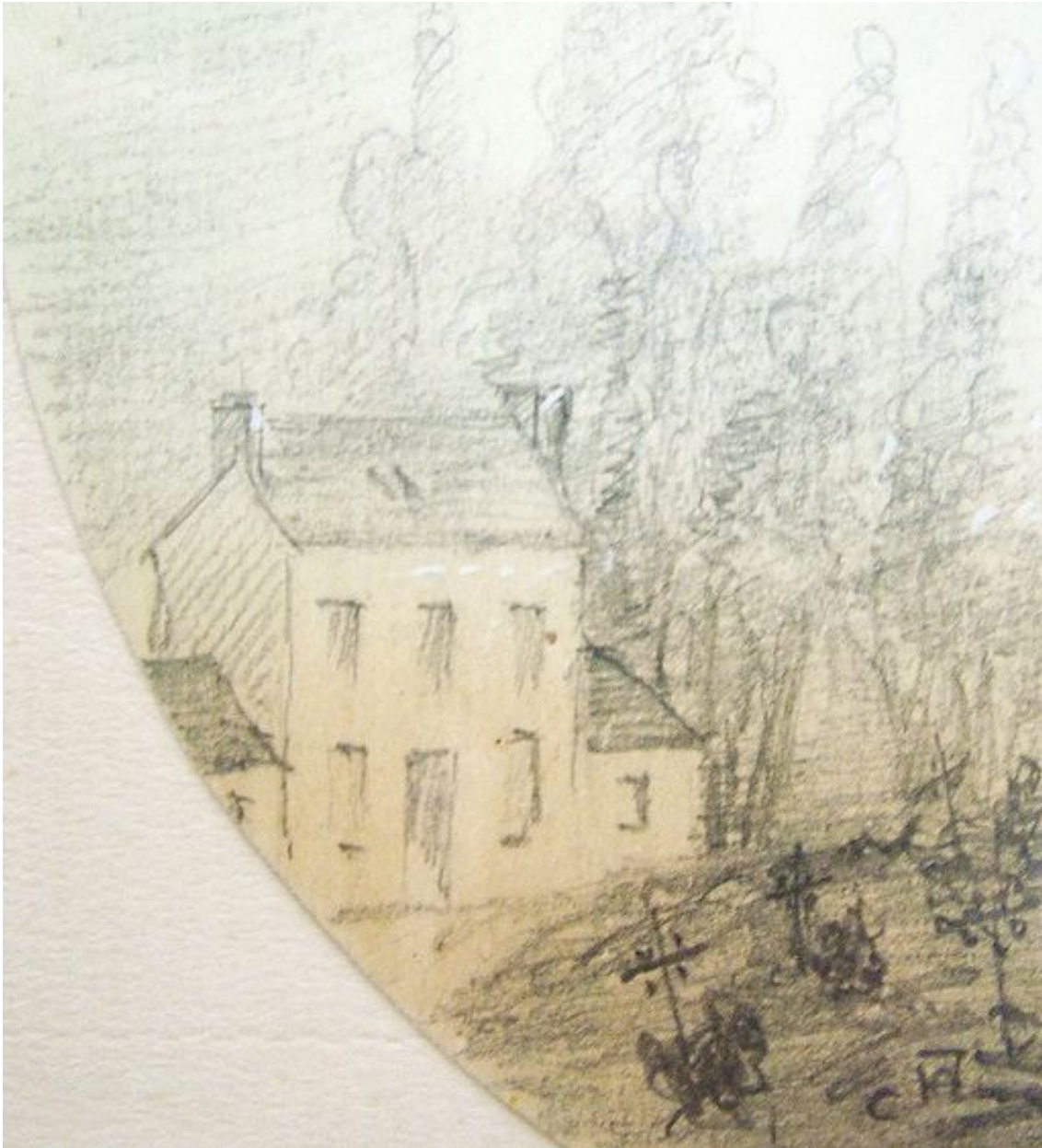
Vue générale depuis la place, vers 1870.