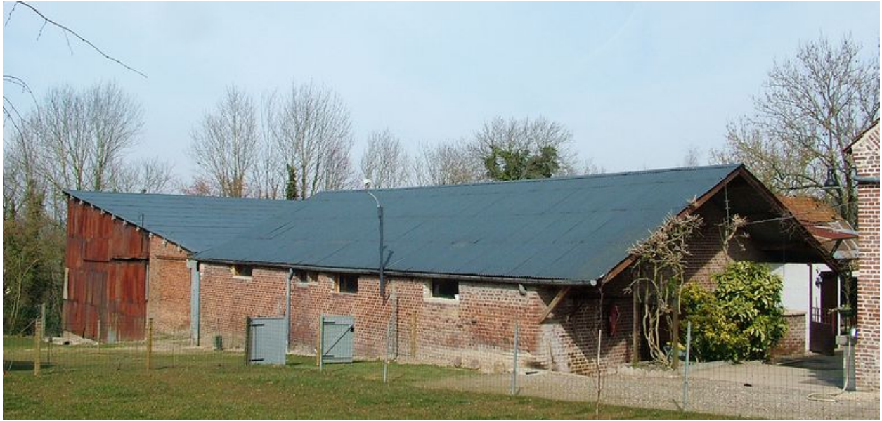
Vue générale des nouvelles étables et de la grange.