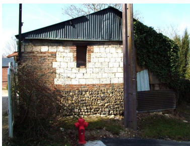
Pignon sur rue de l'ancienne étable.