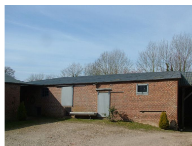
Nouvelle grange.