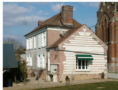
Vue de trois quarts arrière du logis. IVR22_20108001099NUCA