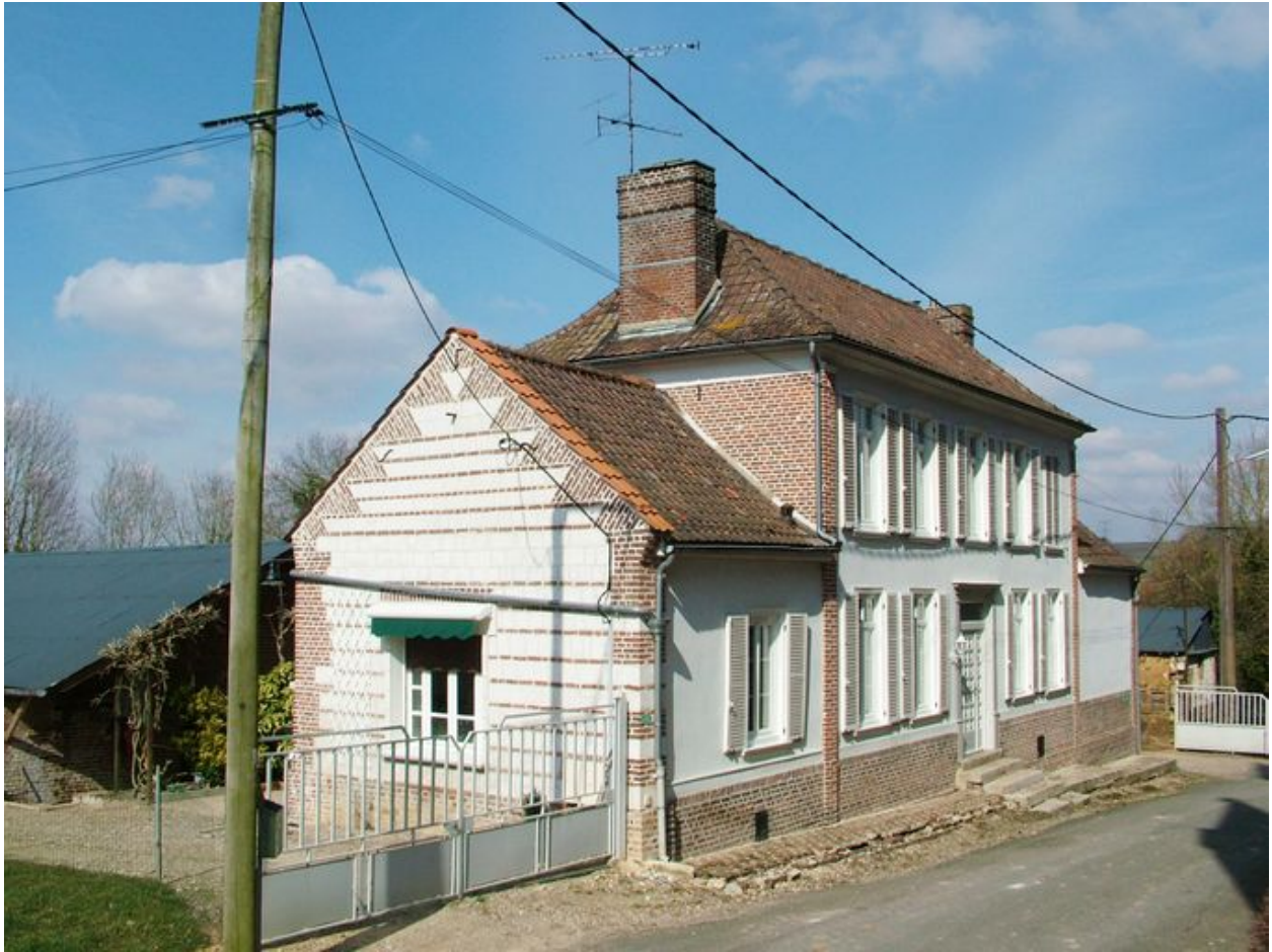
Vue de trois quarts avant du logis.