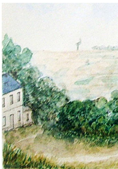
Vue générale depuis la place et l'église, attribuée à Charles de Brandt, 1867 (coll. part.).