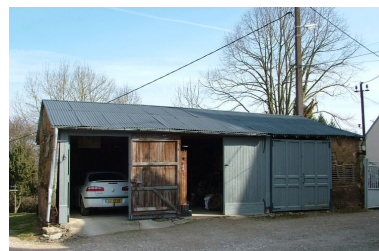
Ancienne étable transformée en garage. IVR22_20108001104NUCA