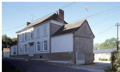
Le logis depuis la rue. IVR22_20108000323XA