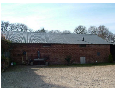
Nouvelle étable. IVR22_20108001105NUCA