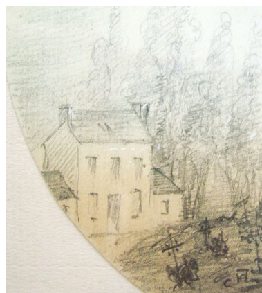
Vue générale depuis la place, vers 1870 (coll. part.).

Phot. Monnehay-Vulliet Marie-Laure IVR22_20108000178NUCA