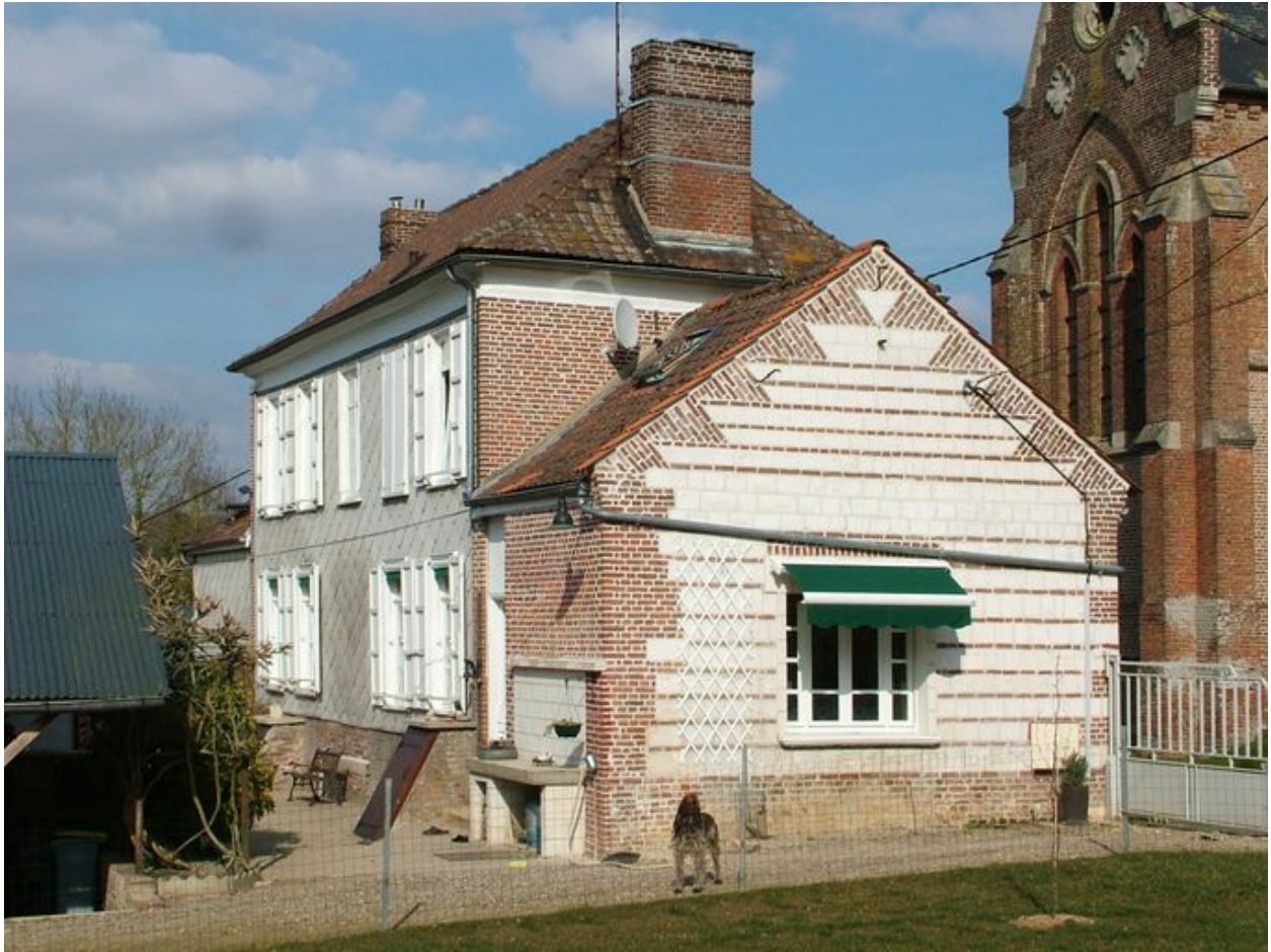
Vue de trois quarts arrière du logis.