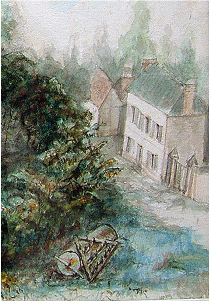
Vue générale depuis l'église et le cimetière, attribuée à Charles de Brandt, avant 1867 (coll. part.).