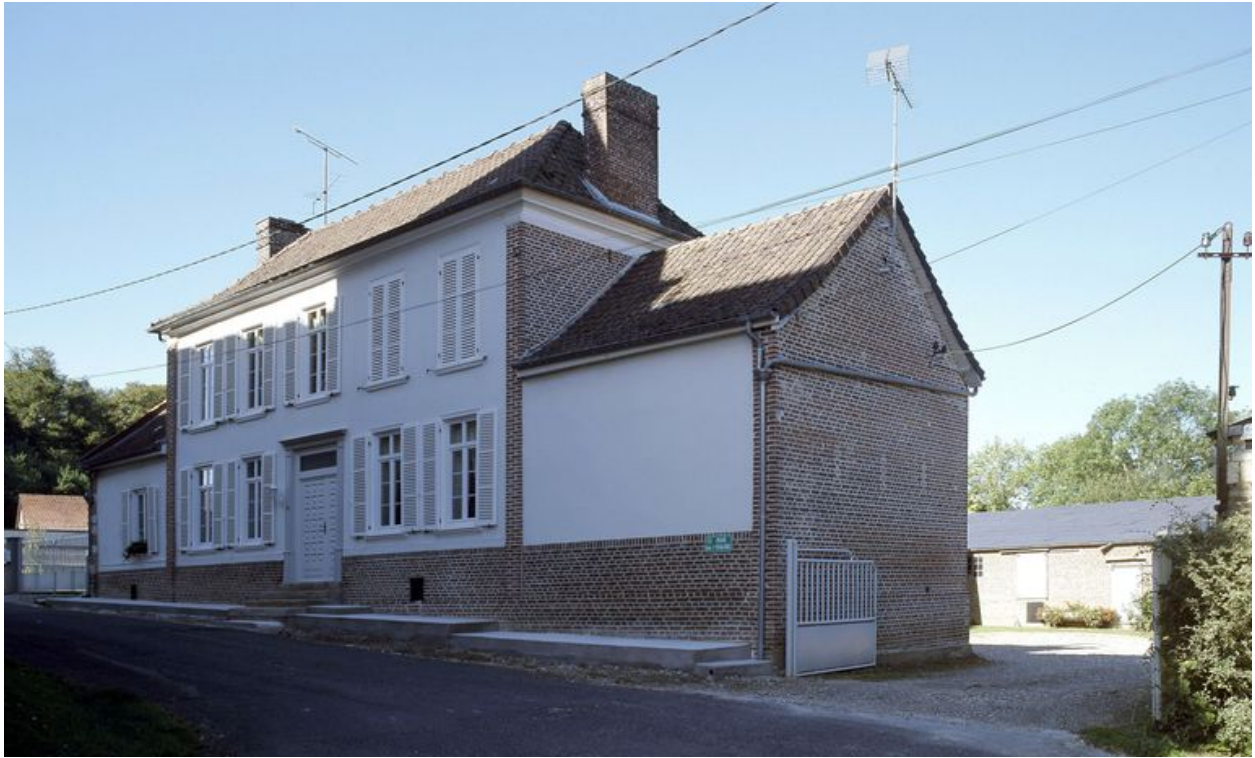
Le logis depuis la rue.