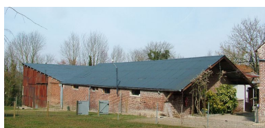
Vue générale des nouvelles étables et de la grange. IVR22_20108001102NUCA