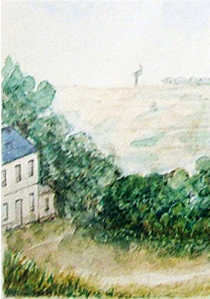
Vue générale depuis la place et l'église, attribuée à Charles de Brandt, 1867 (coll. part.).