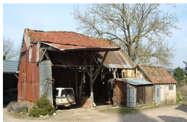
Ancienne grange.