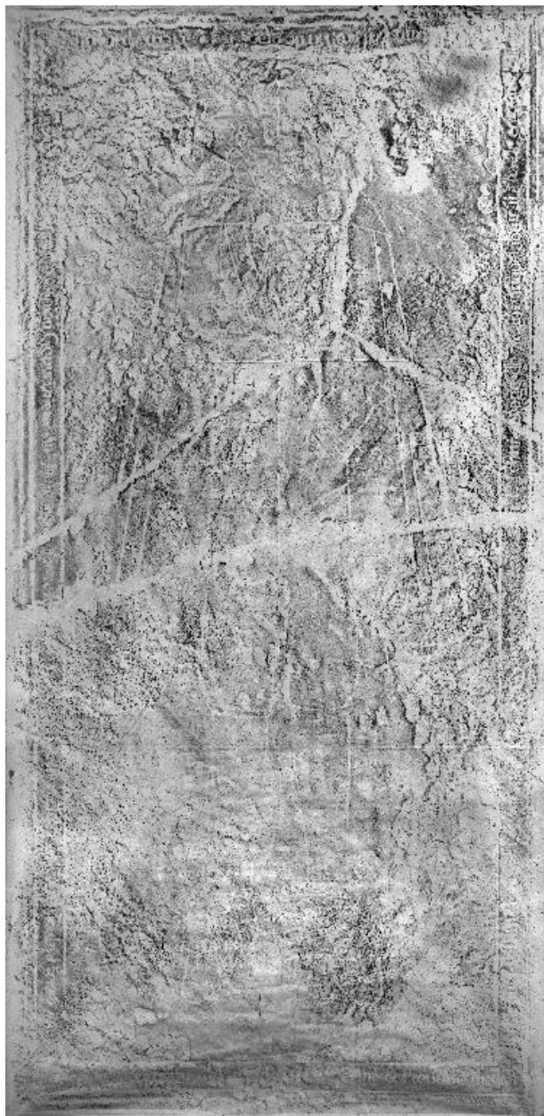
Vue de l'estampage de la dalle.