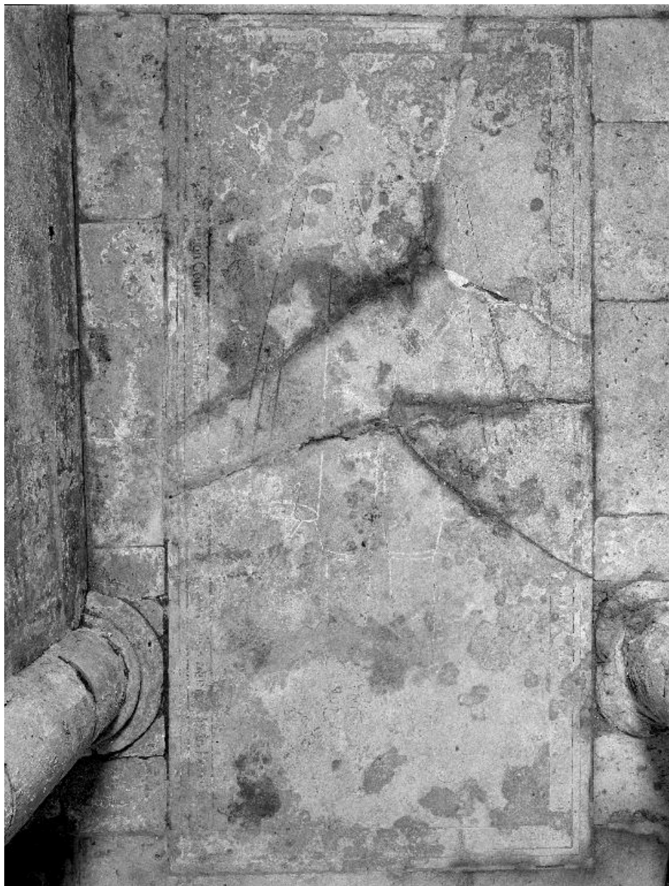
Vue générale de la dalle.