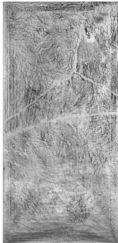
Vue de l'estampage de la dalle.