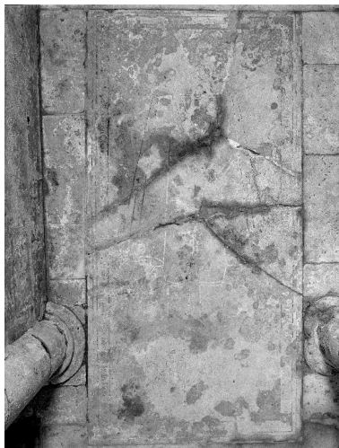
Vue générale de la dalle. IVR22_20010202990X