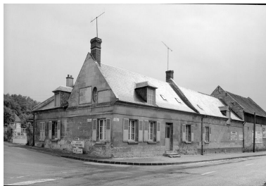
Vue générale depuis la rue. IVR22_19856000767X