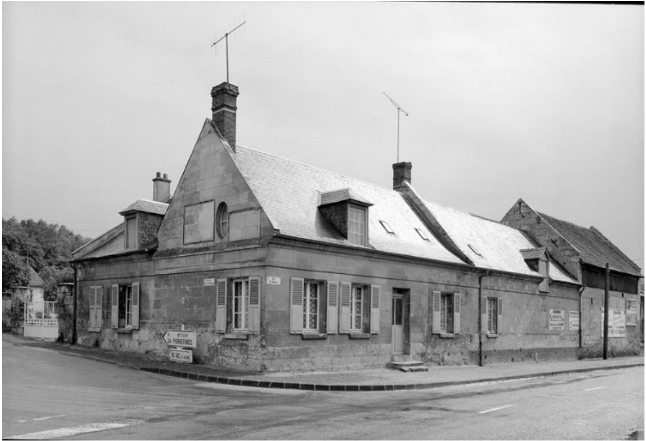
Vue générale depuis la rue.