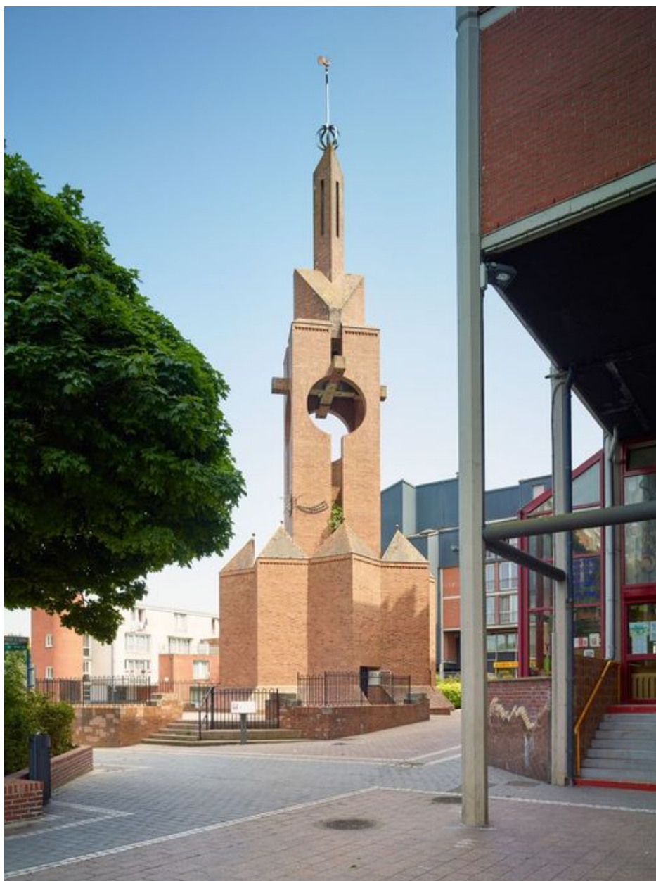
Élévation antérieure vue de trois quart est.