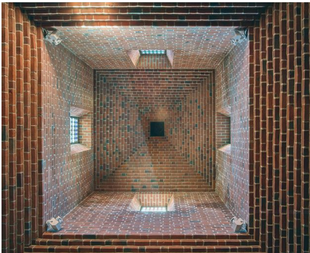
Vue en contre-plongée de l'intérieur du clocher.