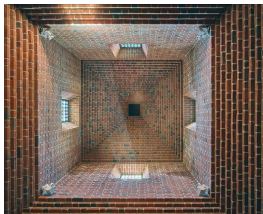
Vue en contre-plongée de l'intérieur du clocher. IVR31_20155901729NUCA