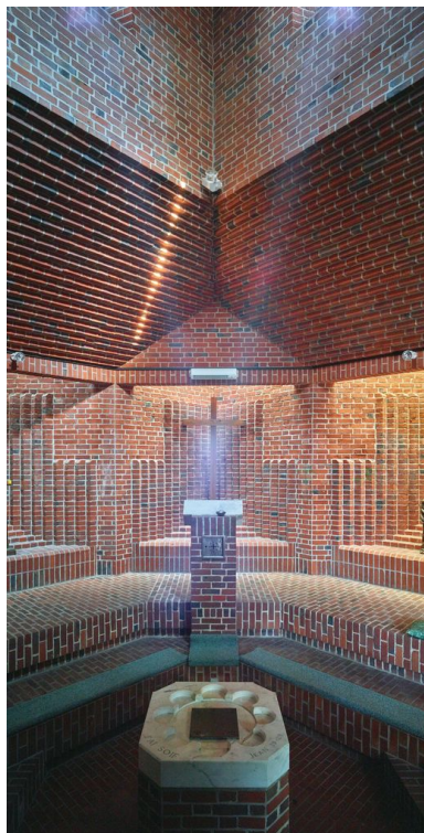
Vue intérieure, autel. IVR31_20155901731NUCA