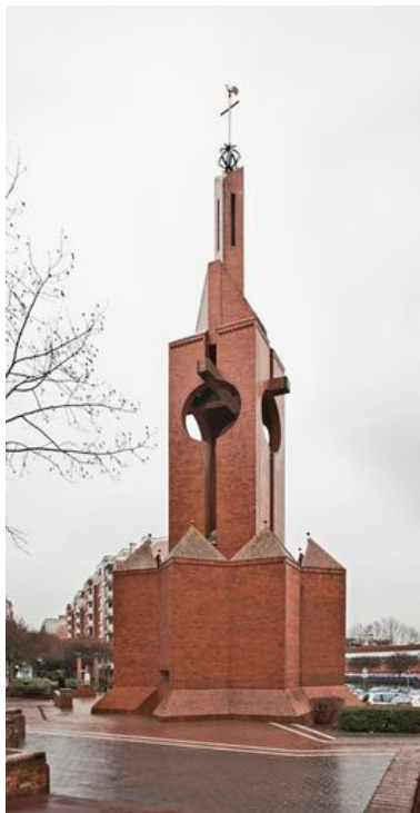
Vue générale. IVR31_20105900654NUCA