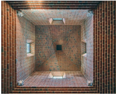
Vue en contre-plongée de l'intérieur du clocher.