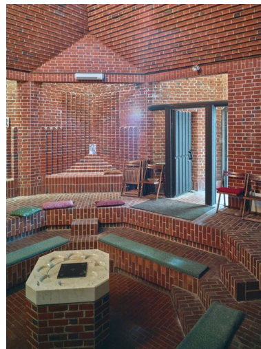
Vue intérieure, entrée et autel. IVR31_20155901728NUCA