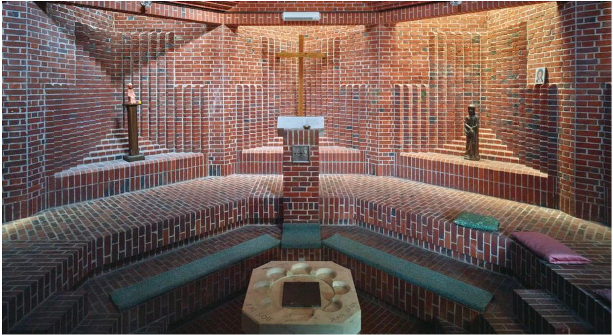
Vue intérieure, autel et gradins.