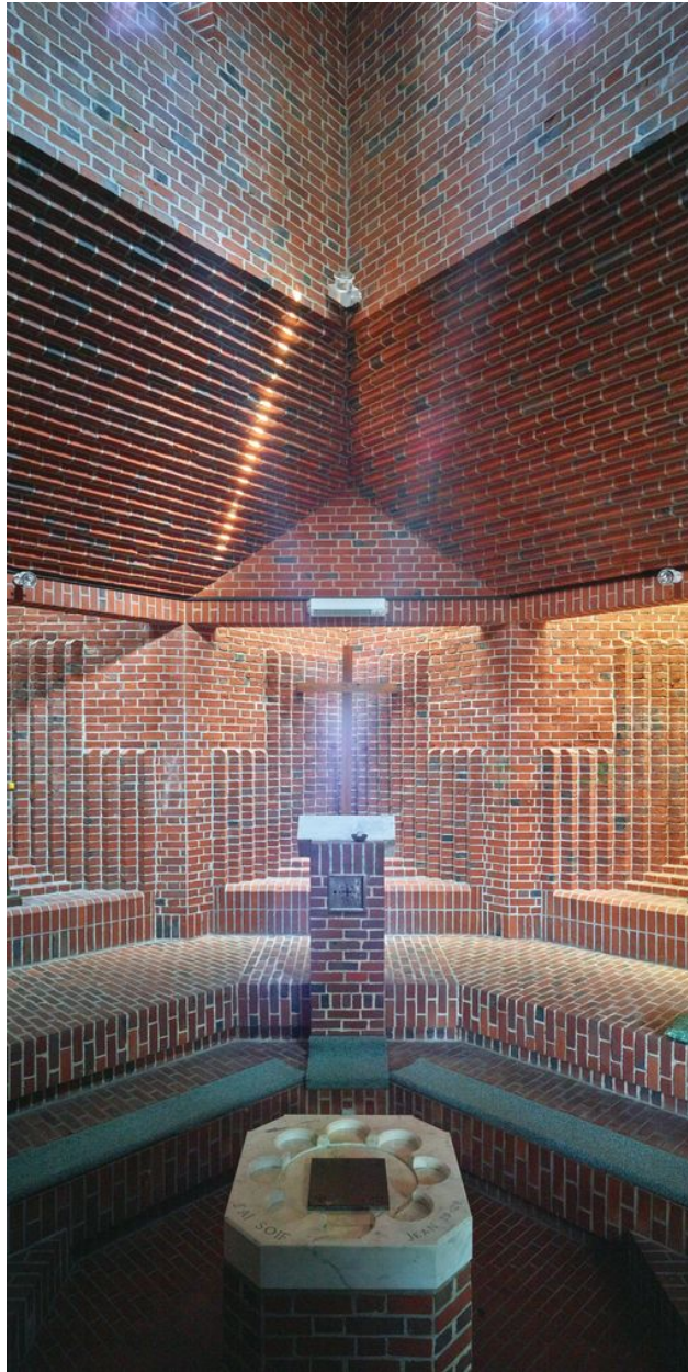
Vue intérieure, autel.