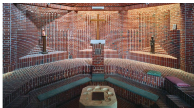
Vue intérieure, autel et gradins. IVR31_20155901730NUCA