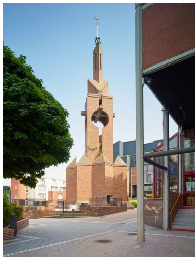
Élévation antérieure vue de trois quart est. IVR31_20155901642NUCA