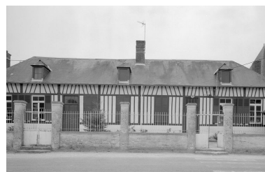
Elévation antérieure. IVR22_19846001063X