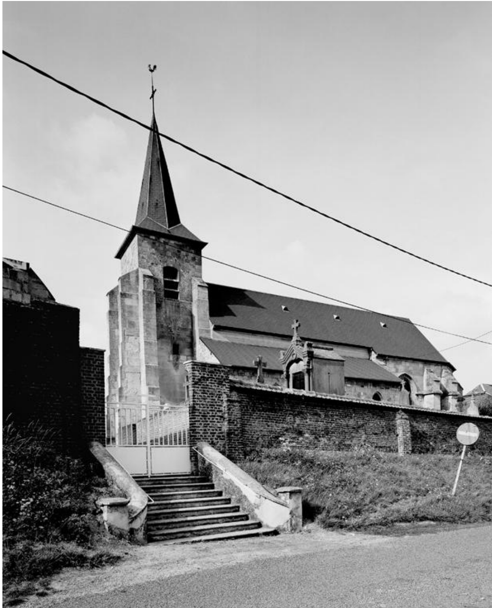
Vue d'ensemble de l'église et du cimetière, depuis le sud-ouest.