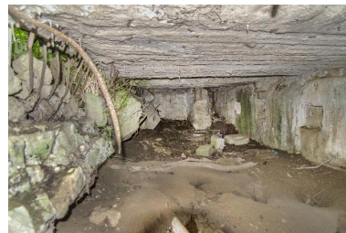
Salle principale, exposée au sud. Dans le fond, le départ de la coursière de tir