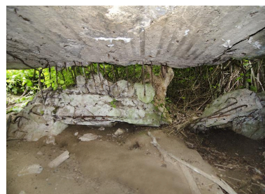
Le mur sud, exposé, de l'intérieur