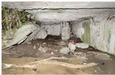
Salle principale, exposée au sud. Dans le fond, le départ de la coursière de tir