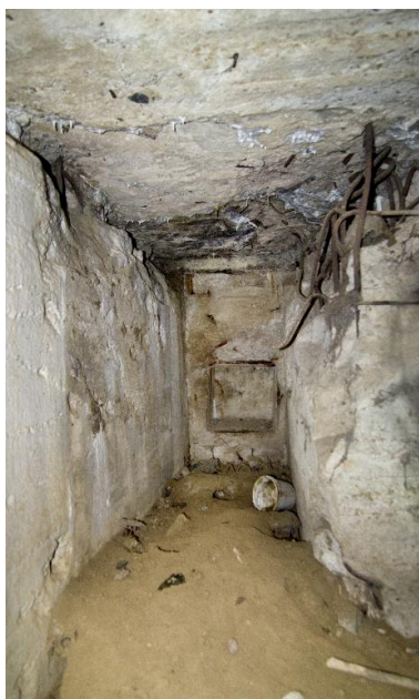
La coursière de tir en enfilade. Dans le fond, la niche à munitions IVR32_20165901168NUCA