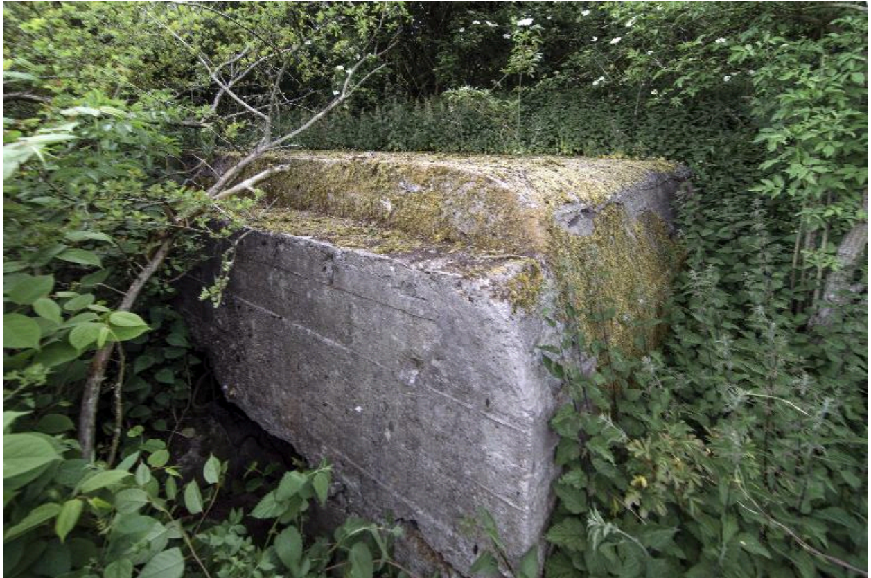
Seule partie visible de l'édifice. Le couverture, vers le nord-ouest