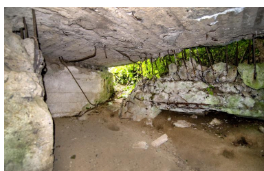
Vue intérieure vers la sortie sud-est IVR32_20165901169NUCA