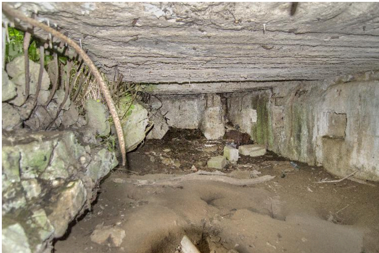
Salle principale, explosée au sud. Dans le fond, le départ de la coursière de tir