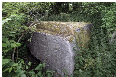
Seule partie visible de l'édifice. Le couvrement, vers le nord-ouest