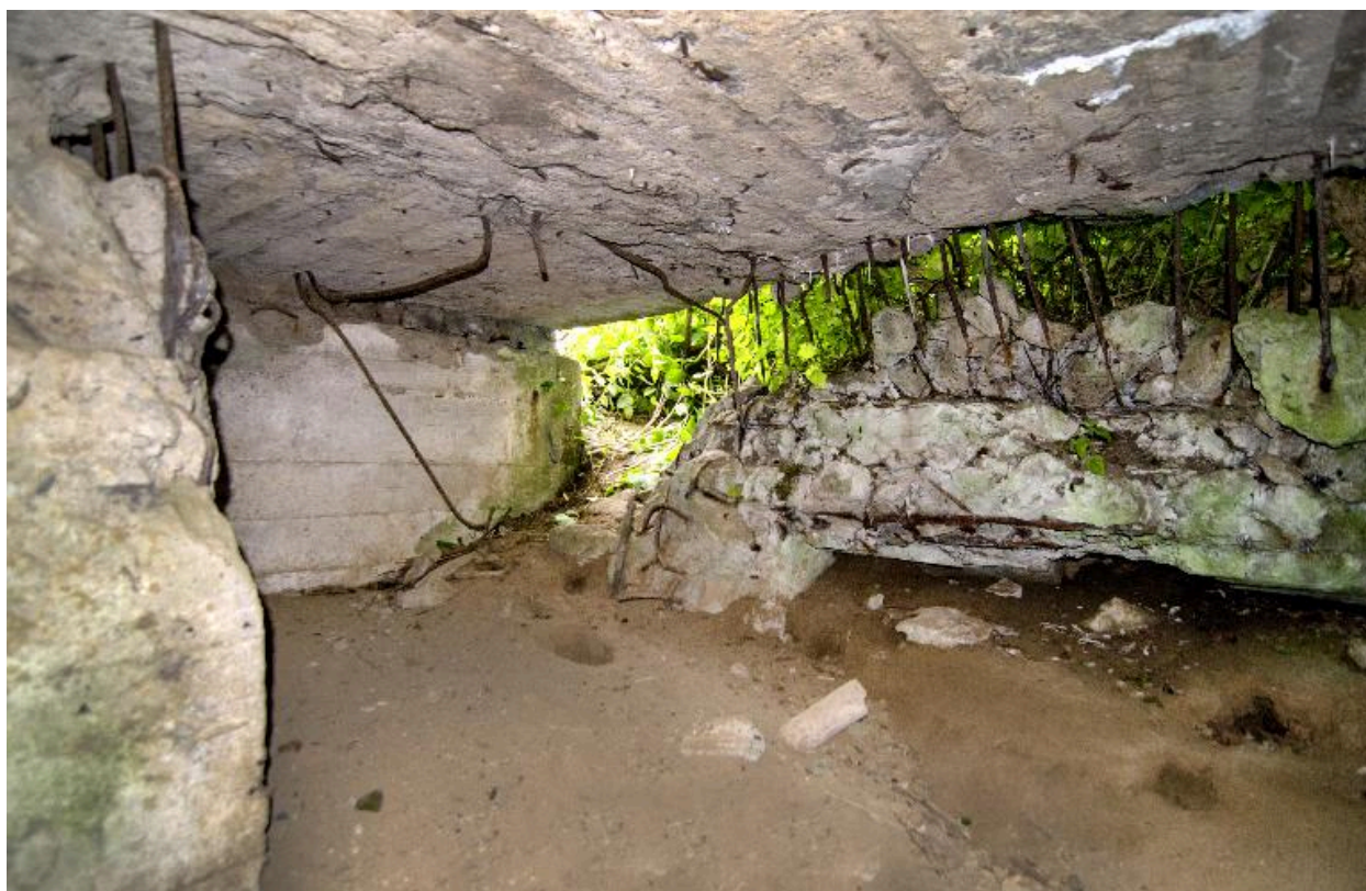
Vue intérieure vers la sortie sud-est