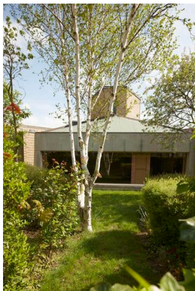
Vue générale. IVR31_20106200711NUCA