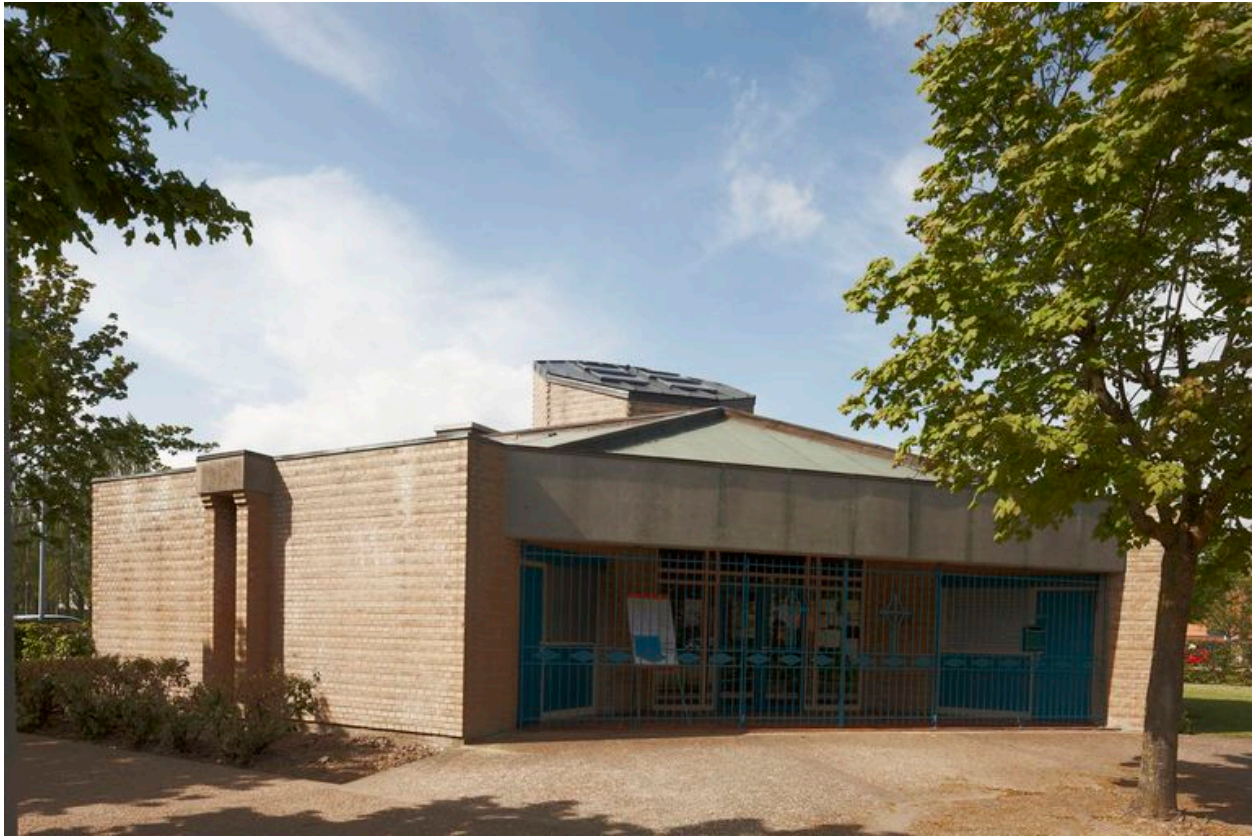
Vue de l'entrée.