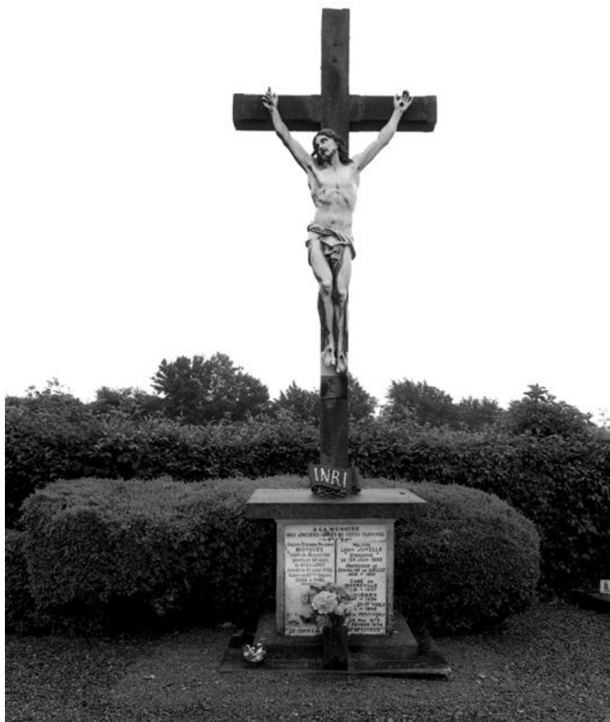
La croix du cimetière, sous laquelle sont enterrés les curés de la paroisse.