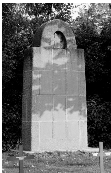
Le monument aux morts allemand.