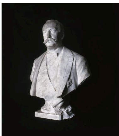
Vue du buste, de trois-quart.

IVR22_19990204119XA