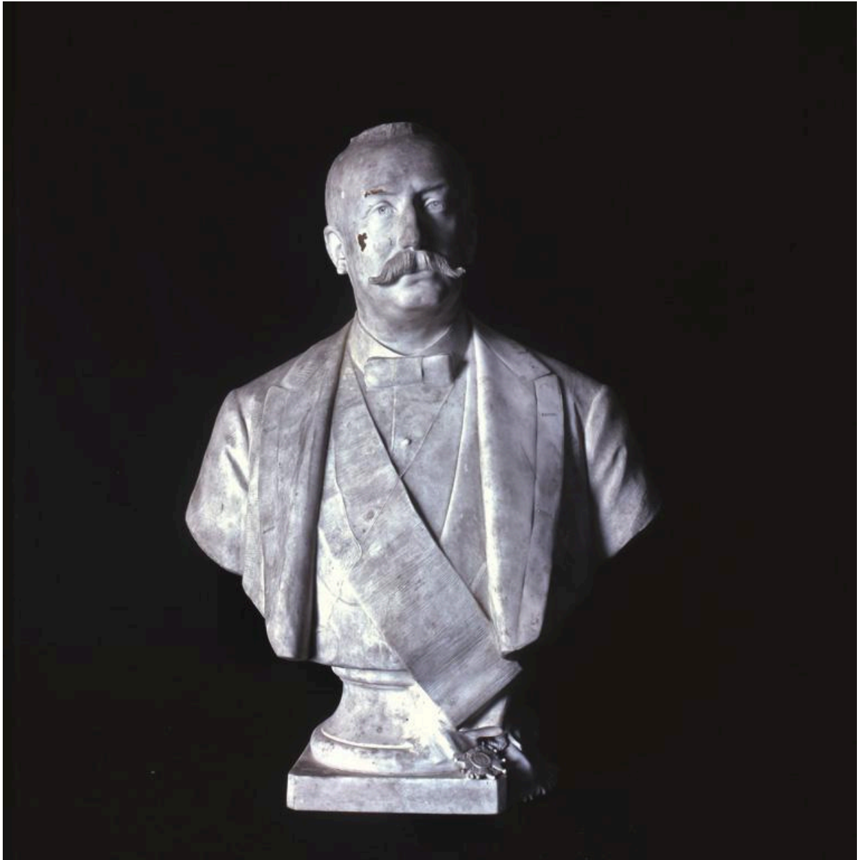
Vue du buste.