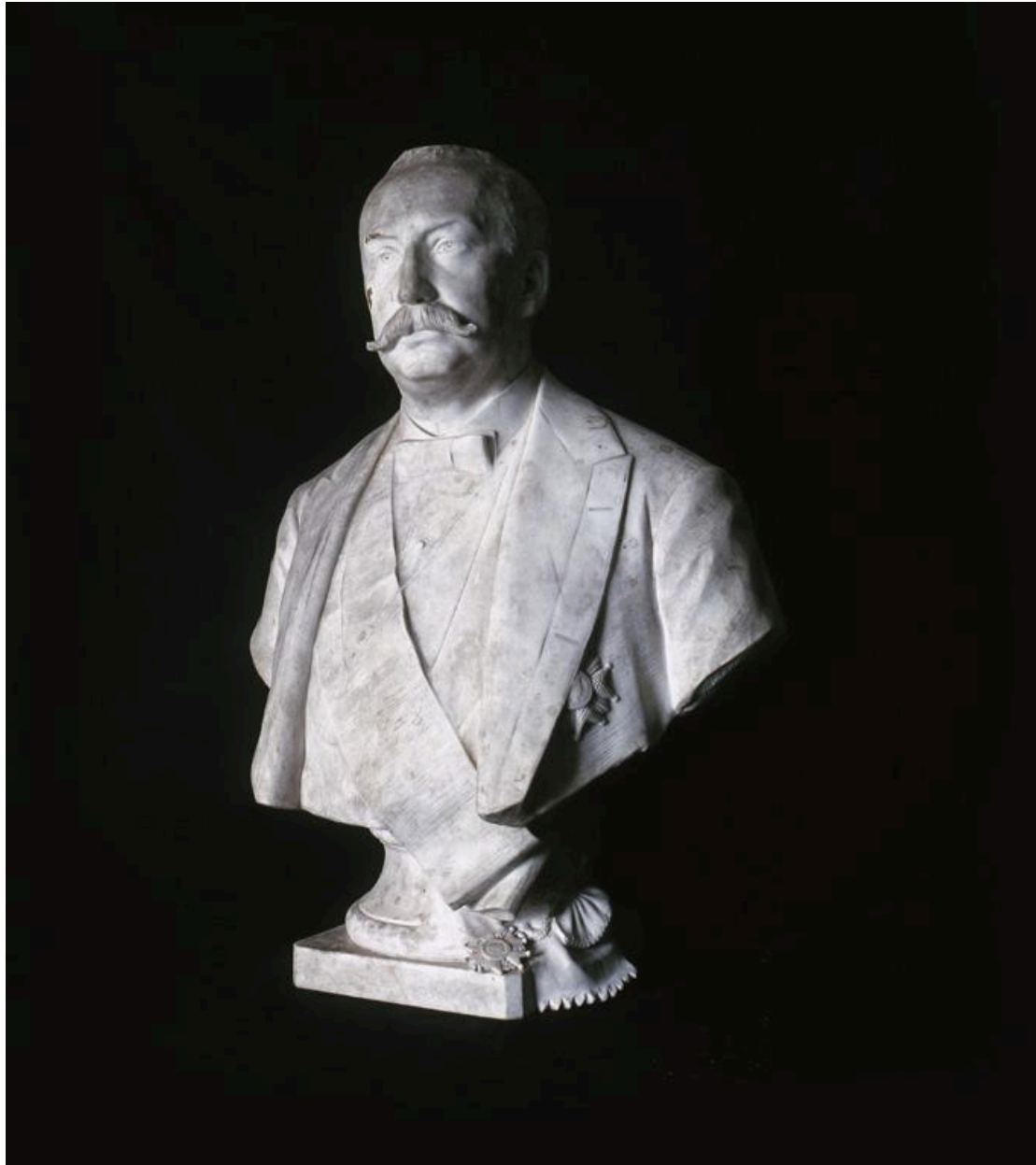
Vue du buste, de trois-quart.